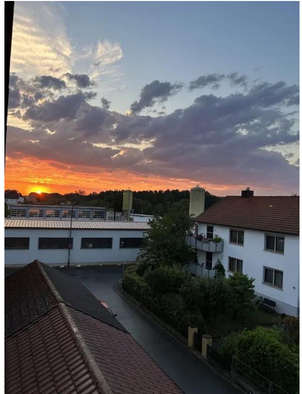
Ausblick aus der Küche