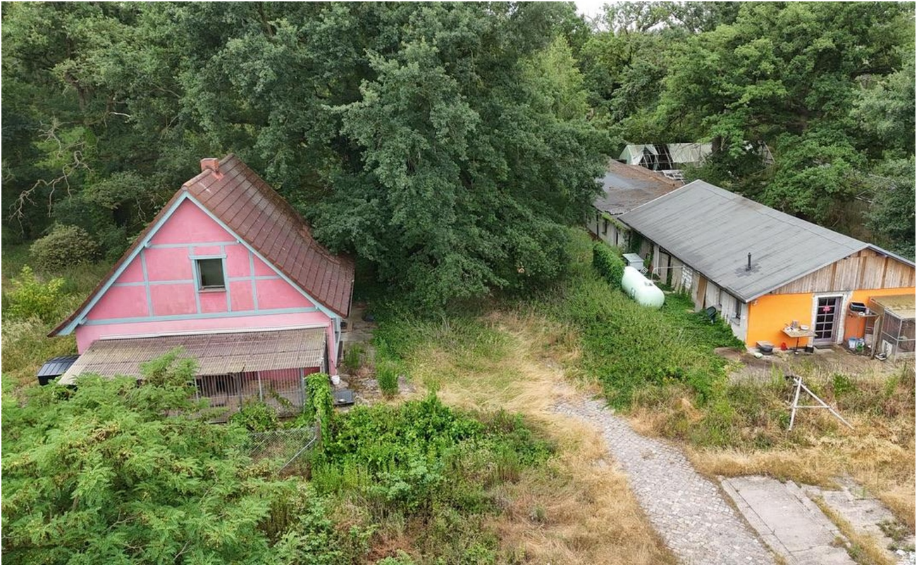
Beide Häuser von außen