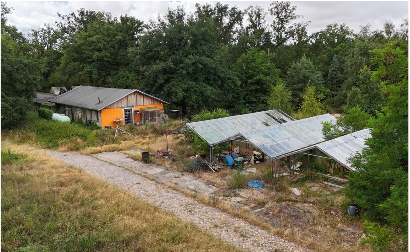
Außenansicht, Gewächshaus, anla