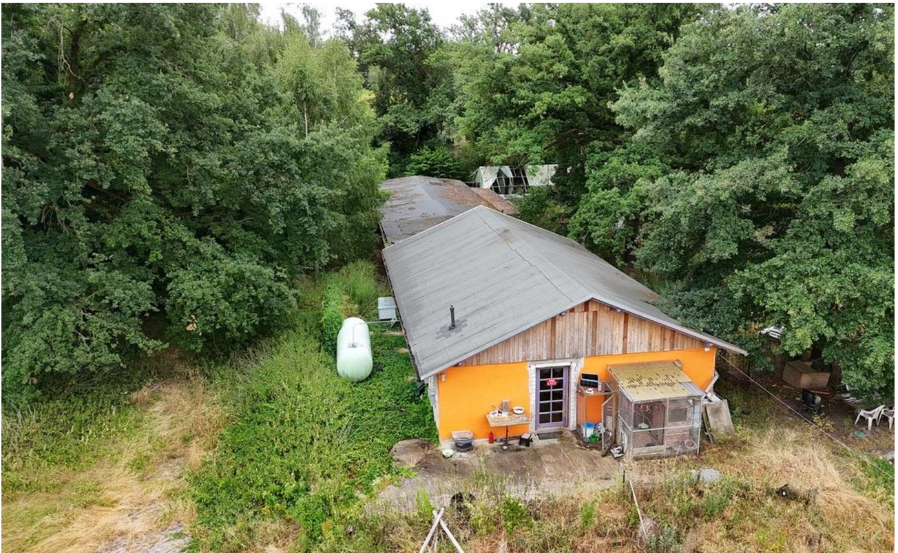
Außen Sicht Haus