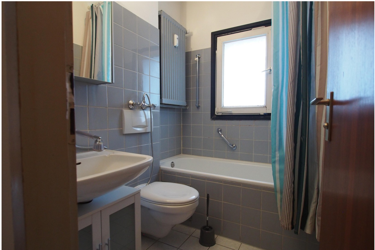
Bad mit Badewanne und Fenster