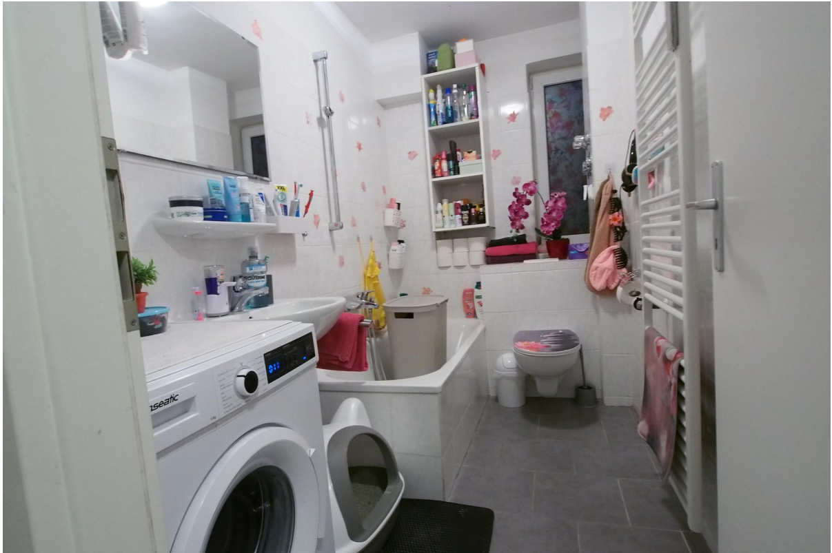
Bad mit Badewanne