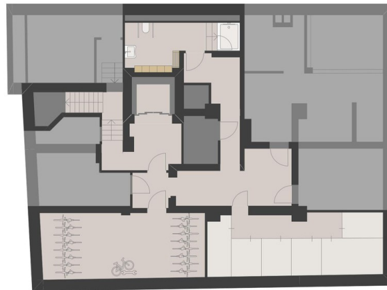
MIETERKELLER 1. Untergeschoss