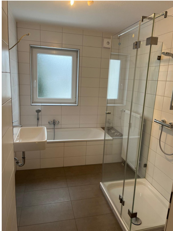
Bad mit Wanne und Dusche