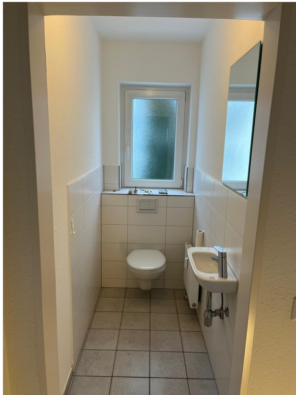
WC, neue Türen folgen noch