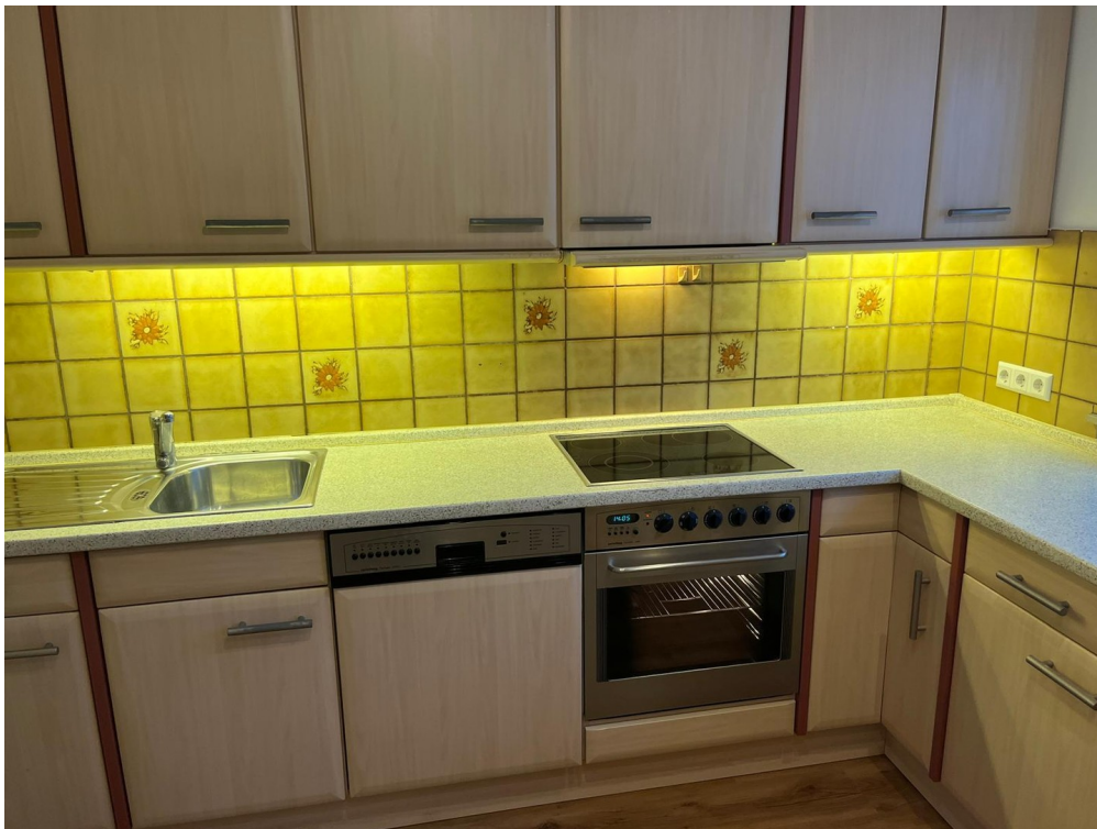
neue Küchenrückwand folgt noch