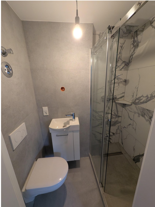
Badezimmer im SZ