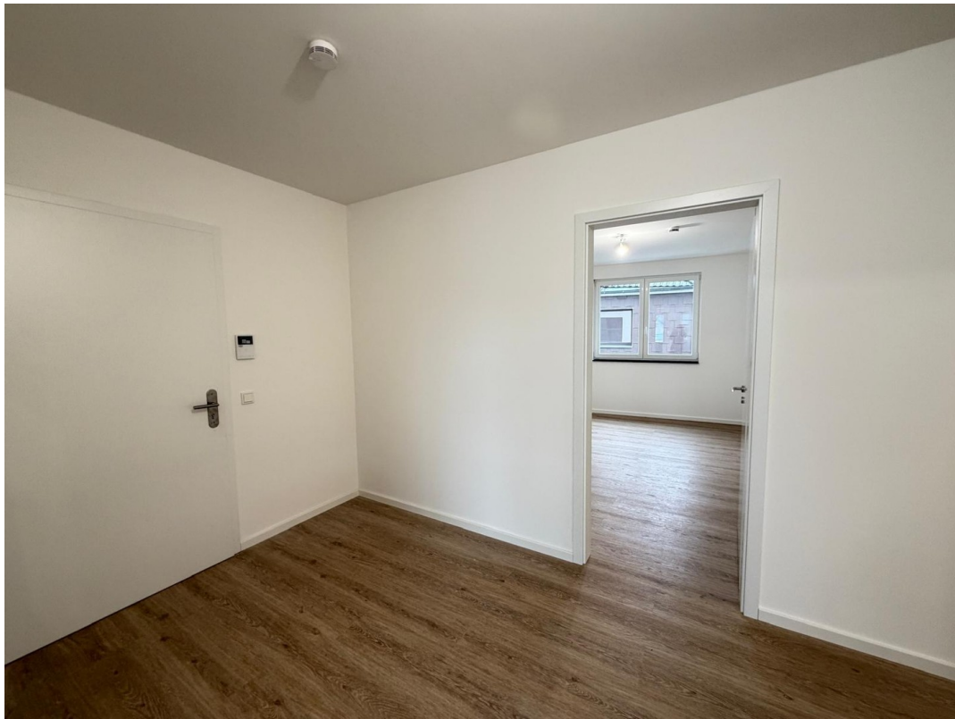
Eingang und Videosprechanlage