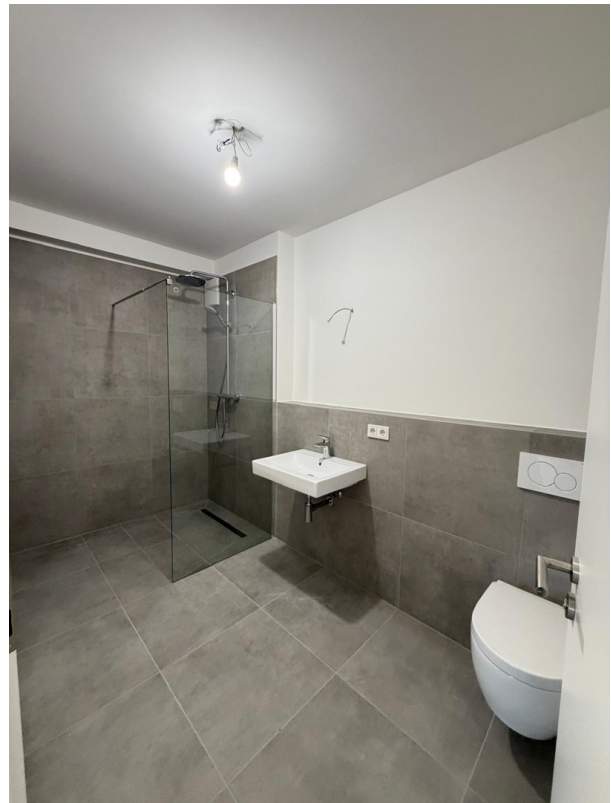
Badezimmer mit großer Dusche