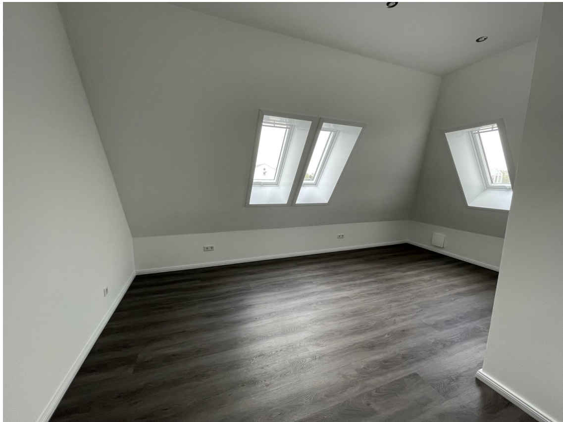
Schlaf- / Kinderzimmer / Büro