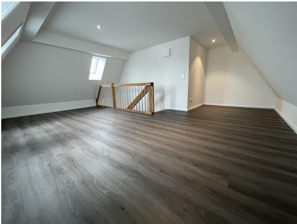
Schlaf- / Kinderzimmer / Büro