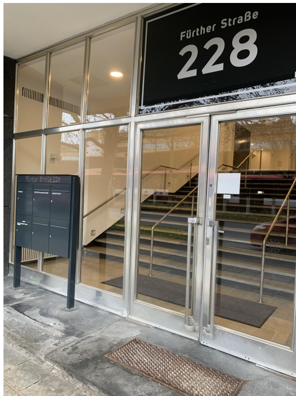
Eingang zur Büroliegenschaft