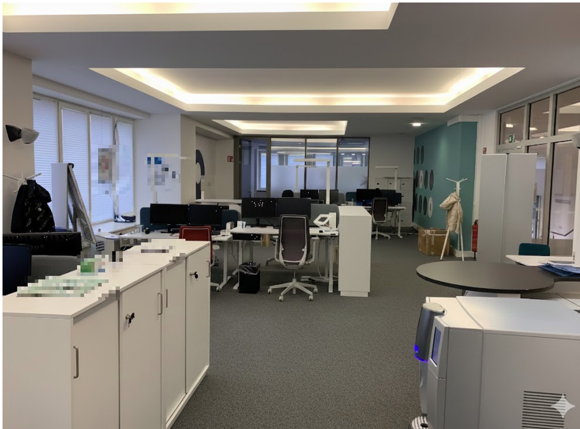
weiter, großzügiger open space