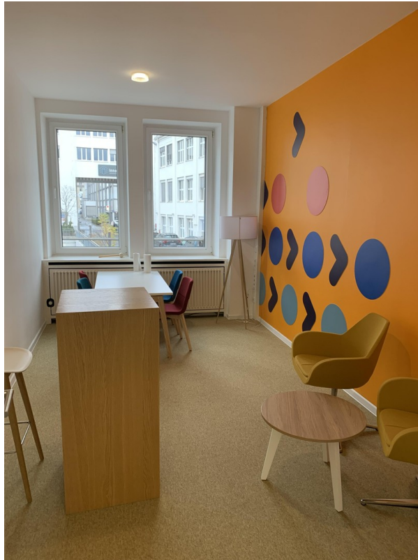
Einzelbüro als thinktank