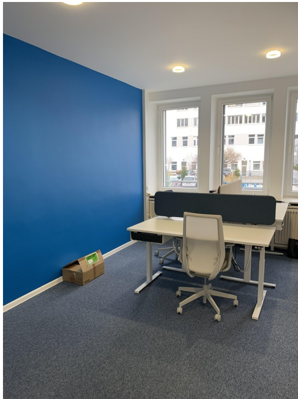
Einzelbüro 3 Arbeitsplätze