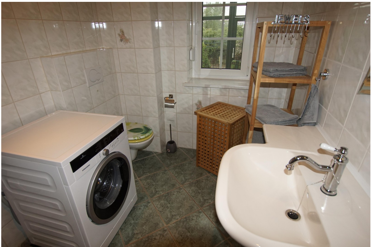
Bad im EG