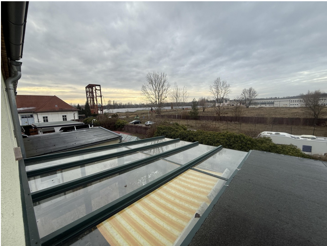
Aussicht zum Parkplatz