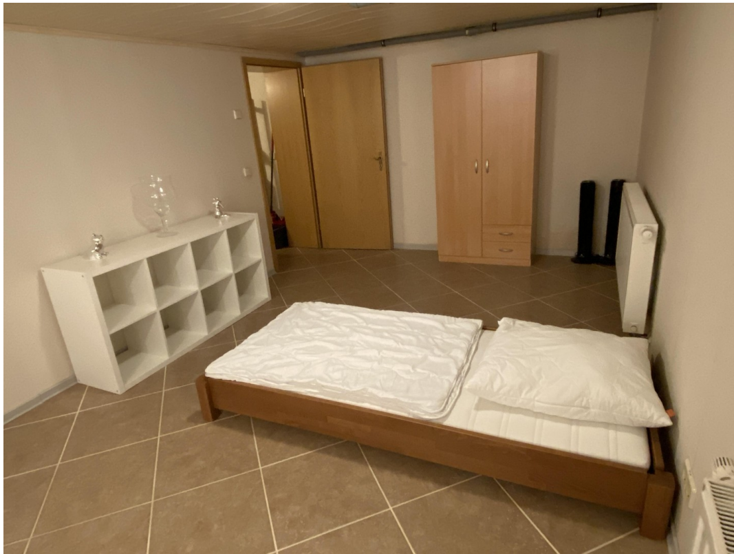
Büro Hobbyraum im Keller