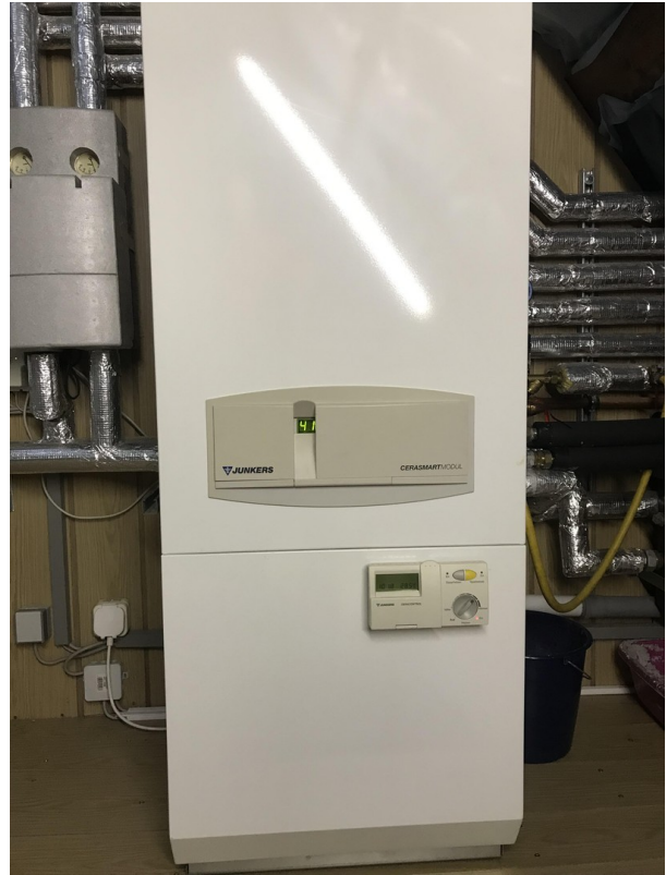
Gastherme im Dach