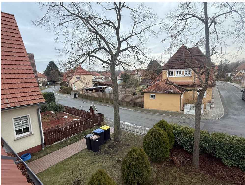
Blick vom OG zur Straße