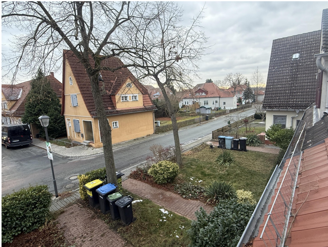
Blick vom OG zur Straße