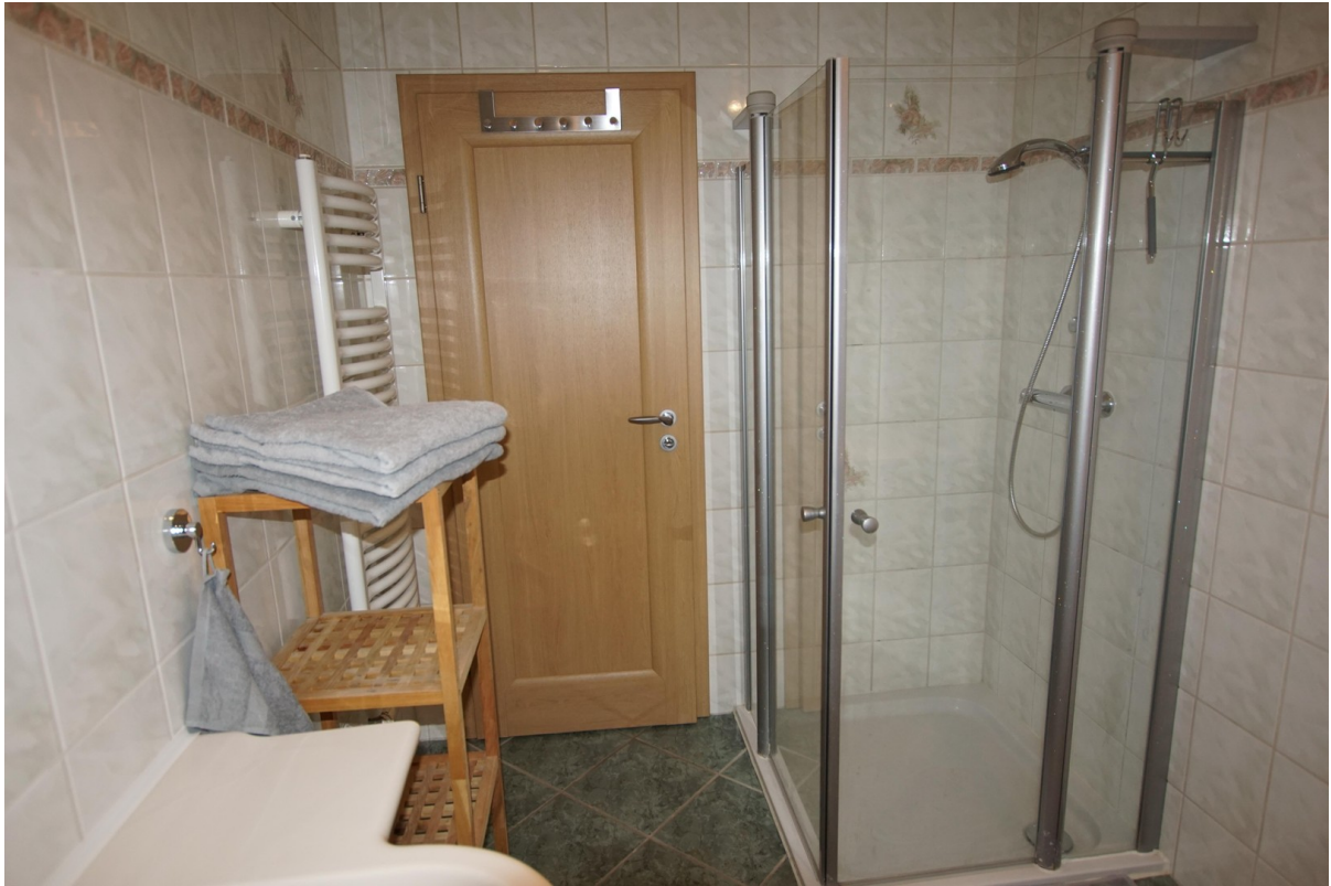
Bad mit Dusche und Fenster EG