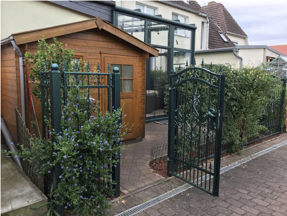
Gartentor zum Parkplatz