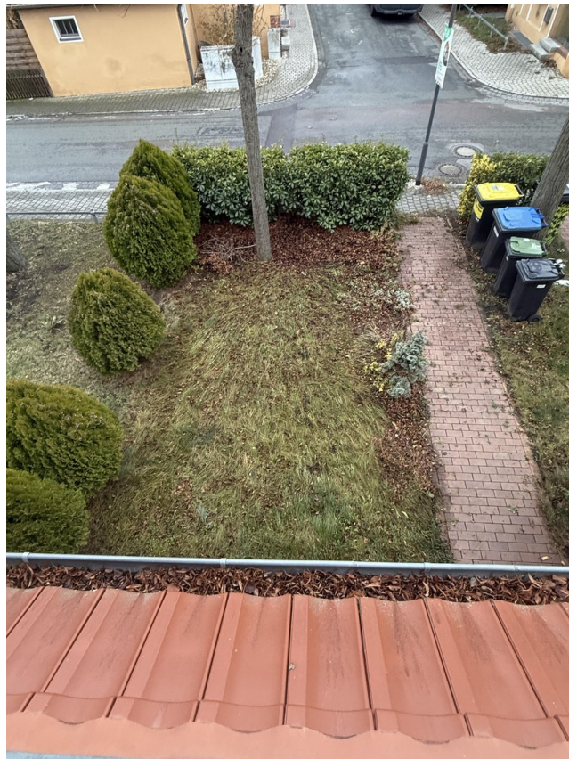
Blick vom OG zum Vorgarten