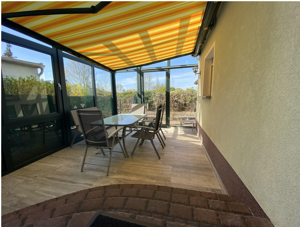
Wintergarten mit Markise