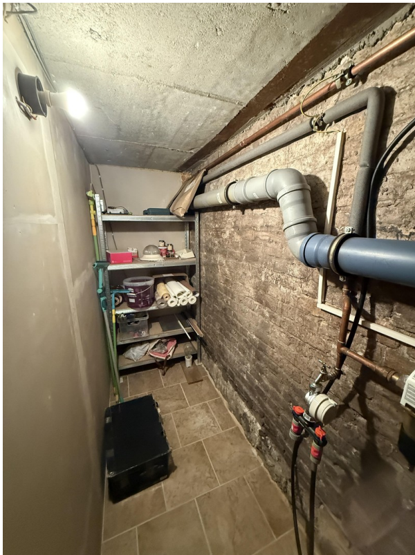
Zählerraum für Gas und Wasser