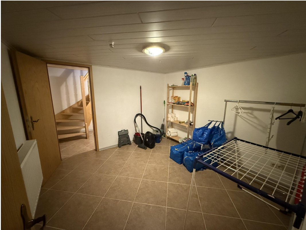
Gästezimmer im Keller