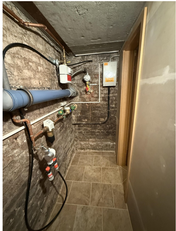
Zählerraum für Gas und Wasser