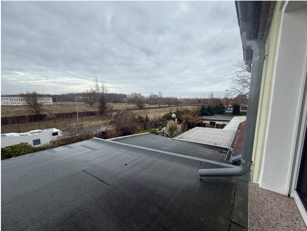
Aussicht zum Parkplatz