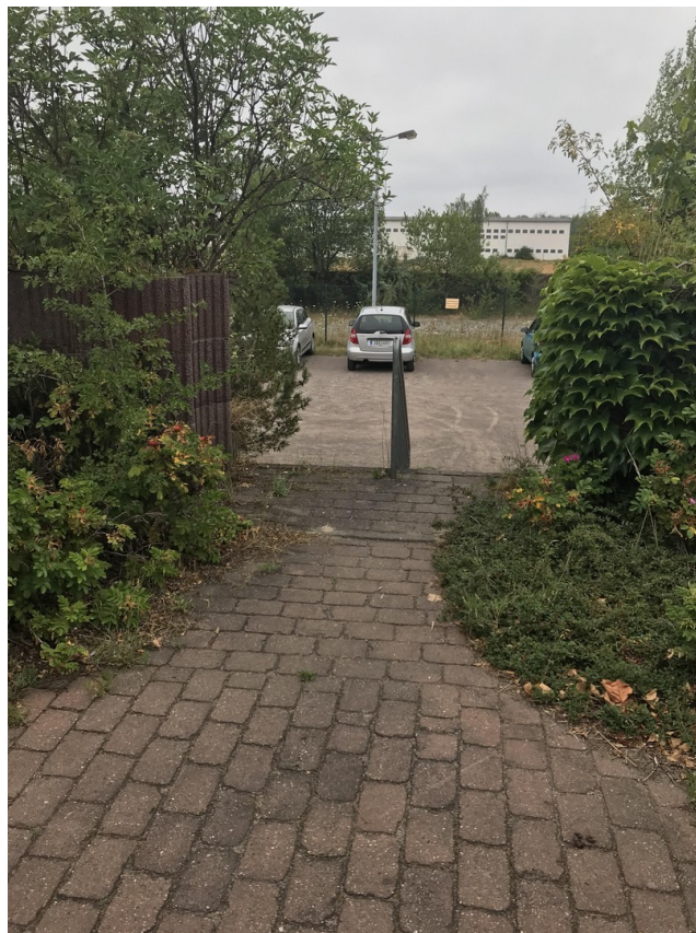
Treppe zum Parkplatz