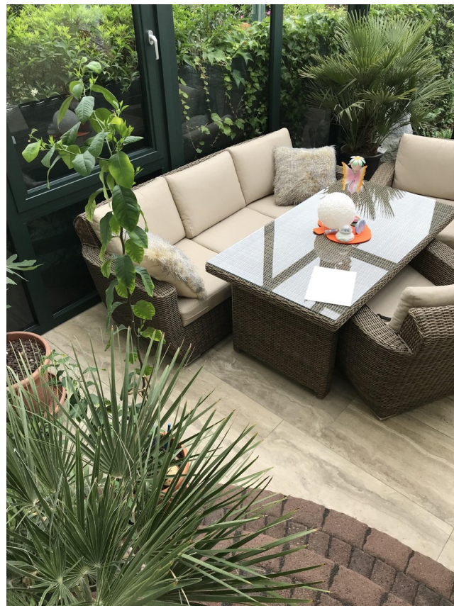
Wintergarten mit Loungemöbel