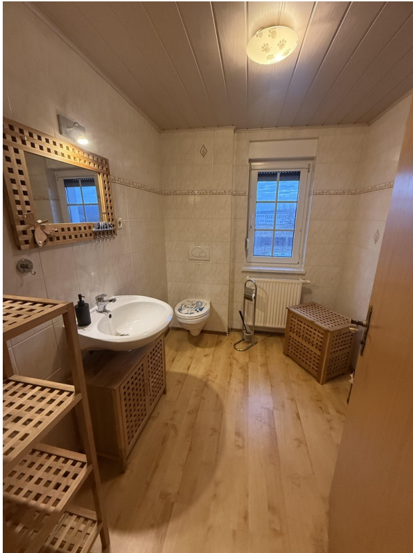
Bad WC im OG