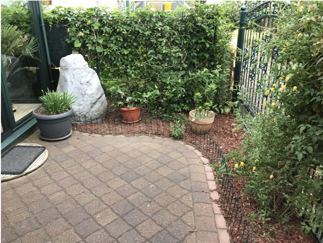
kleiner Garten, Grillplatz