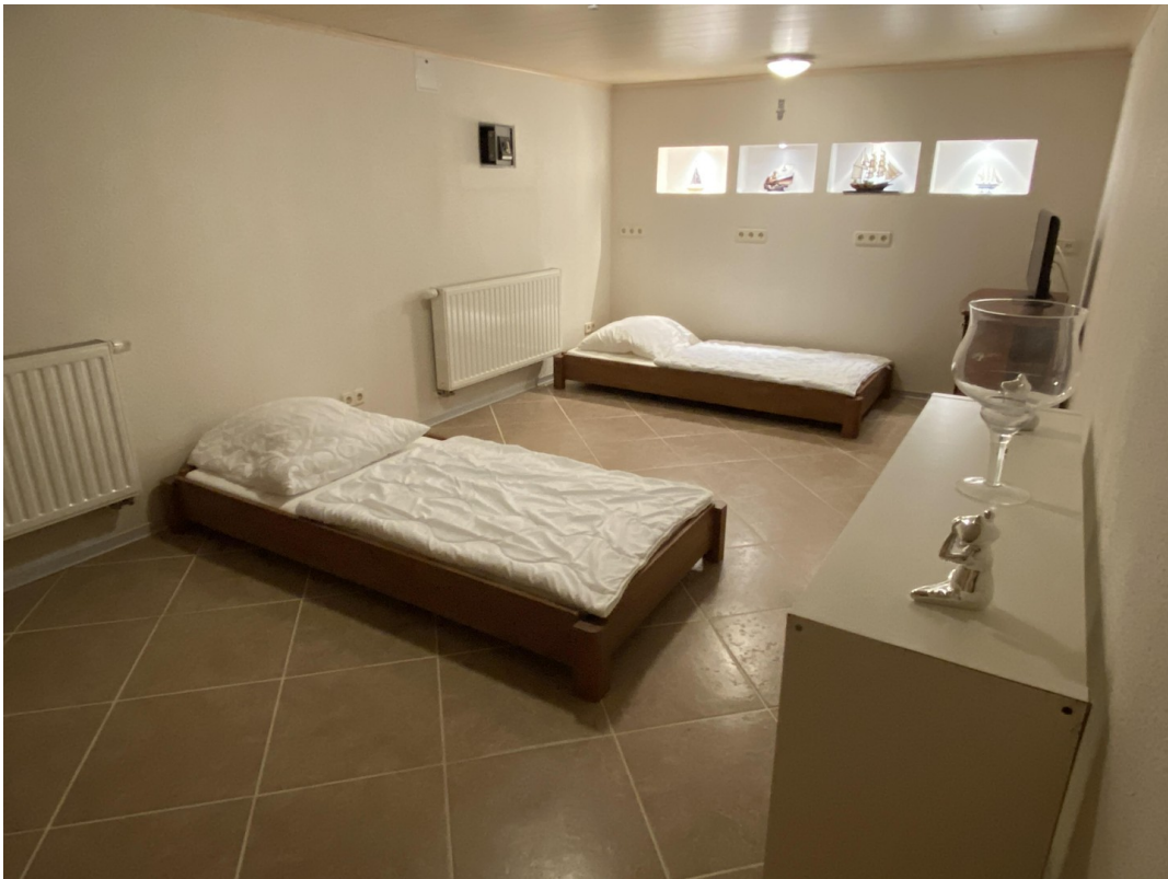
Büro Hobbyraum im Keller