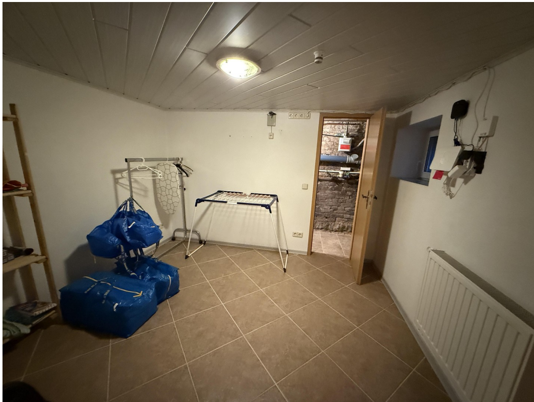
Gästezimmer im Keller