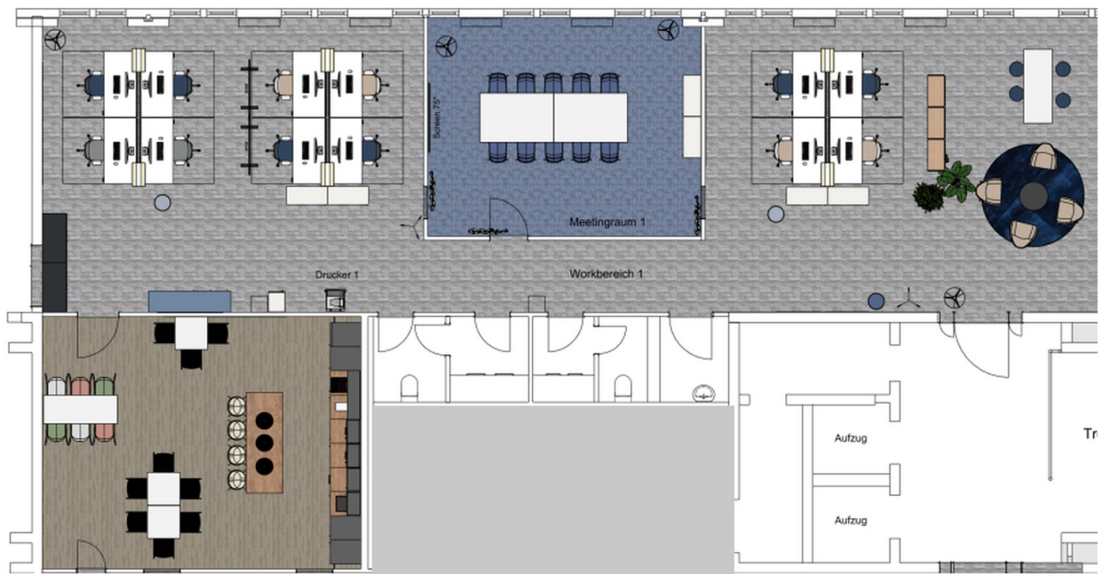
Variante ohne Mitnutzung Küche