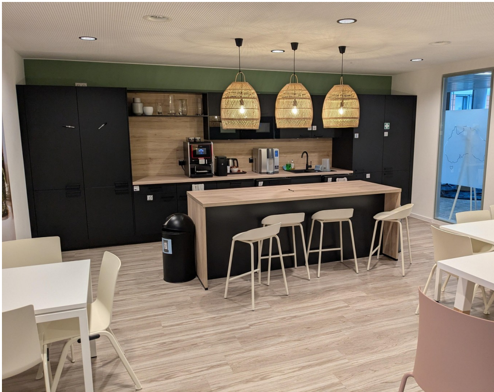
Optionale Mitnutzung der Küche