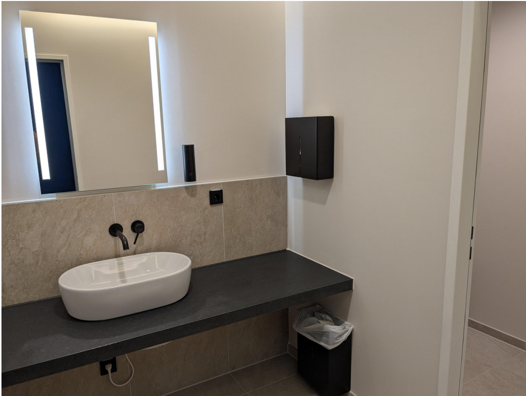
WC Anlage - neu und modern