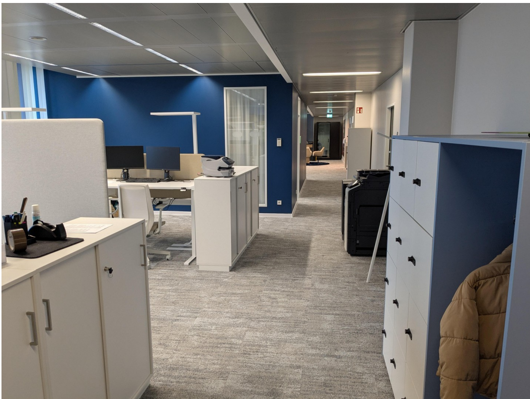
Hinterer open space Bereich