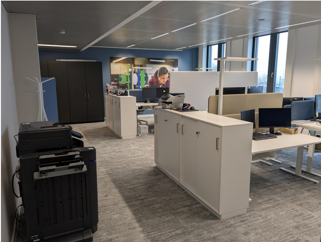
Hinterer open space Bereich