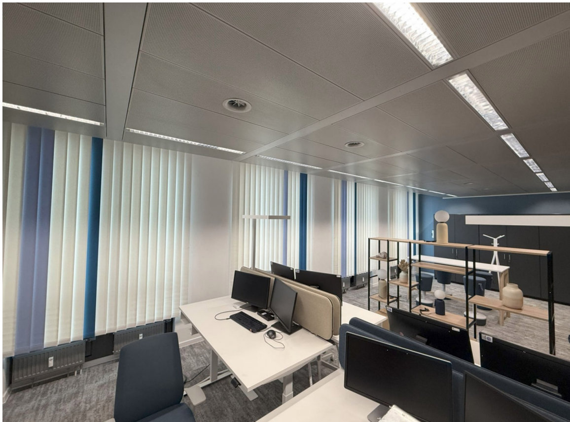
Blickrichtung Eingang Büro