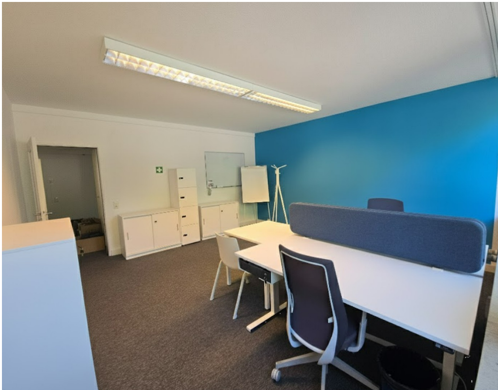
Büro 1, Innenansicht