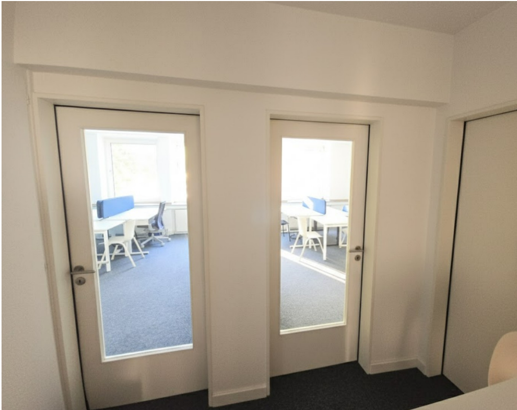
Ansicht Flur zu Büro 1+2