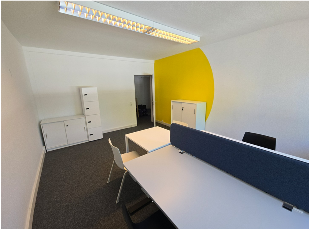
Büro 2, Innenansicht