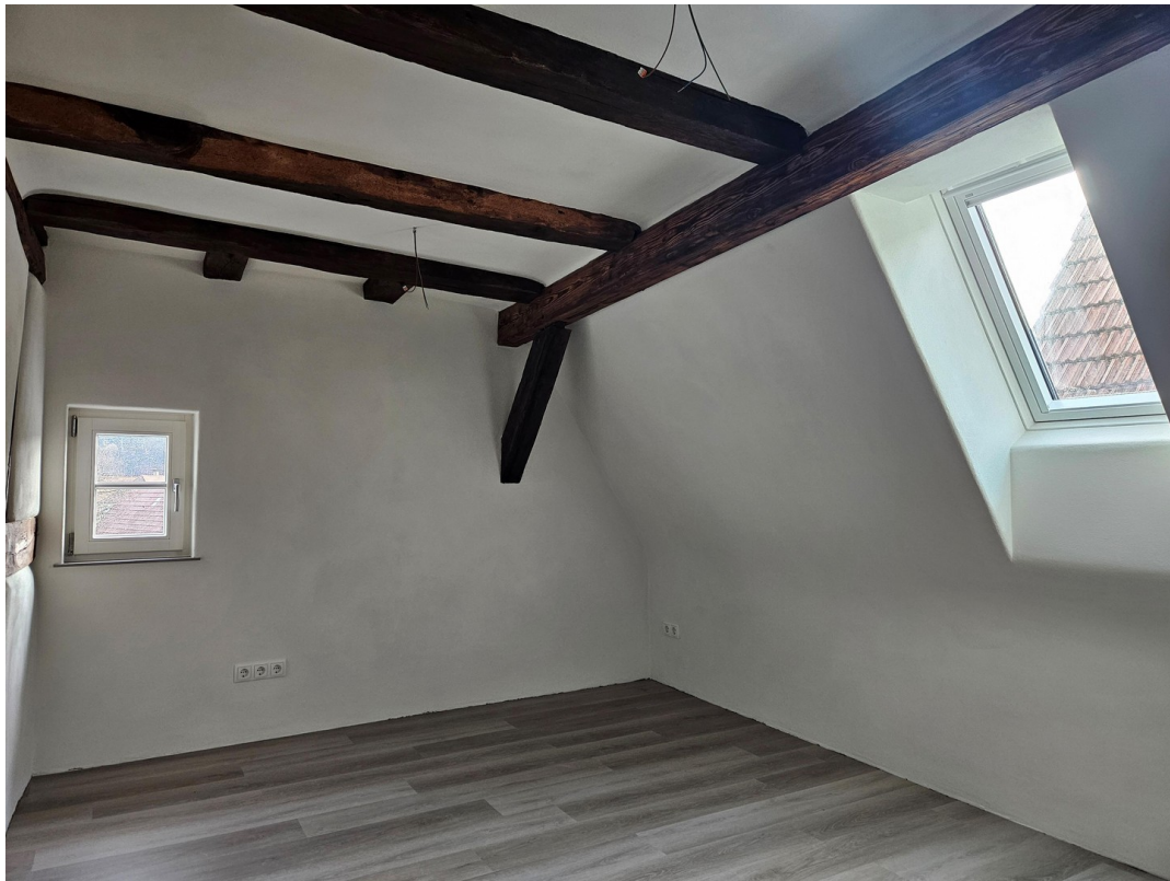
Schlafzimmer 02 DG