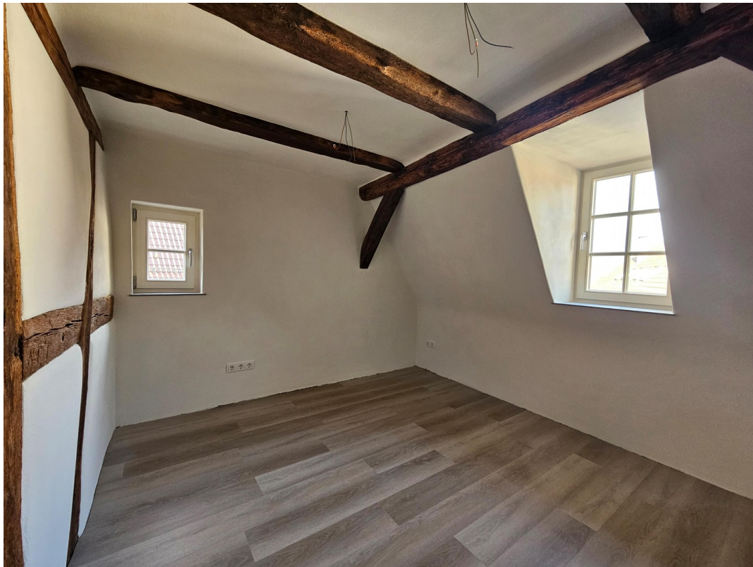
Schlafzimmer 03 DG