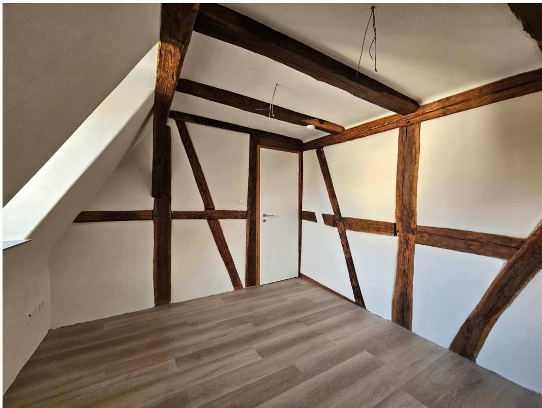
Schlafzimmer 03 DG