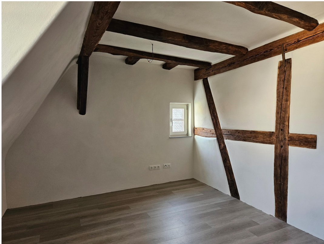
Schlafzimmer 01 DG