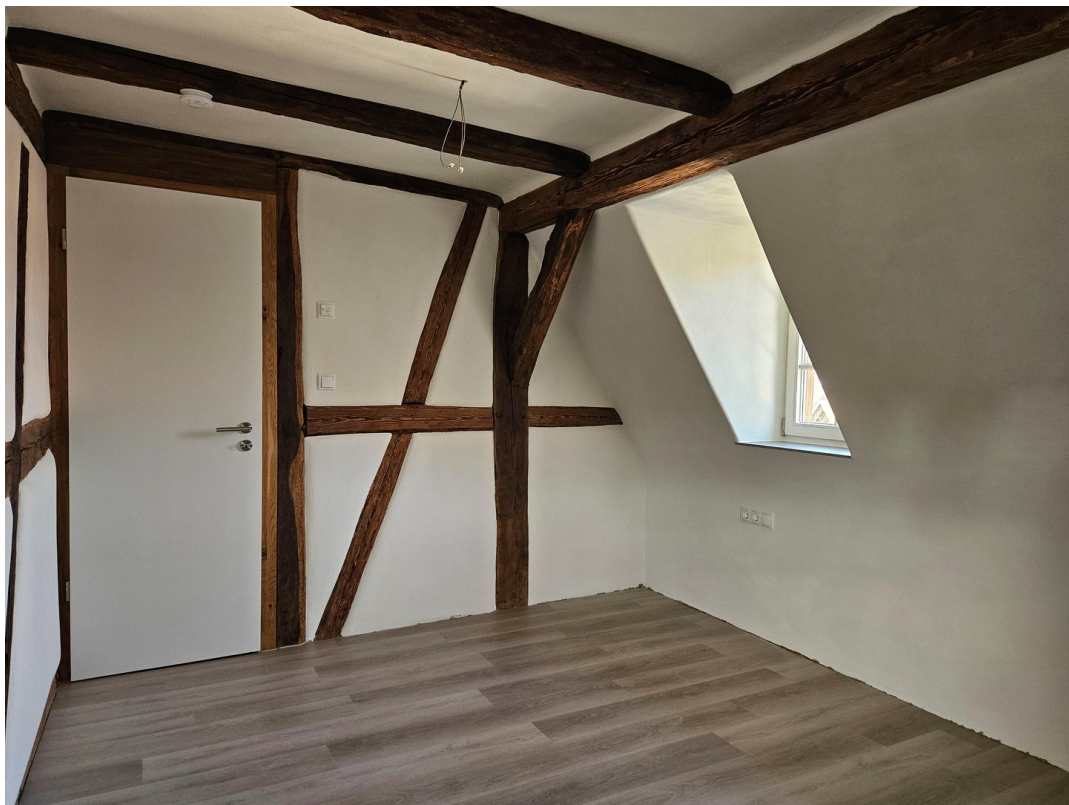
Schlafzimmer 01 DG