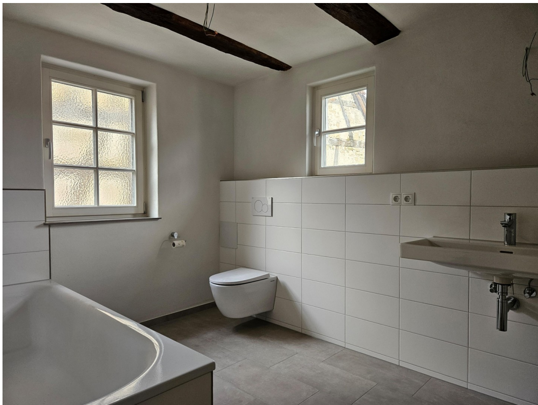
Tageslichtbad mit Wanne OG