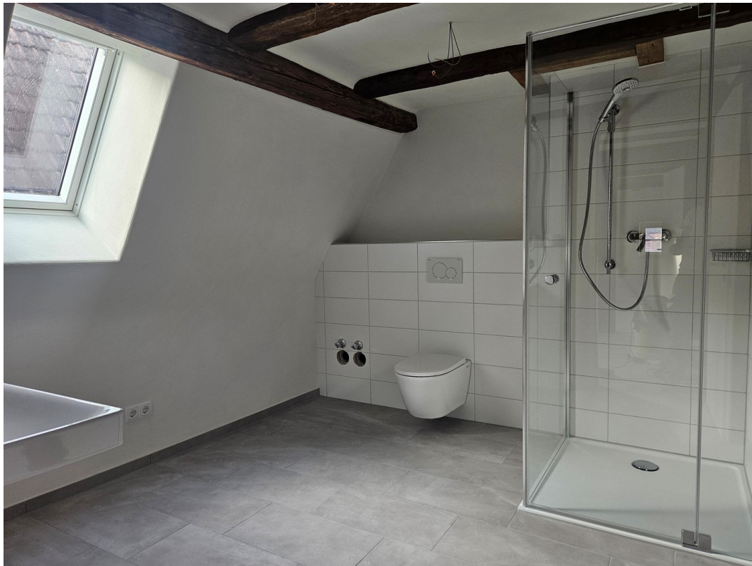
Tageslichtbad mit Dusche DG