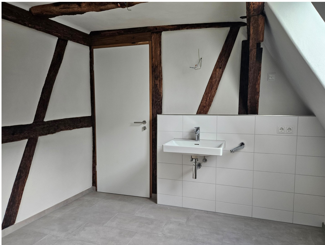
Tageslichtbad mit Dusche DG