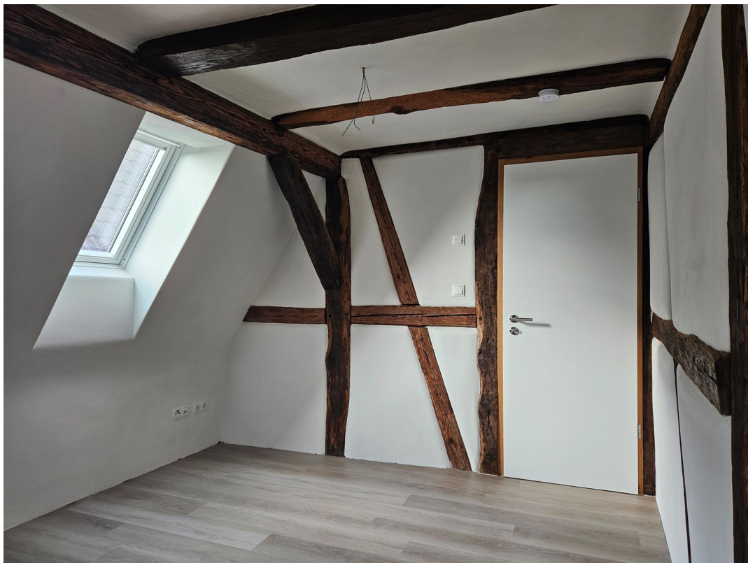
Schlafzimmer 02 DG