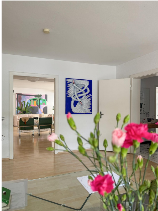
Essen / Wohnen