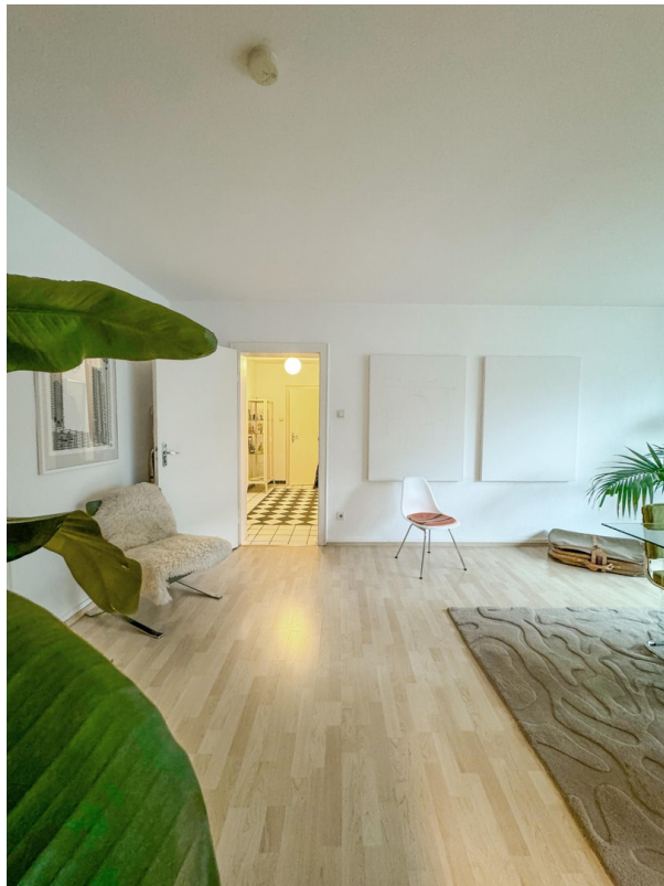
Essen / Blick in Diele