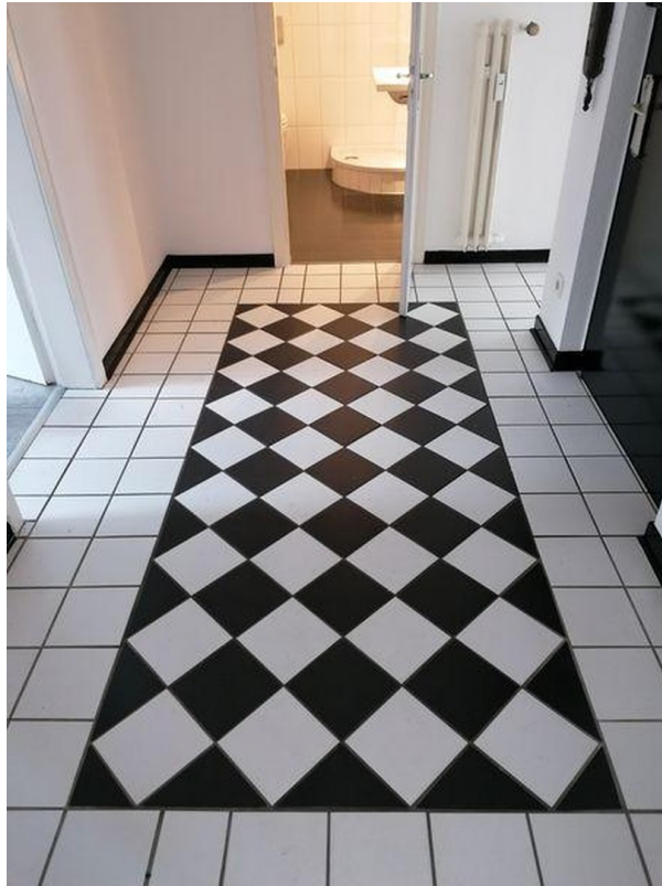
Diele / Blick in Gästebad