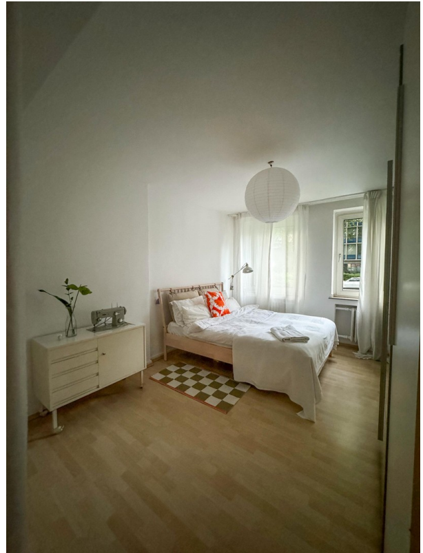
Gäste / Kind EG