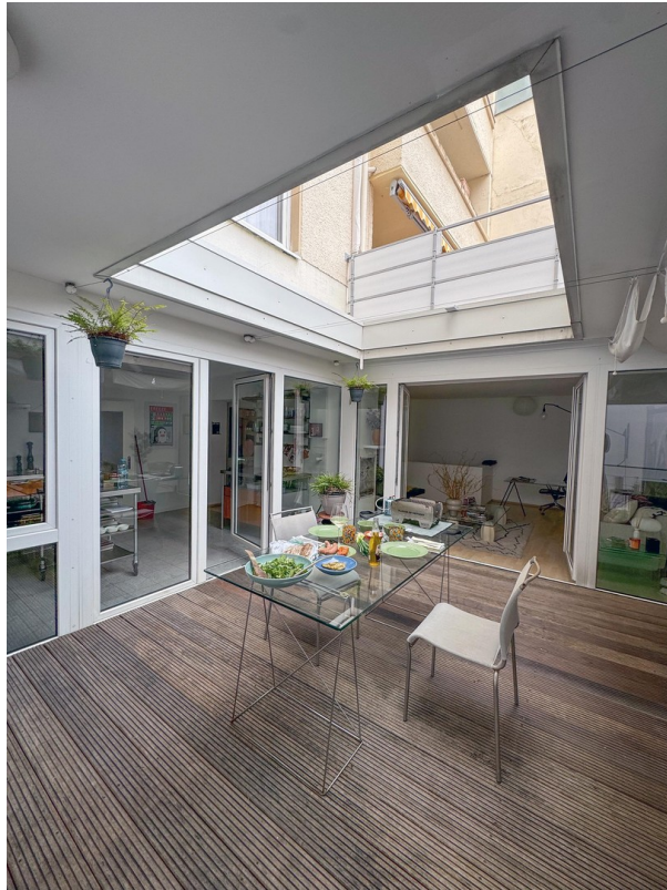
Atrium / Patio