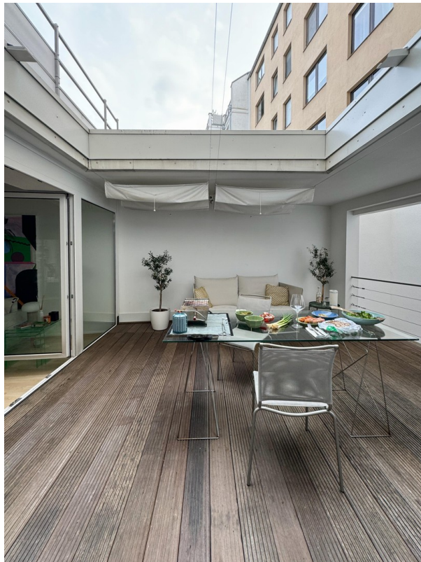
Atrium / Patio