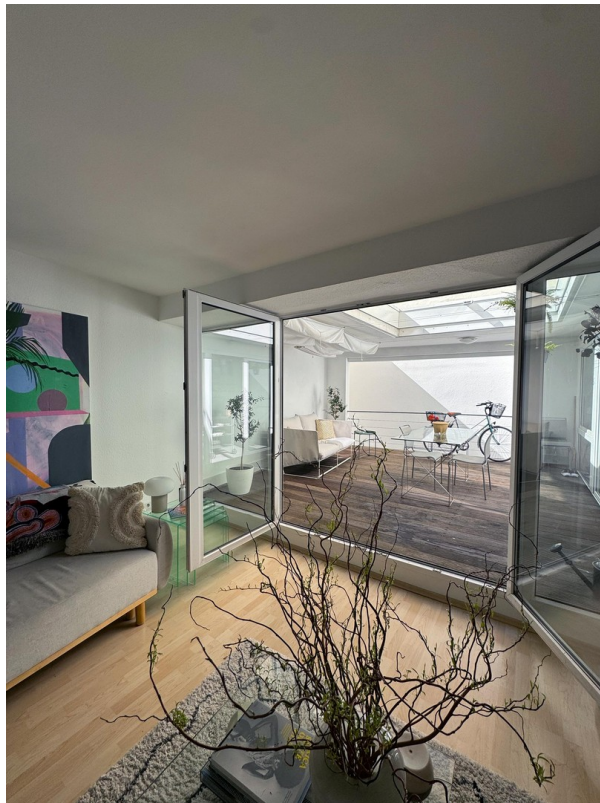
Wohnen / Patio