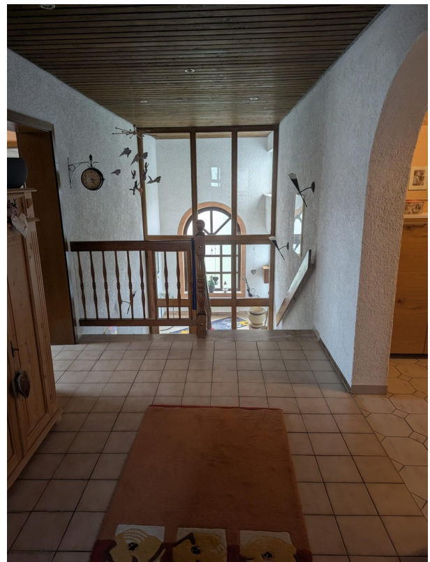
Treppenhaus/ Flur oben