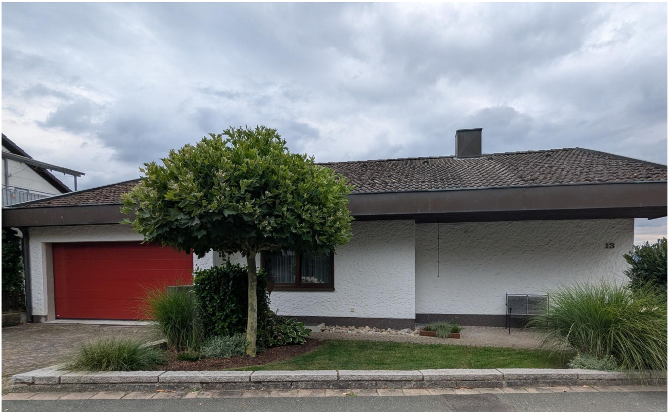
Nordseite mit Garage