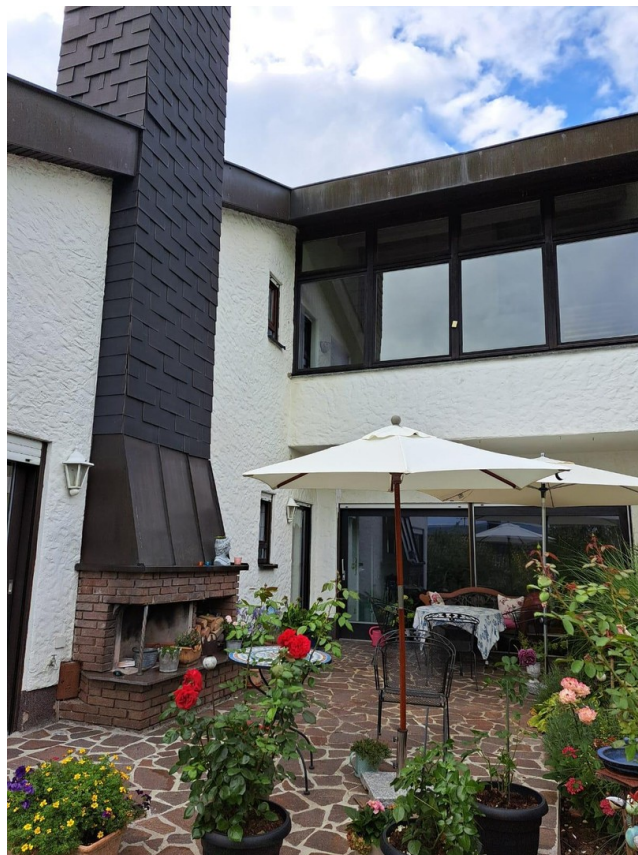
Terrasse mit Aussenkamin