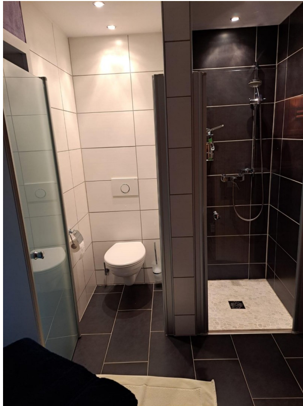
Sauna Dusche und WC