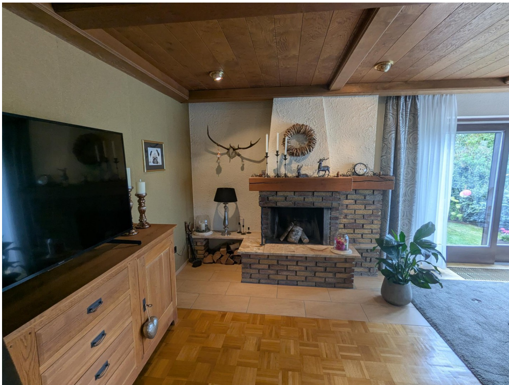
WoZi m. Schiebetür zu Terrasse