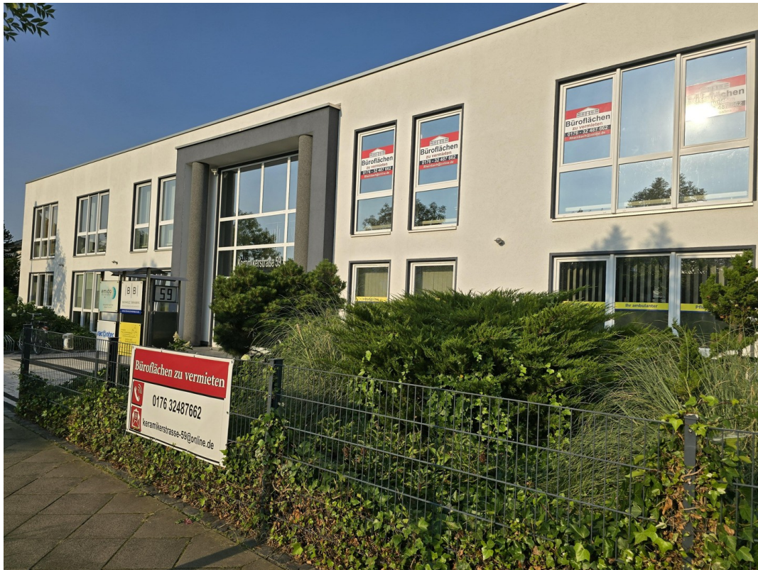
Keramikerstraße 59, Rheinbach