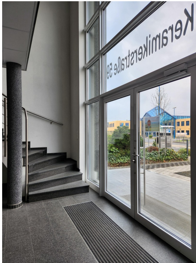
Foyer / Eingangsbereich