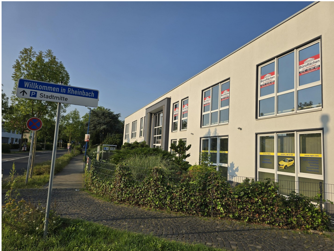
Am Kreisel / Ärztehaus