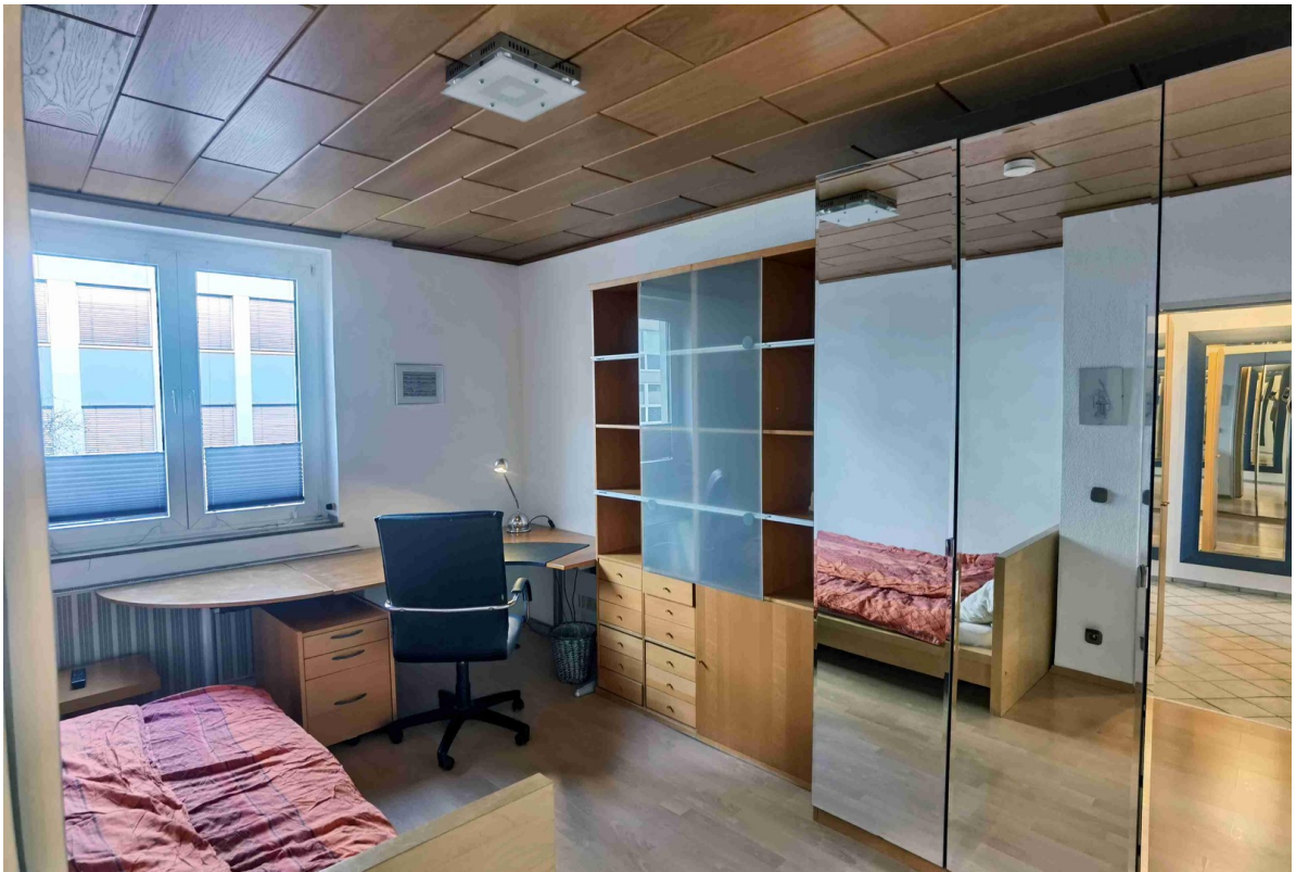
Arbeiten / Schlafen