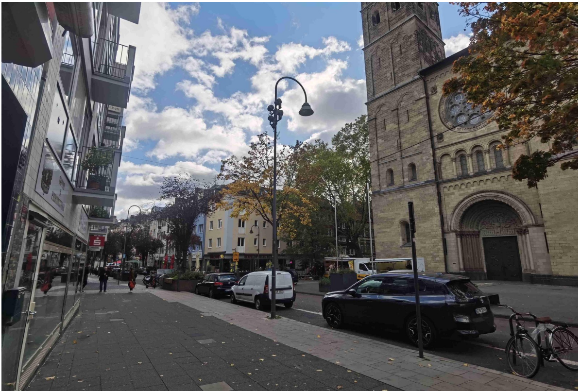
Lage / Umgebung