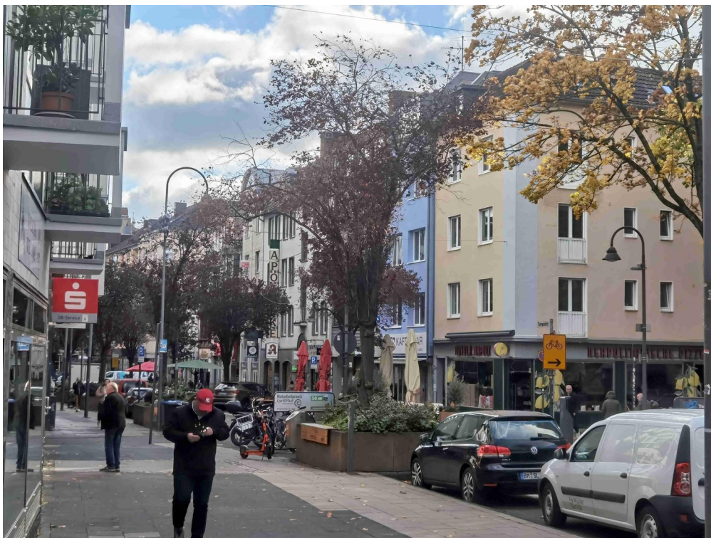
Lage / Umgebung