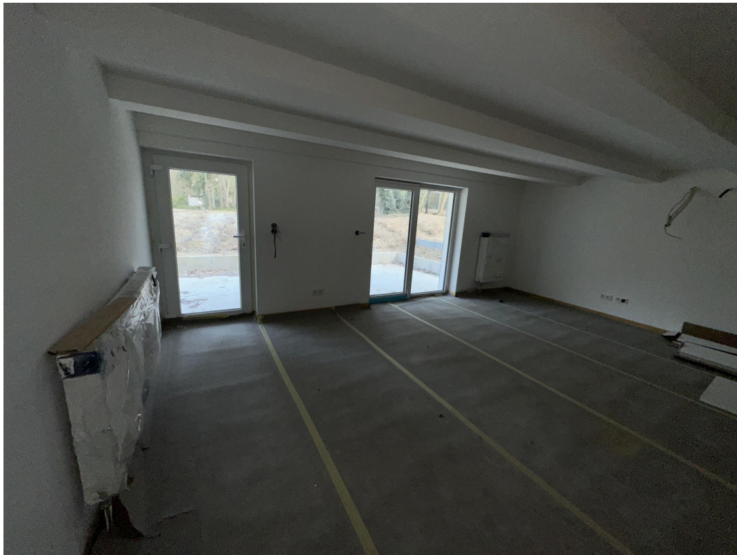
UG 40m² Raum