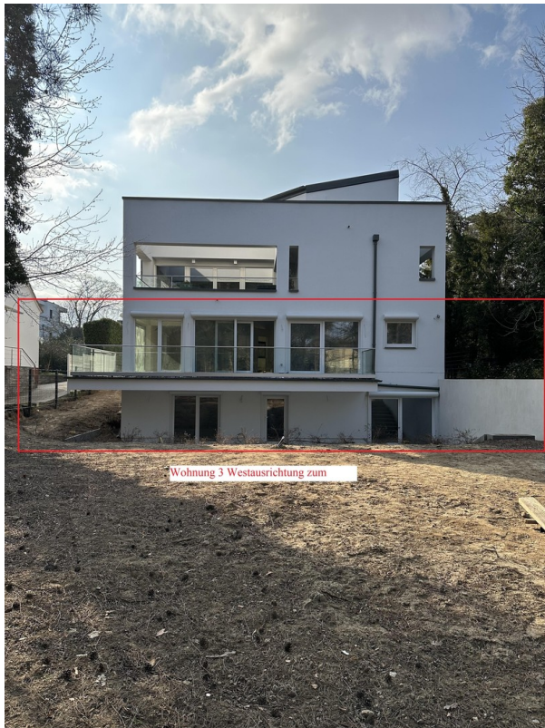
Fassade WE Ansicht Gartenseite