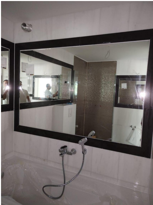
Bad EG im Bau