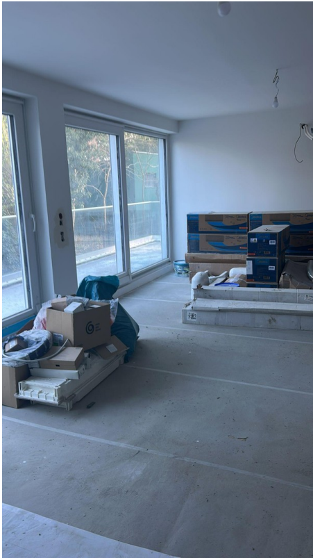
Wohnzimmer im Bau