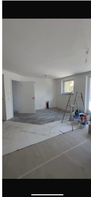
Küchenbereich im Bau