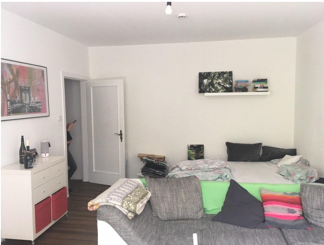
Gr. Zimmer 1