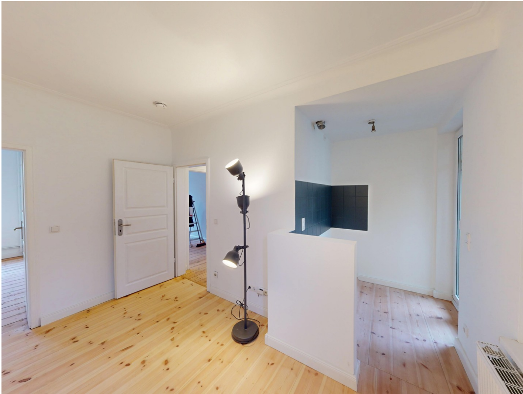
Wohnzimmer / Offene Küche