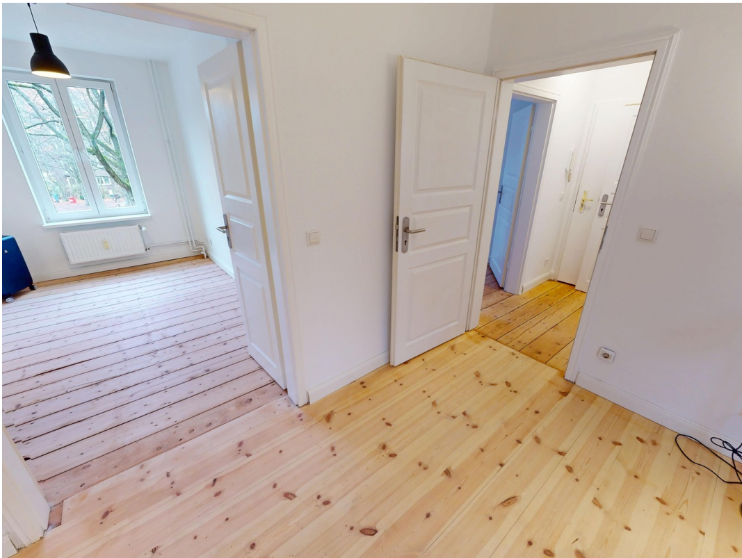
Wohnzimmer / Zimmer 2 / Flur