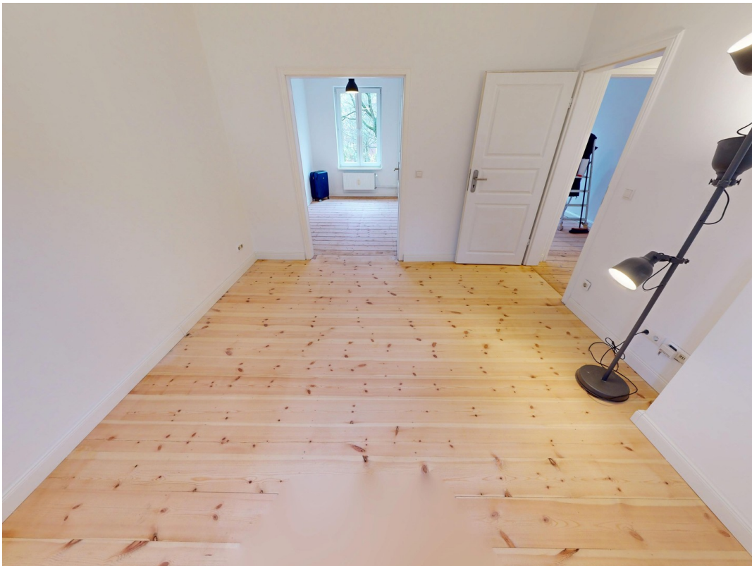
Wohnzimmer / Zimmer 2