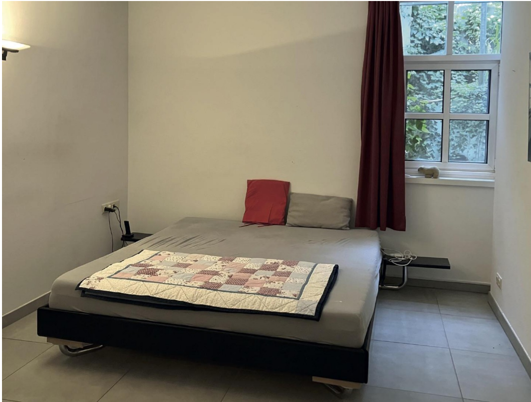
Raum 2 im Souterrain