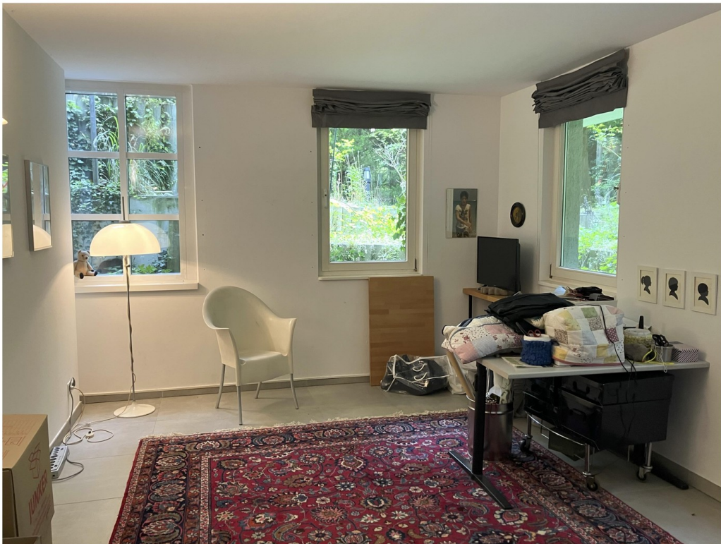
Raum 1 im Souterrain