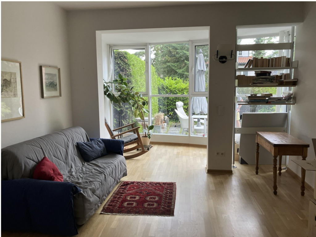
Arbeitszimmer mit Blick