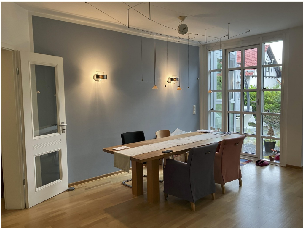
Wohnzimmer mit Ausgang