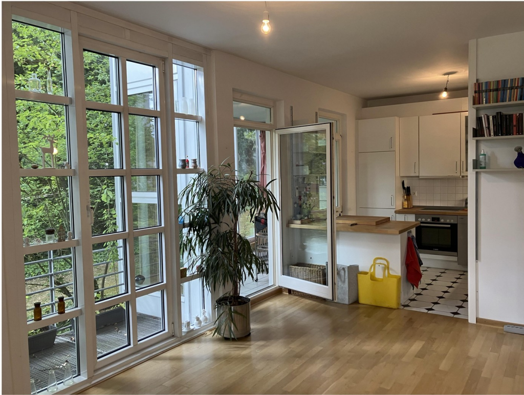
Wohnbereich mit Balkon