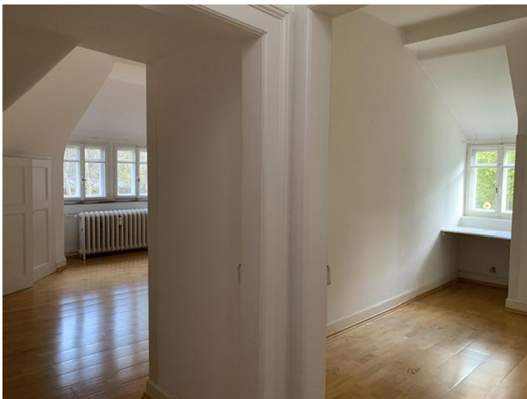
Zimmer 4 + 5