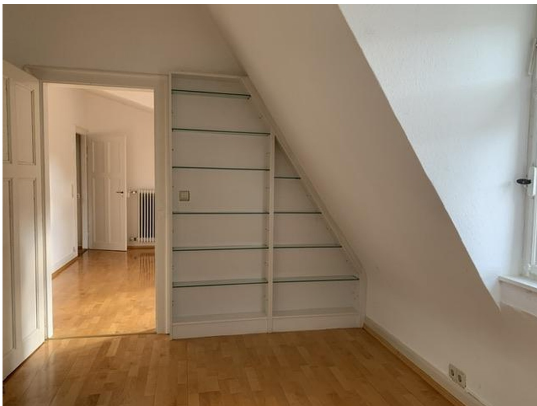
Zimmer 2 + 3