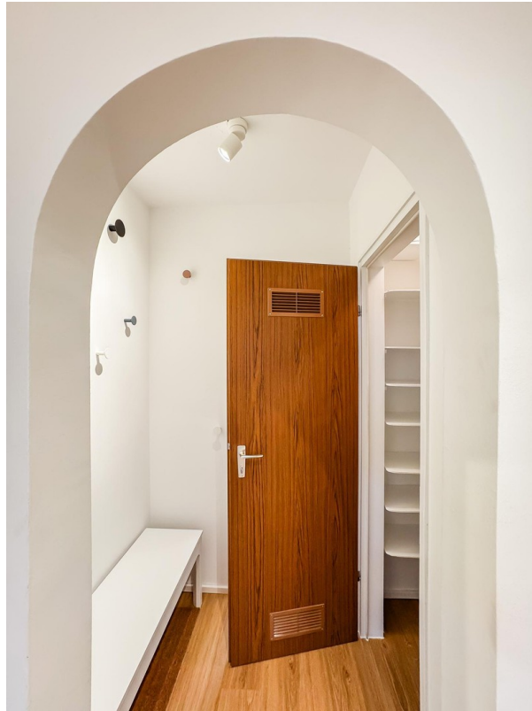
Flur - Bild b