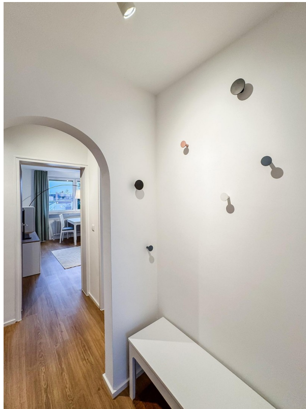
Flur - Bild c