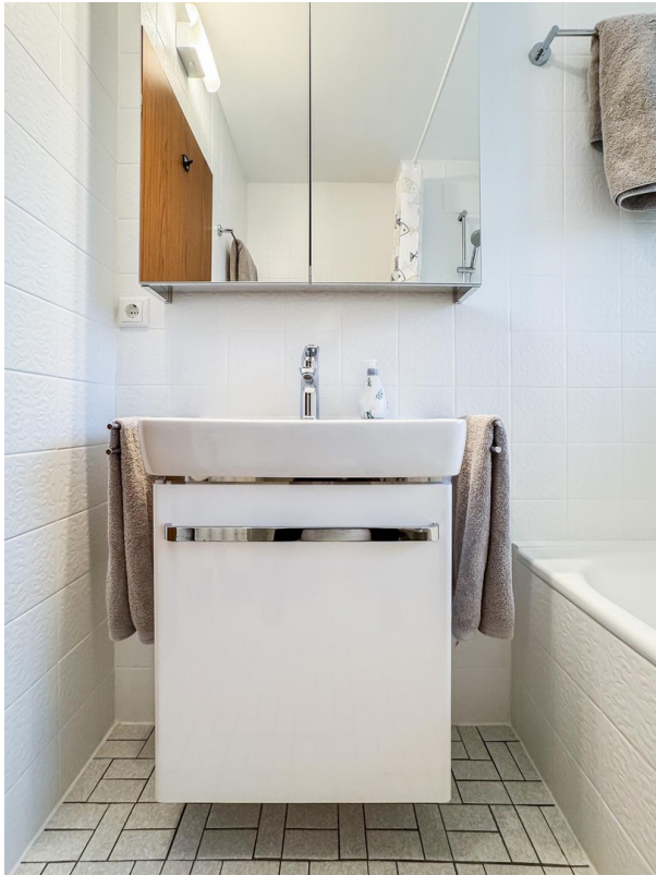
Bad - Bild a