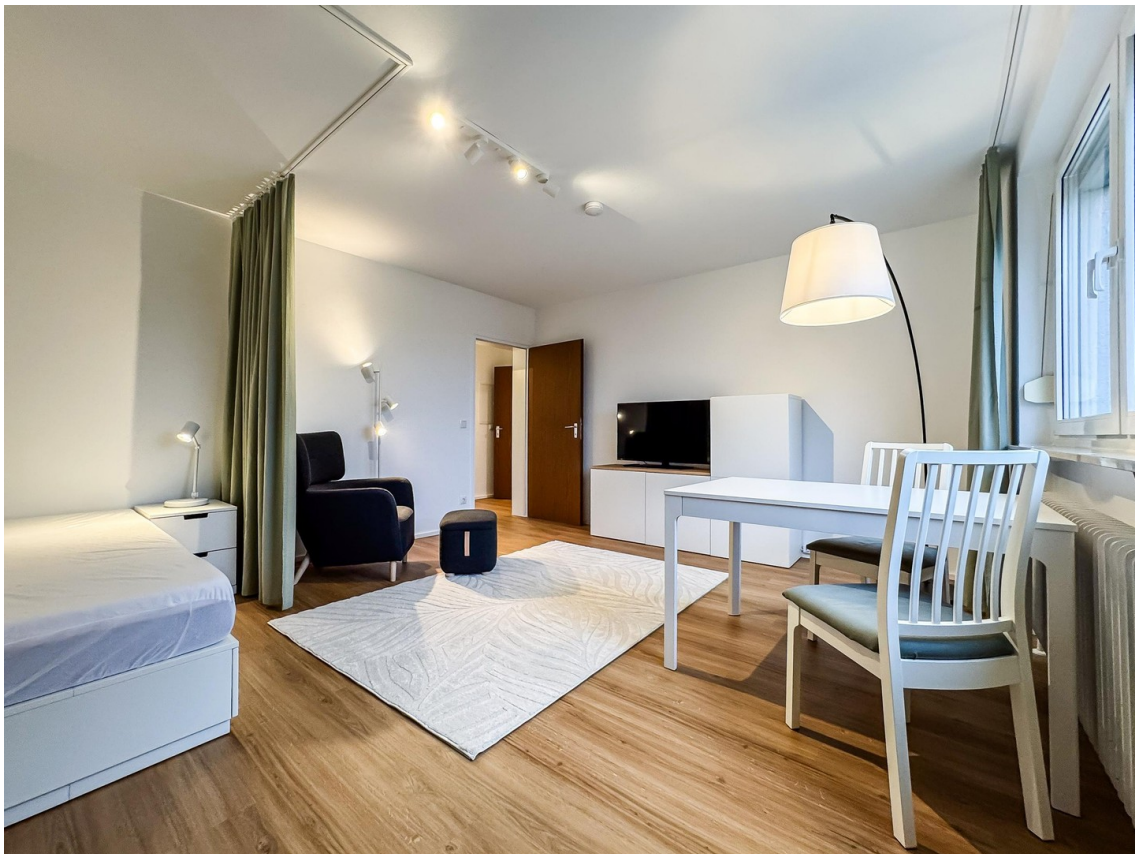
Zimmer - Bild b