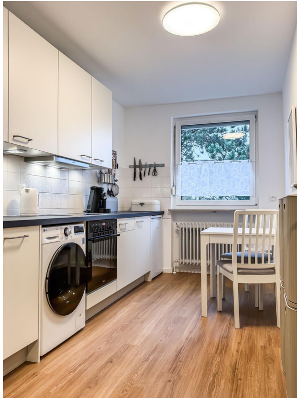
Küche - Bild a