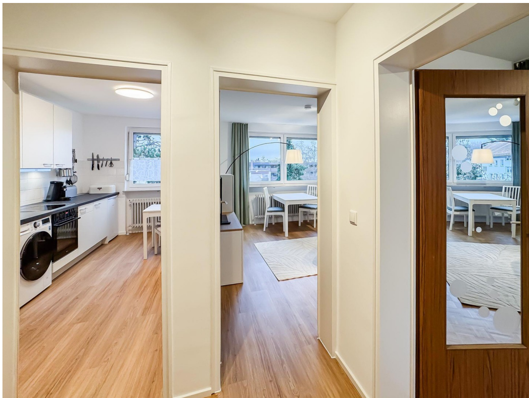
Flur - Bild a