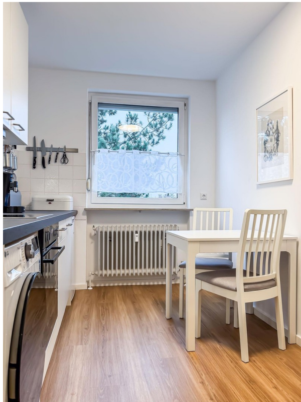
Küche - Bild b