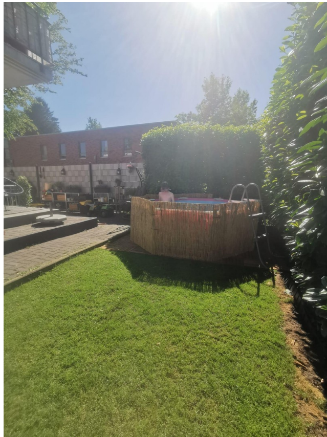
Garten mit kl. Pool