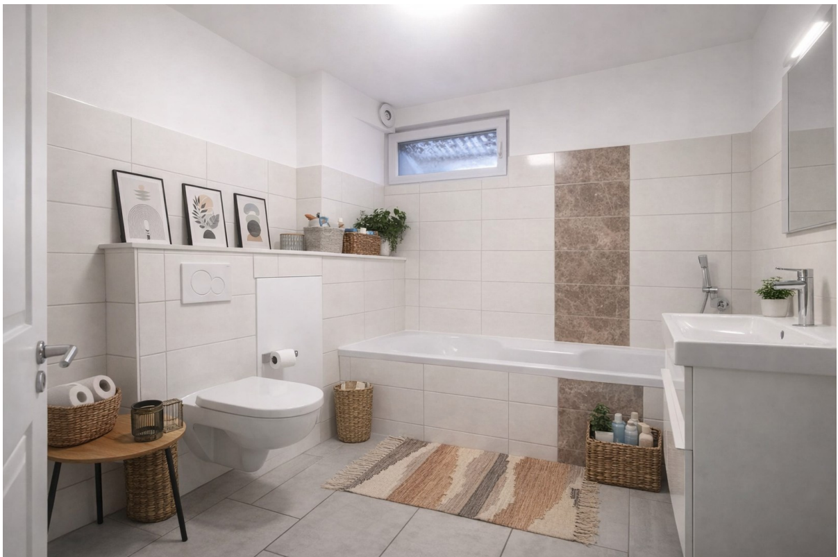
Vollbad m. Wanne Souterrain