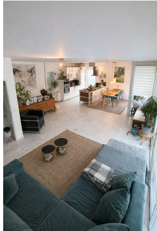
Wohn- & Essbereich + Küche