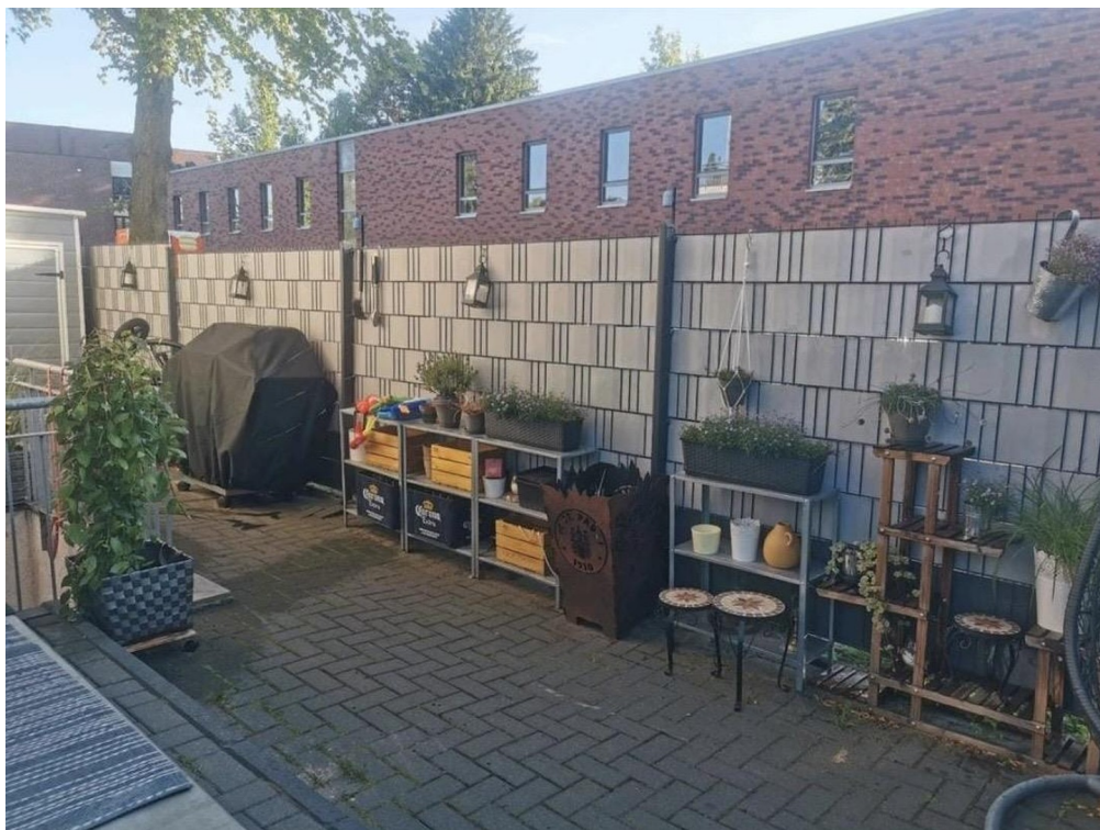
Gartenhaus + Grillecke