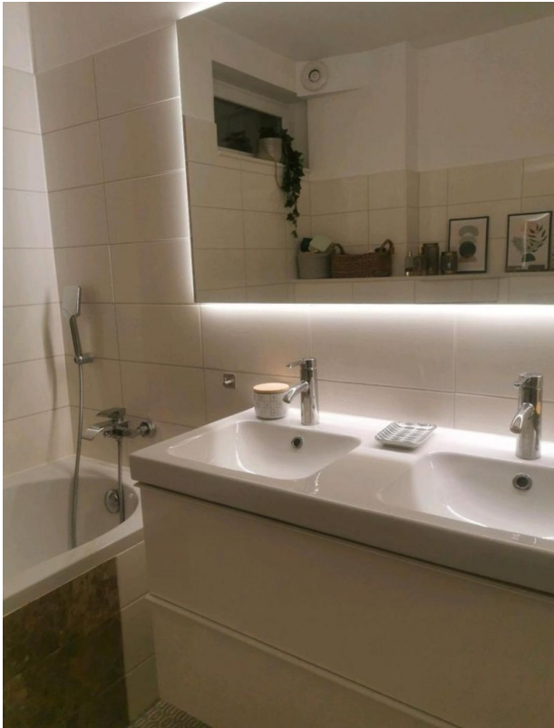
Vollbad mit dopp. Waschbecken