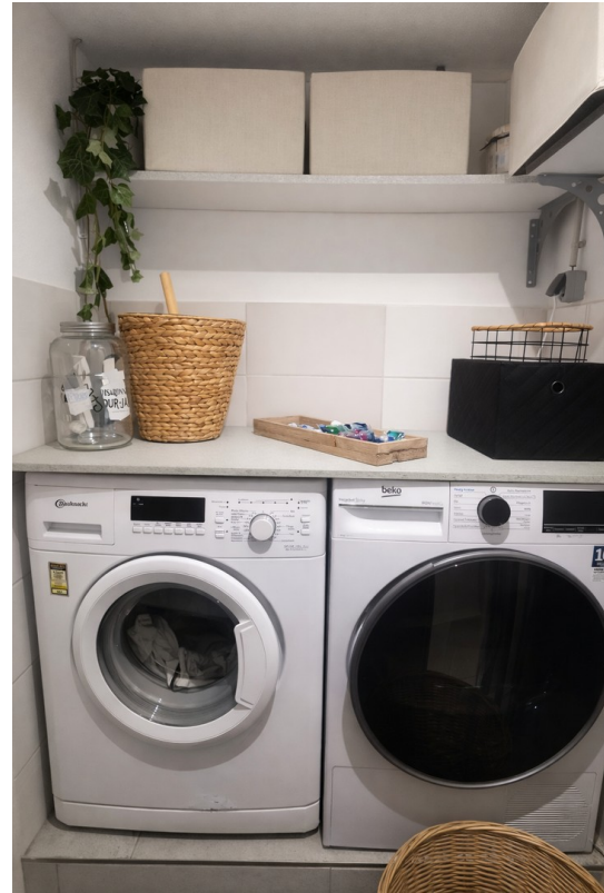
Raum f. Waschmaschine+Trockner