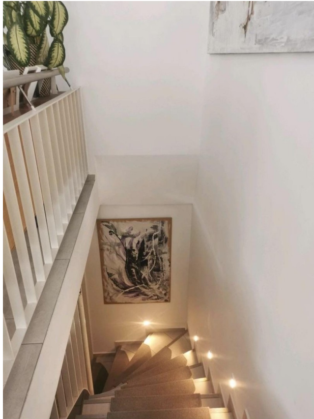
Treppe ins Souterrain