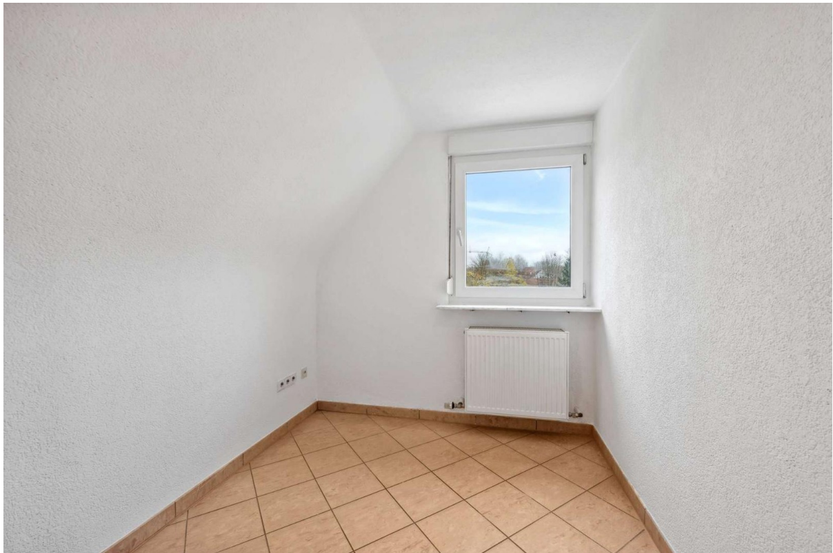
Schlaf- / Kinderzimmer