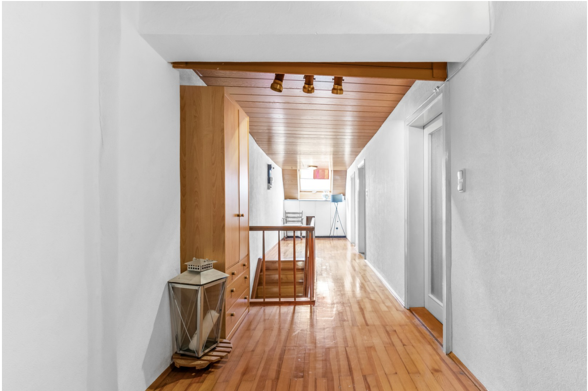
Flur 1. OG