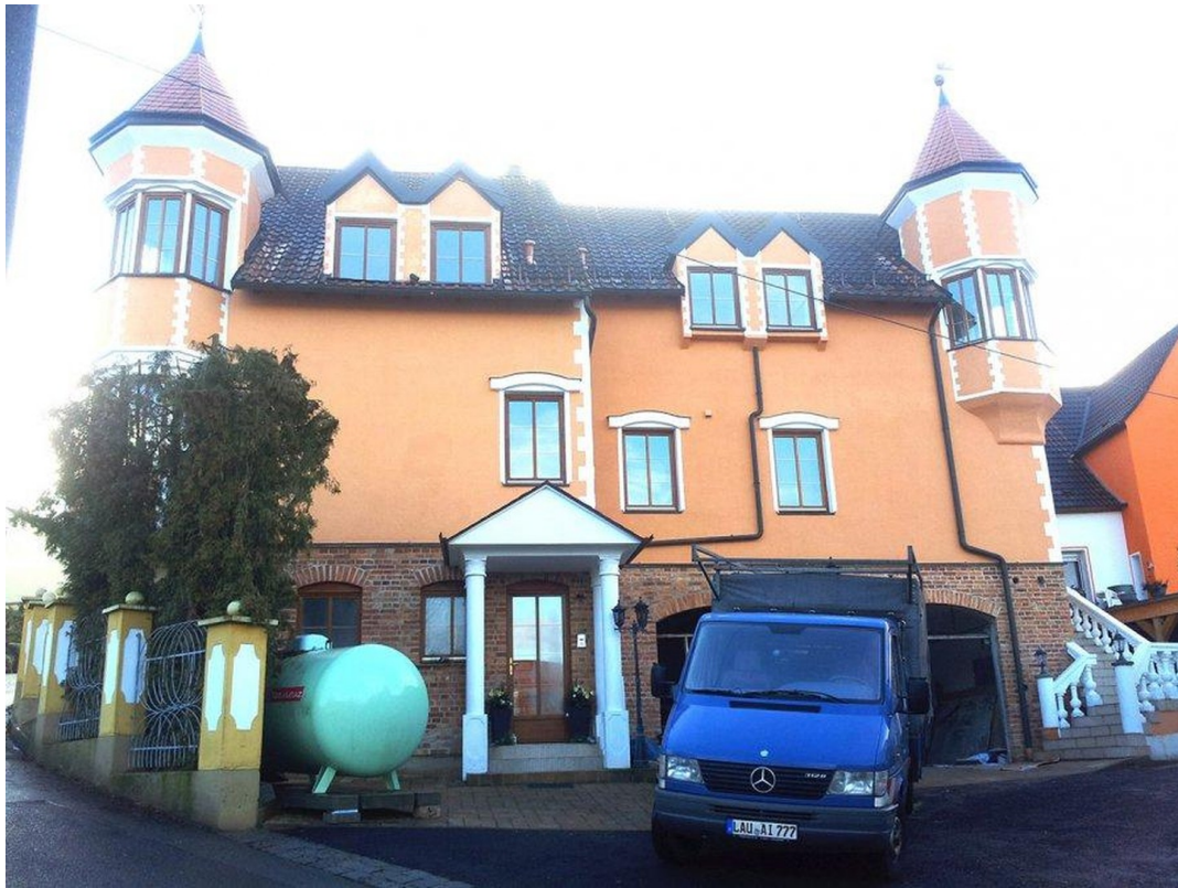
Ansicht Front Nord