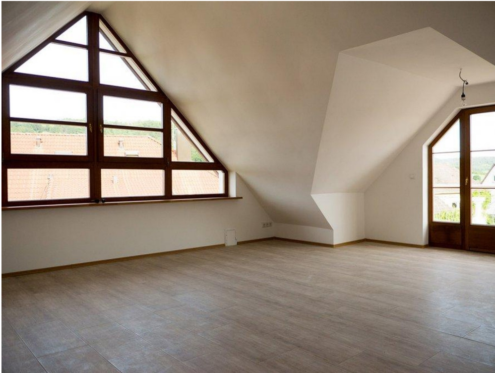
DG Studio 2