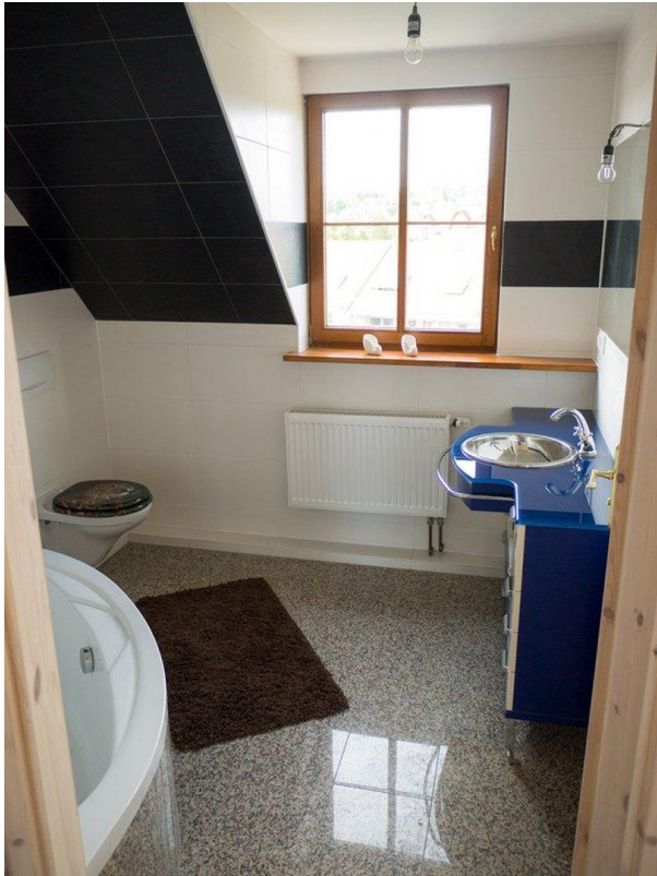
OG Bad 1