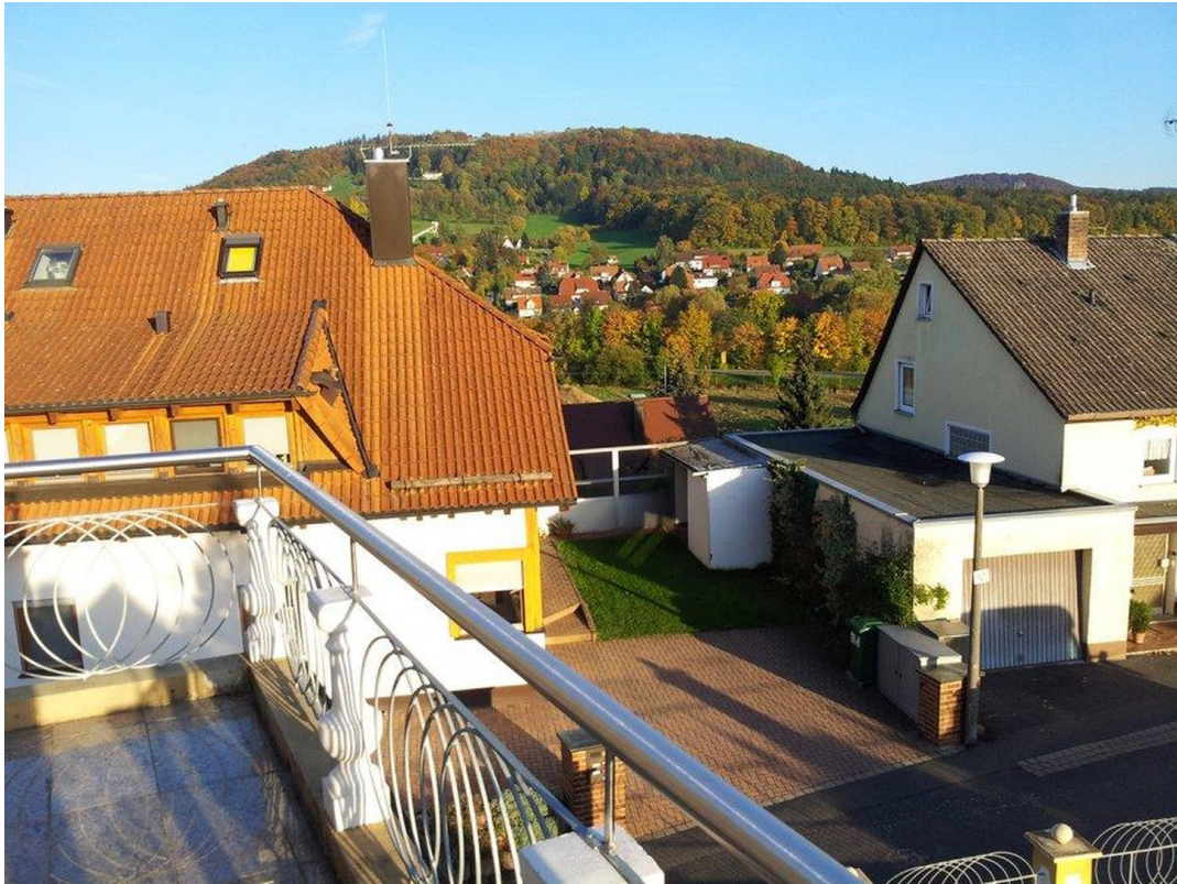
DG Südbalkon Aussicht