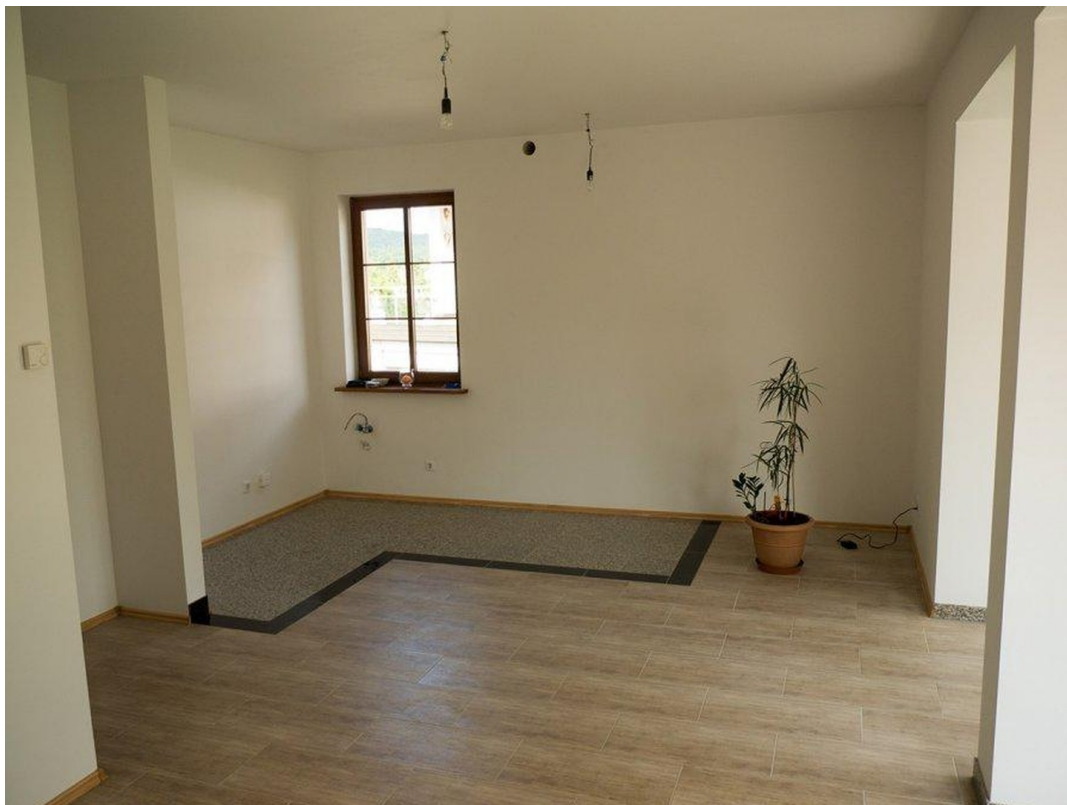
EG offene Küche