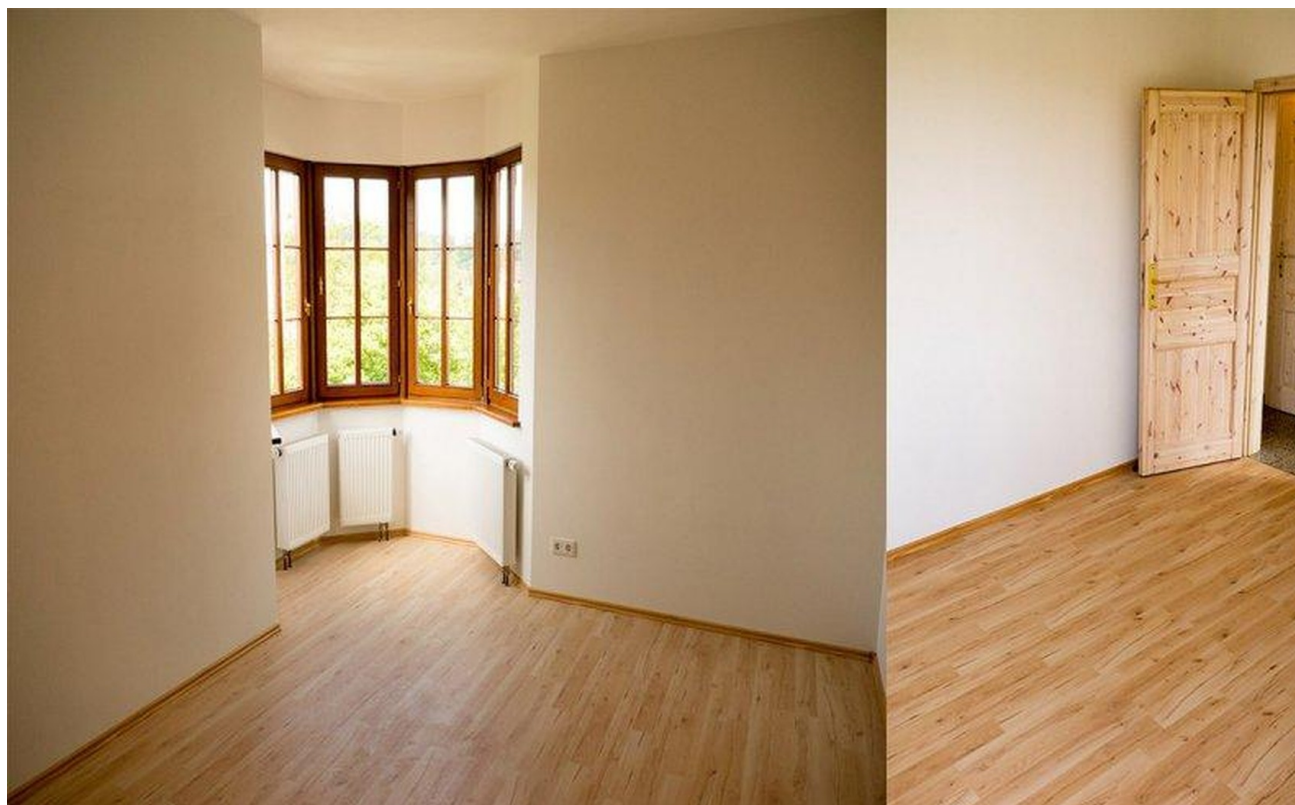
EG Schlafzimmer 2