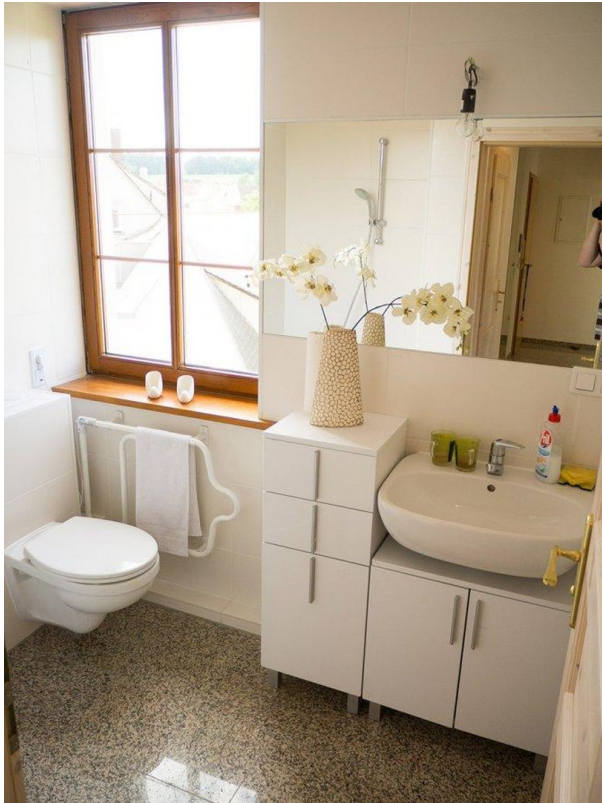
EG Bad 1