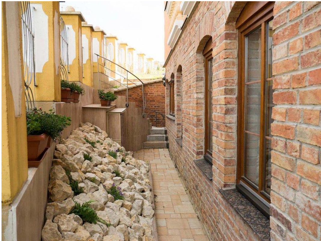
UG Eingang West