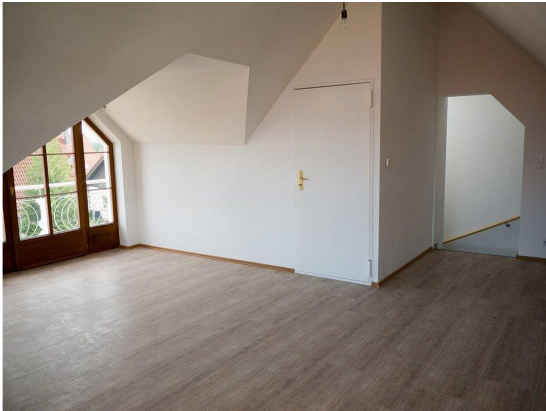
DG Studio 1