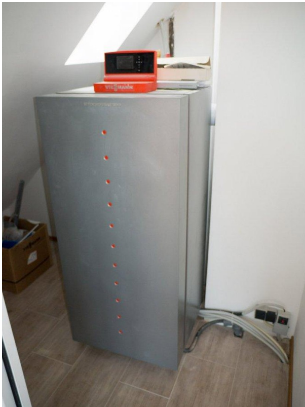
Heizung Vitocrossal 300