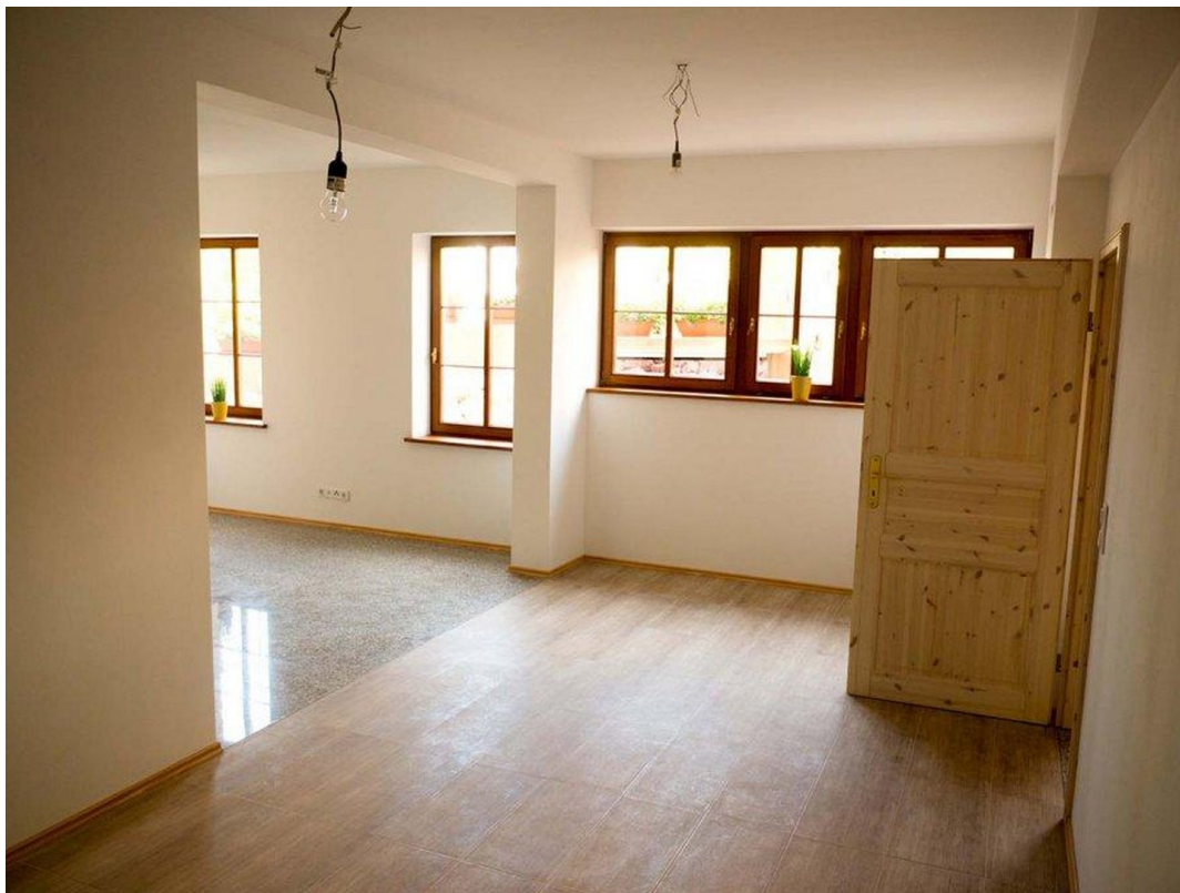
UG Wohnzimmer 1