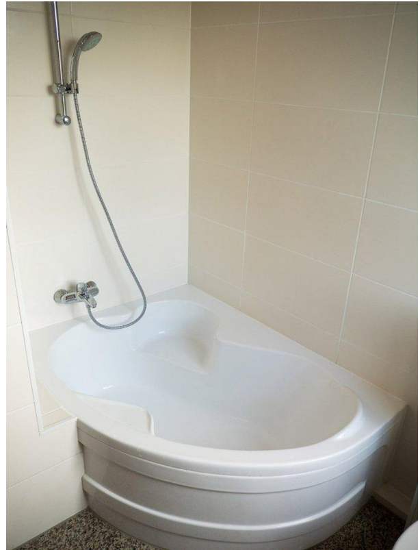
EG Bad 2