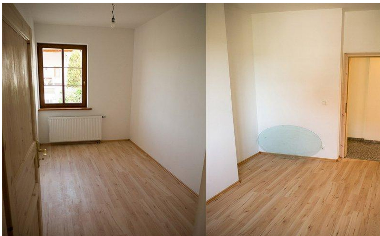
EG Schlafzimmer 1