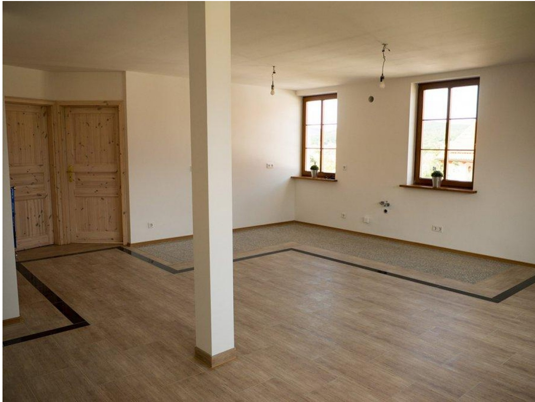
OG offene Küche