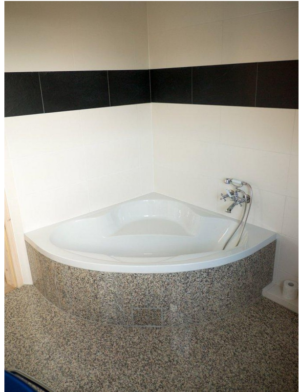
OG Bad 2