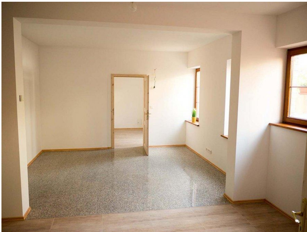
UG Wohnzimmer 2