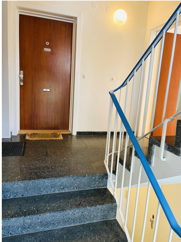
Treppenhaus zur Wohnung