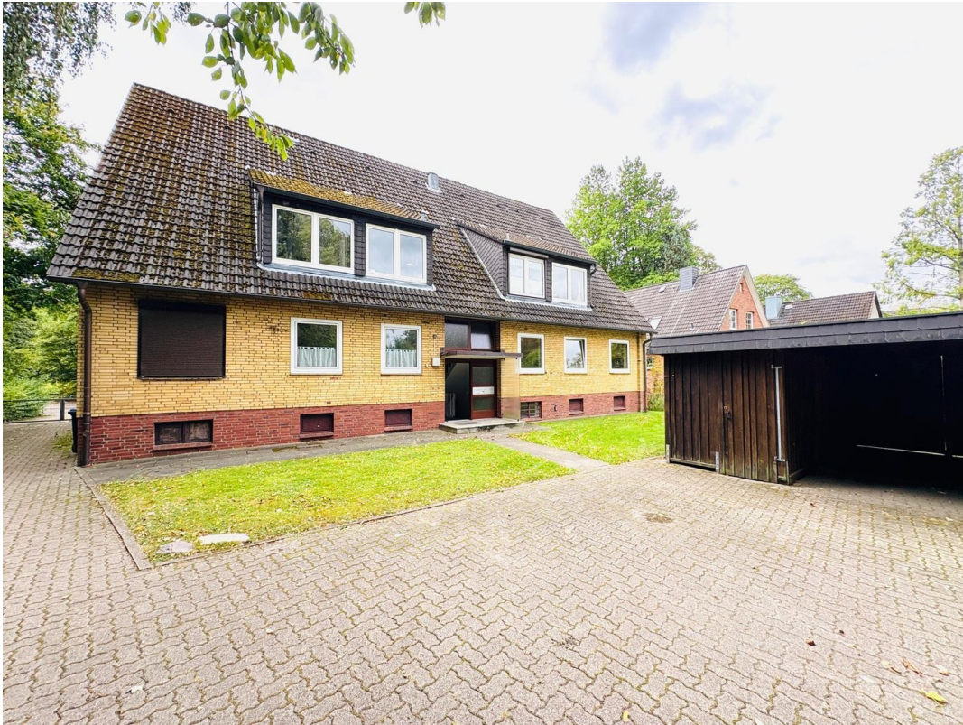
Haus von der Gartenseite