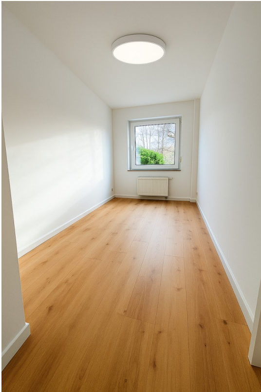
Kinder - Arbeitszimmer