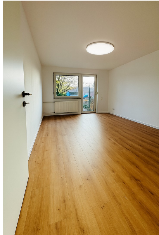
Wohnzimmer mit Terasse