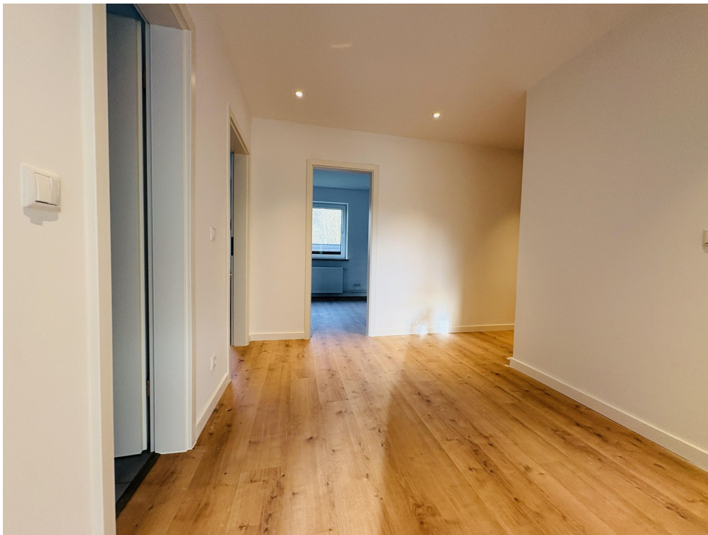
Flur Blick in die Wohnküche