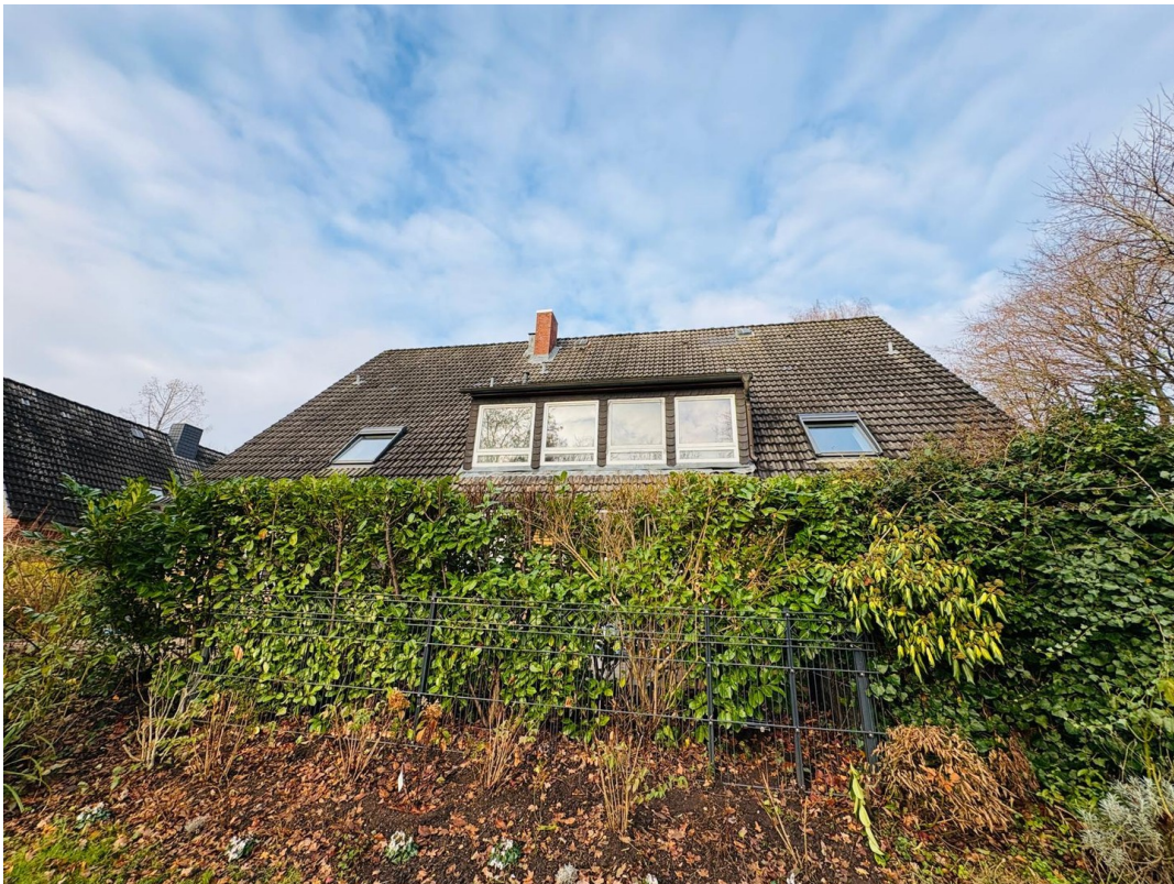
Haus von der Straßenseite