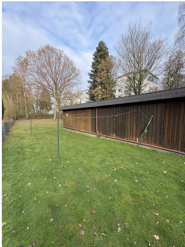
hintere Bereich Garten