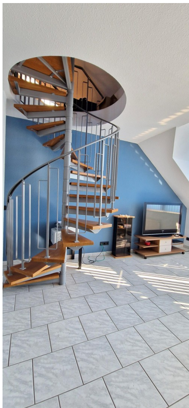
Wohnzimmer und Treppe