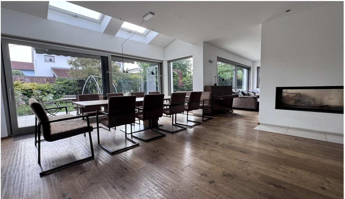
Wohnzimmer Richtung Garten