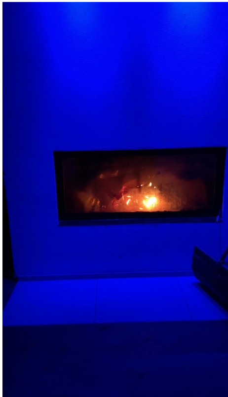
Kamin mit Licht