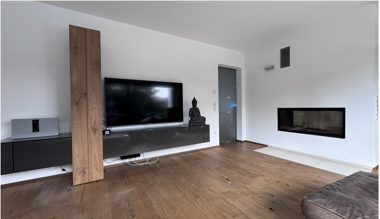
Brunner-Kamin vom Sofa aus