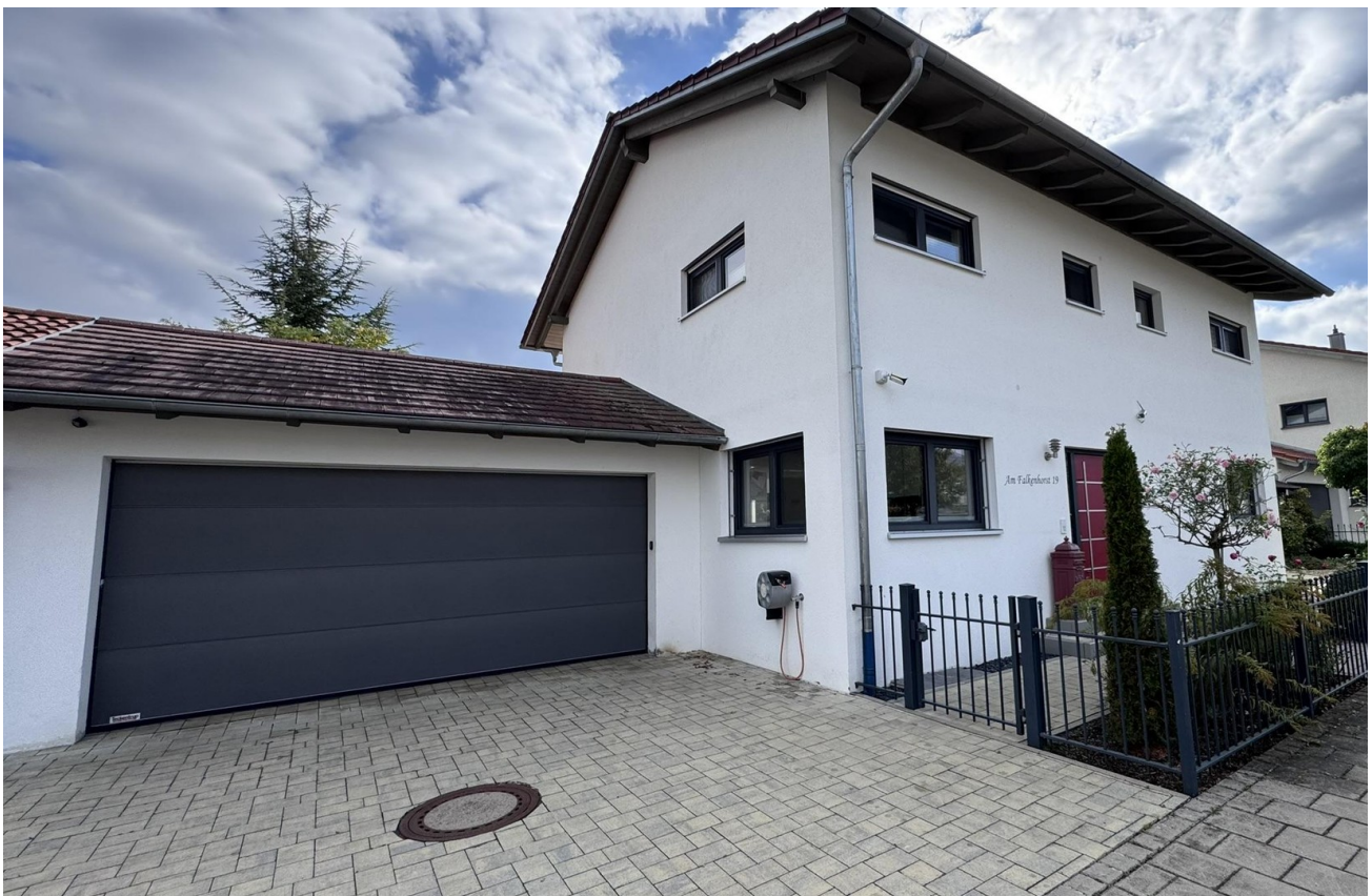
Ansicht von Nord-Osten