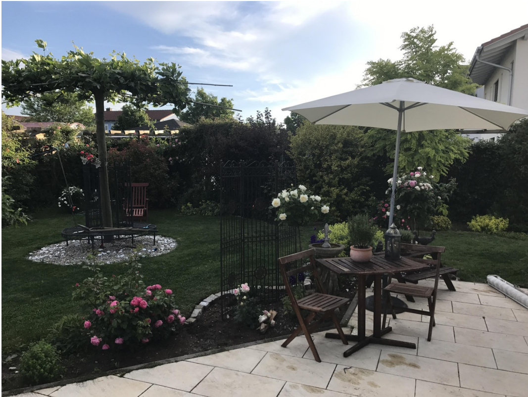
Garten Richtung Westen