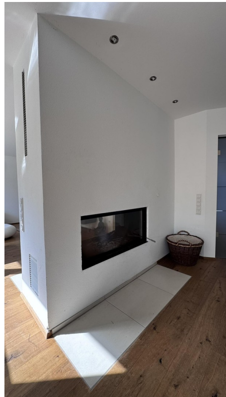
Brunner-Kamin 121 cm