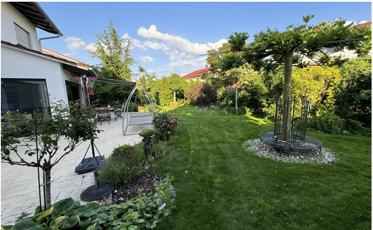
Garten Richtung Osten