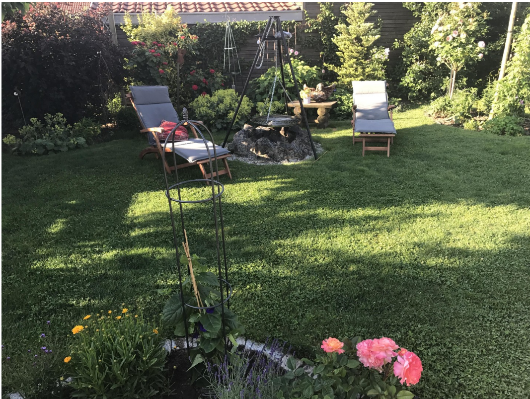
Garten Richtung Süden