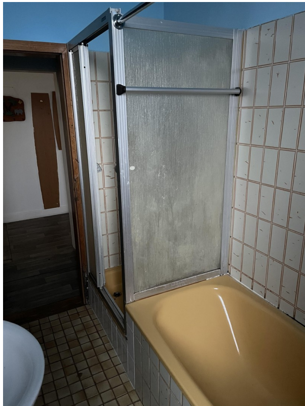
Bad EG (renovierungsbedürftig)