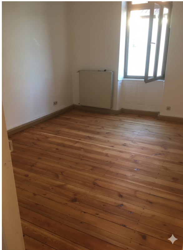
Dielenboden Wohnzimmer n