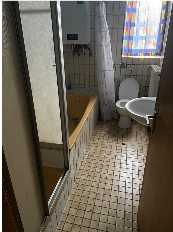
Bad EG (renovierungsbedürftig)