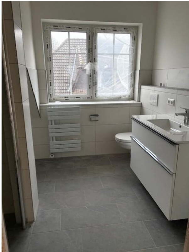
Bad mit Fenster