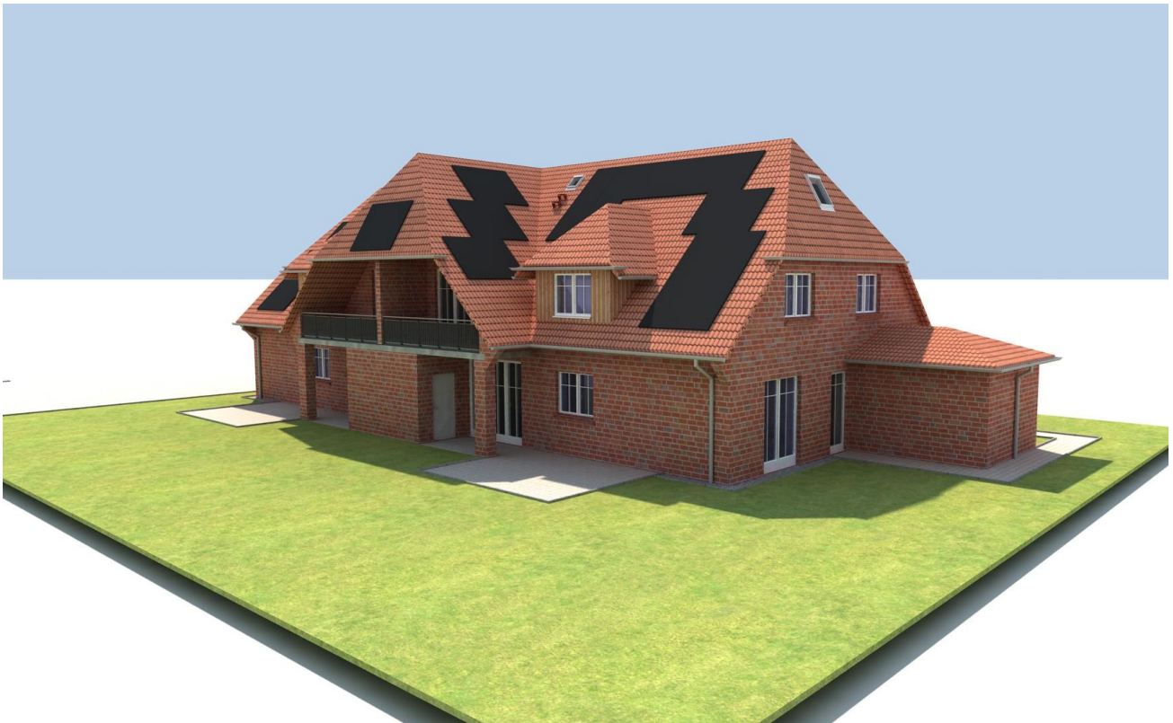
Haus mit Photovoltaik