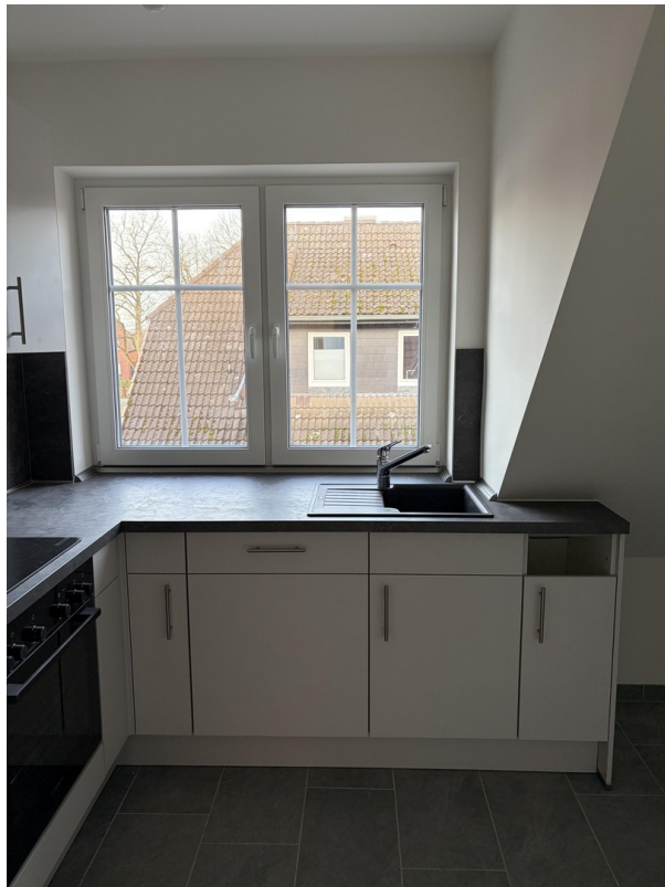
Küche mit Fenster