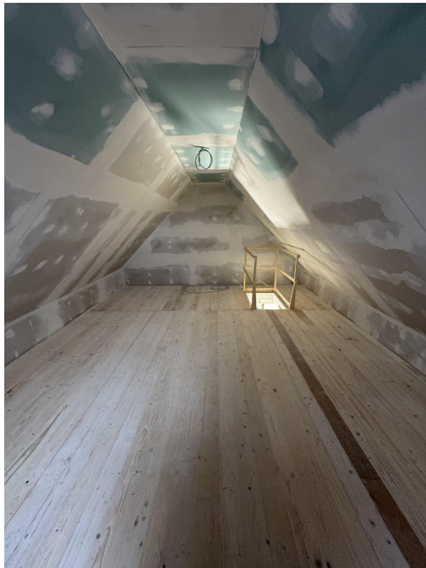
Dachboden nur Nutzfläche