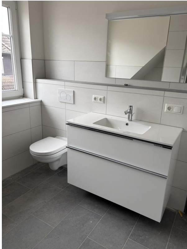
Bad mit Fenster und Spiegel