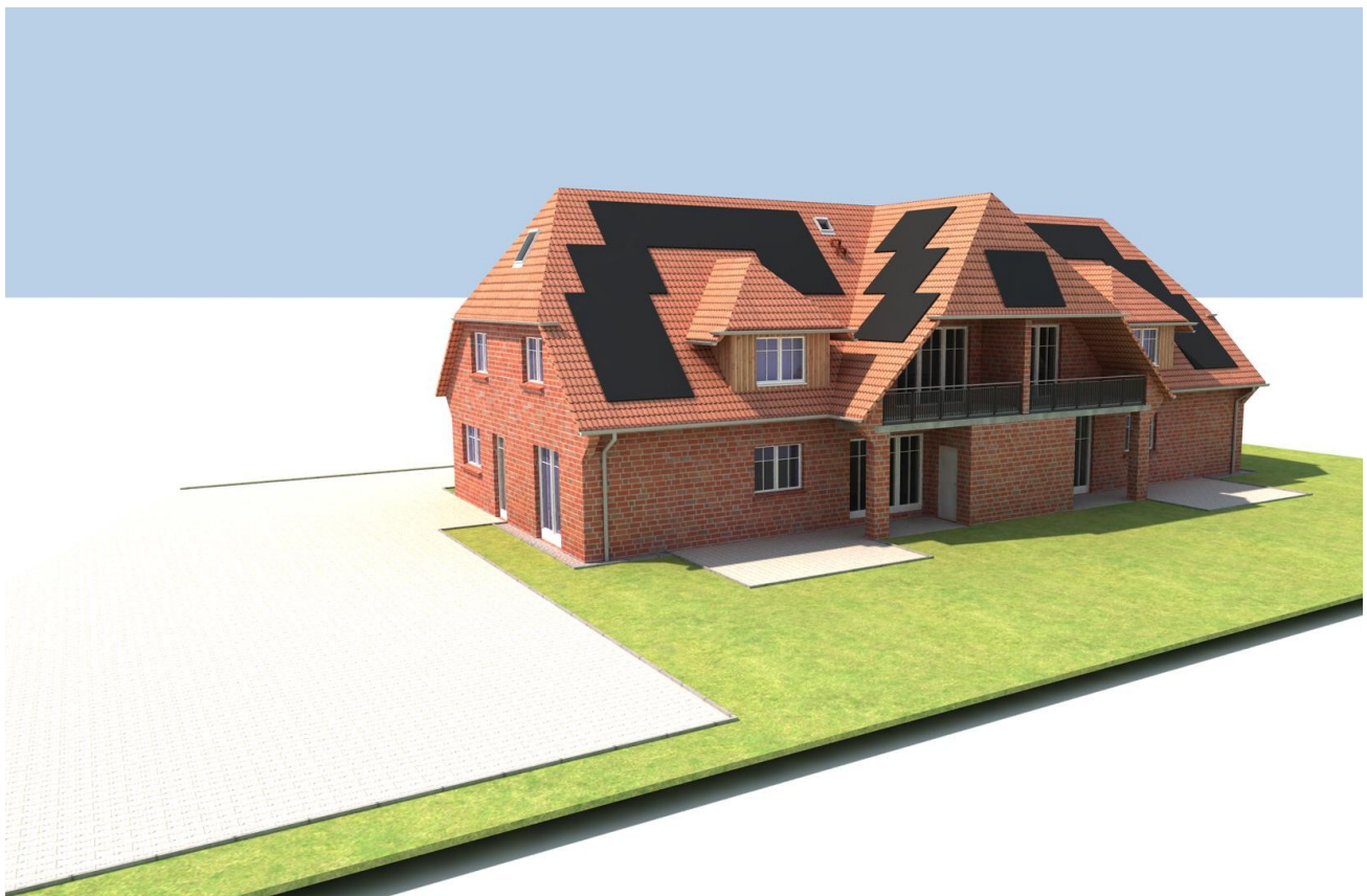
Südseite Balkon/ Terrassen