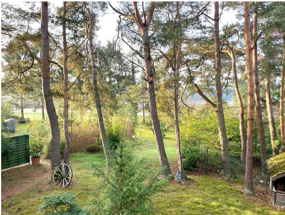
Blick vom Schlafzimmer