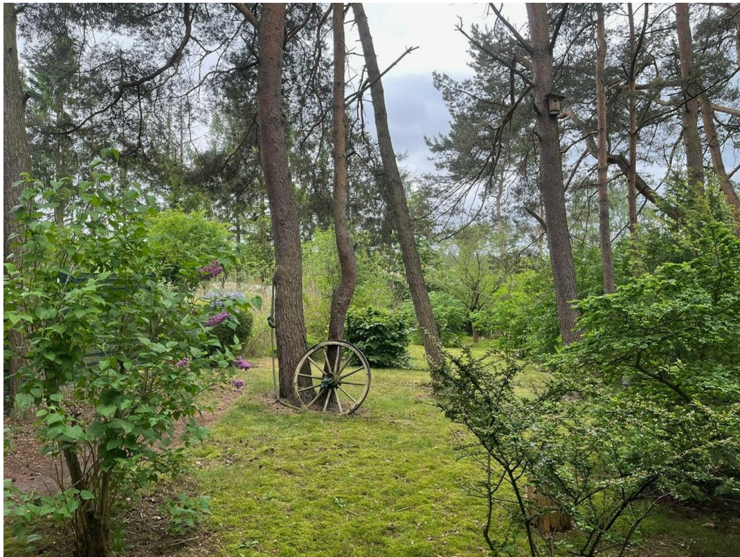
Blick aus dem Wohnzimmer