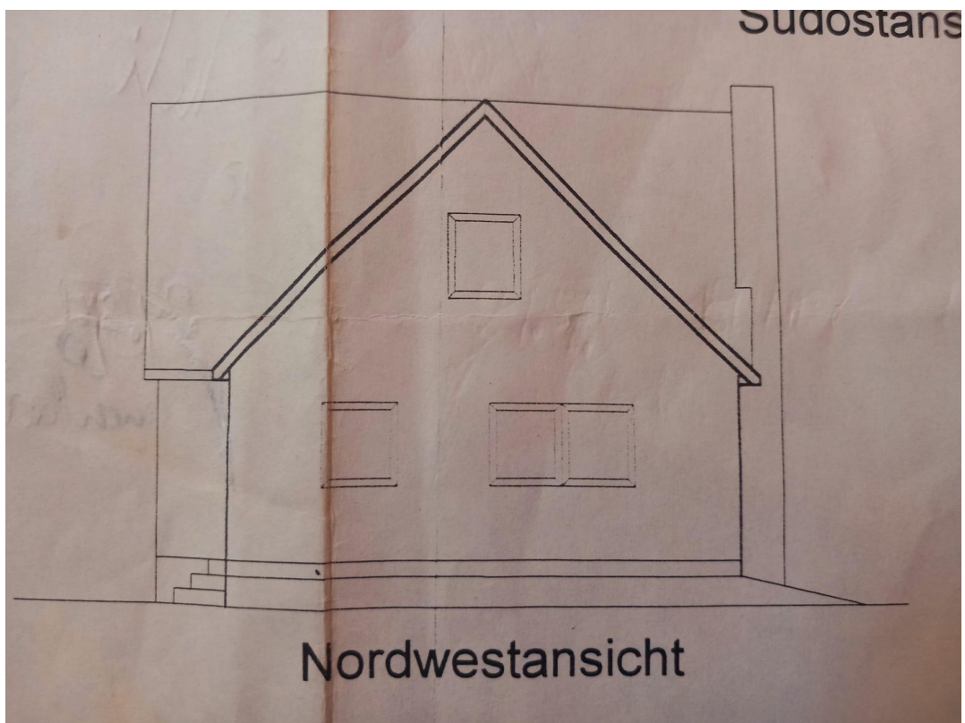
Nord West Ansicht