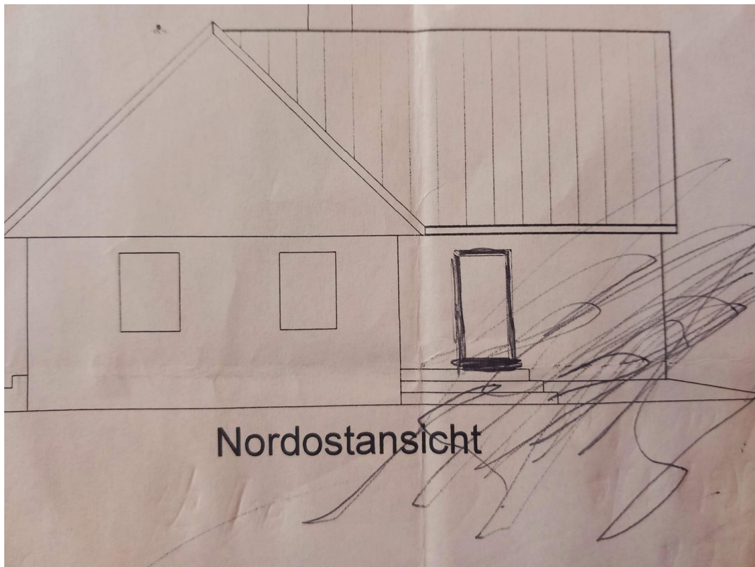
Nord Ost Ansicht