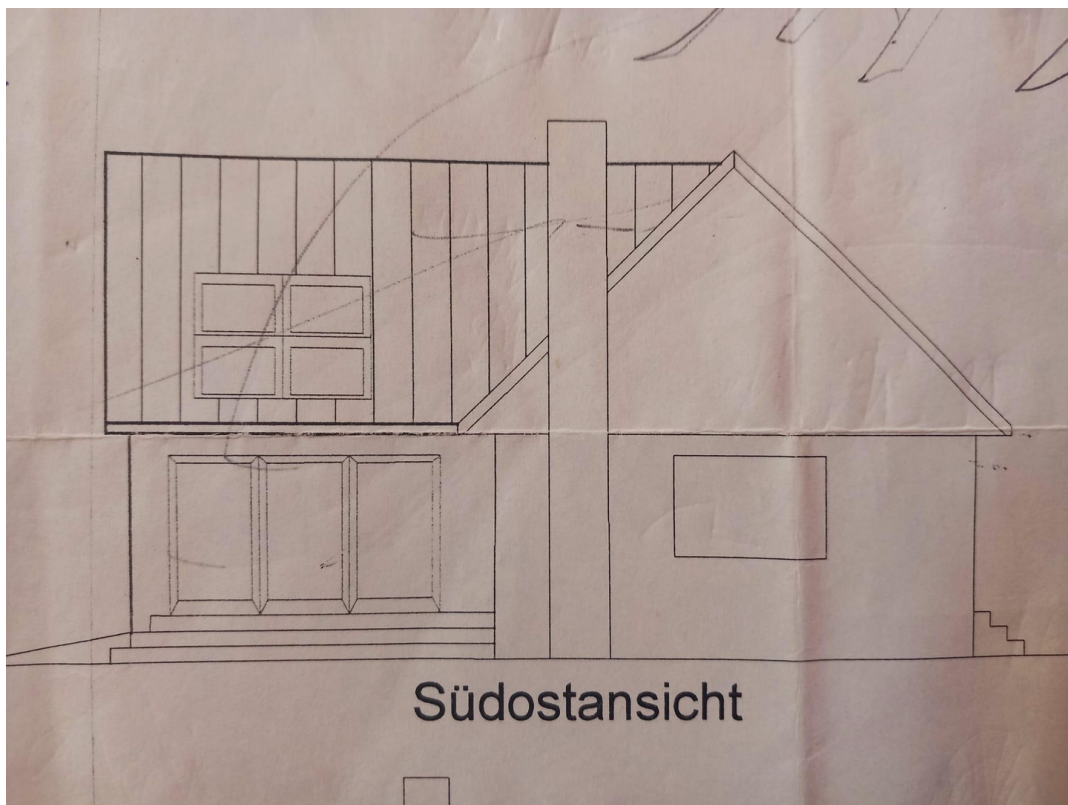
Süd Ost Ansicht