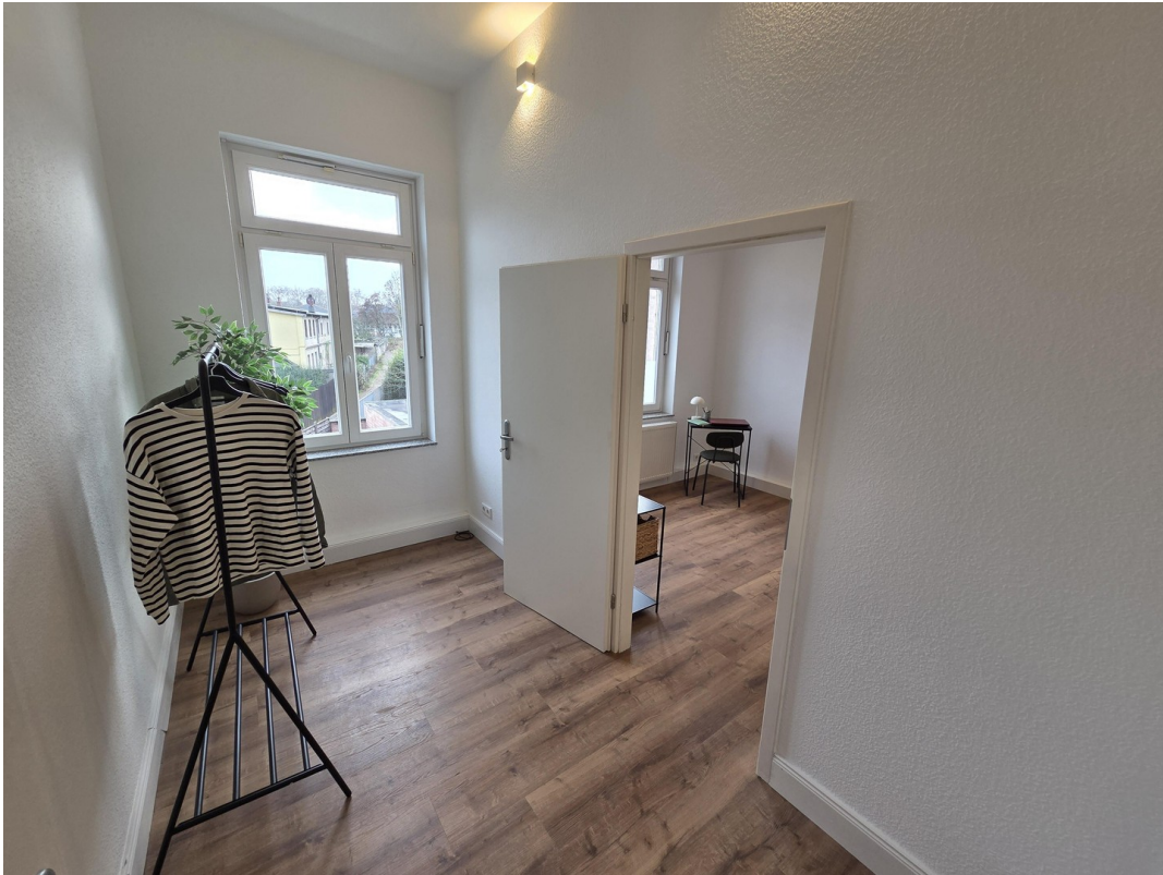
Ankleide / Büro