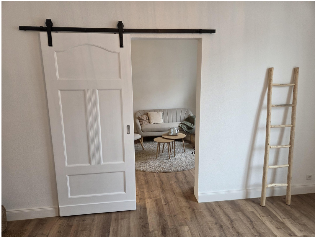
Schiebetür / Schlafzimmer