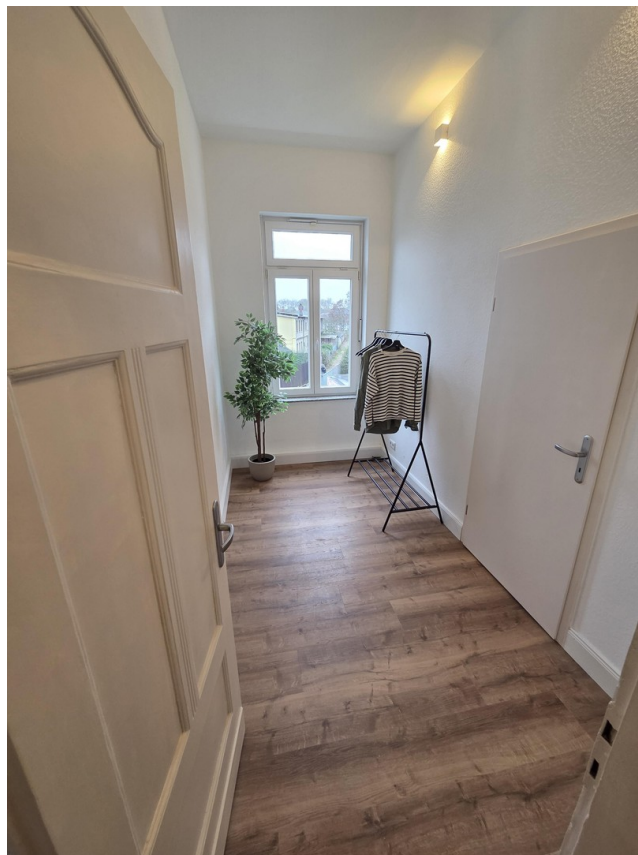
Ankleide / Büro