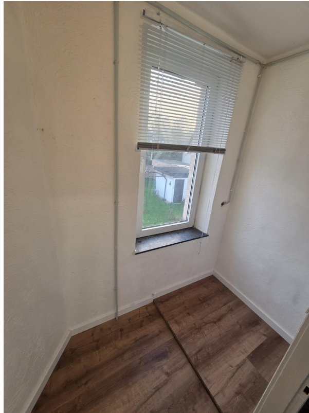
Abstellraum im Treppenhaus