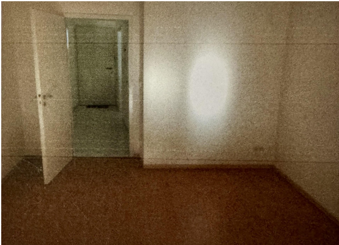
Wohnraum und Eingangsbereich