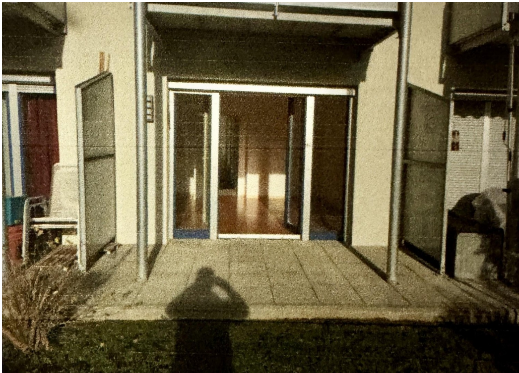
Blick auf Terrasse vom Garten