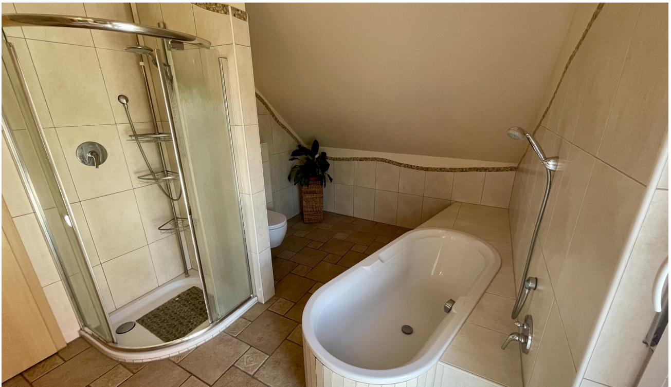
geräumige Dusche und WC-Nische