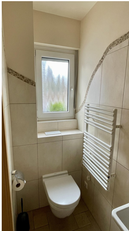
Gäste WC mit Dusche