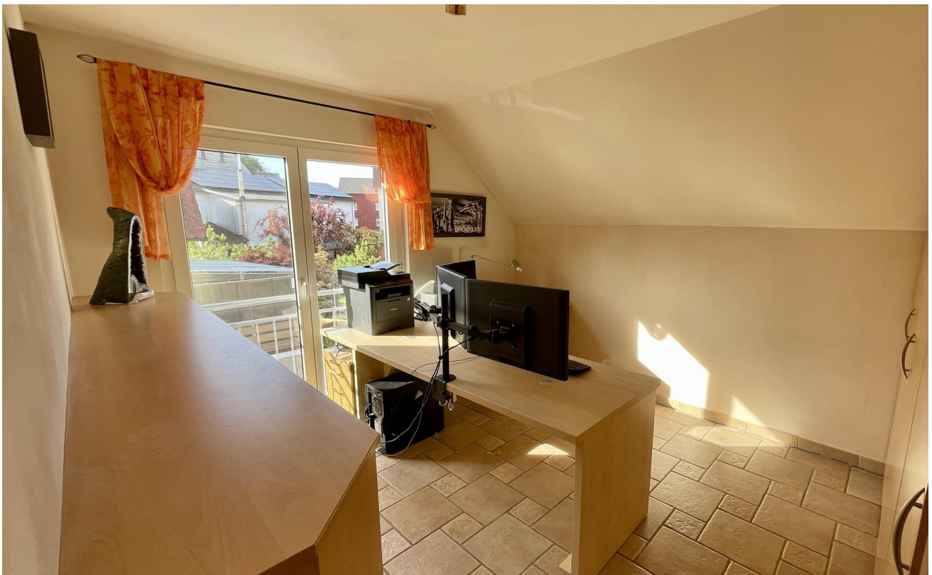
Schlafzimmer 3 / Büro