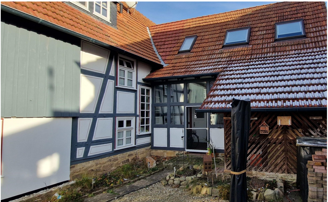
Carport, Schuppen von hinten