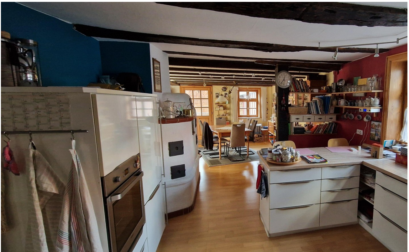
offene Küche, Esszimmer EG