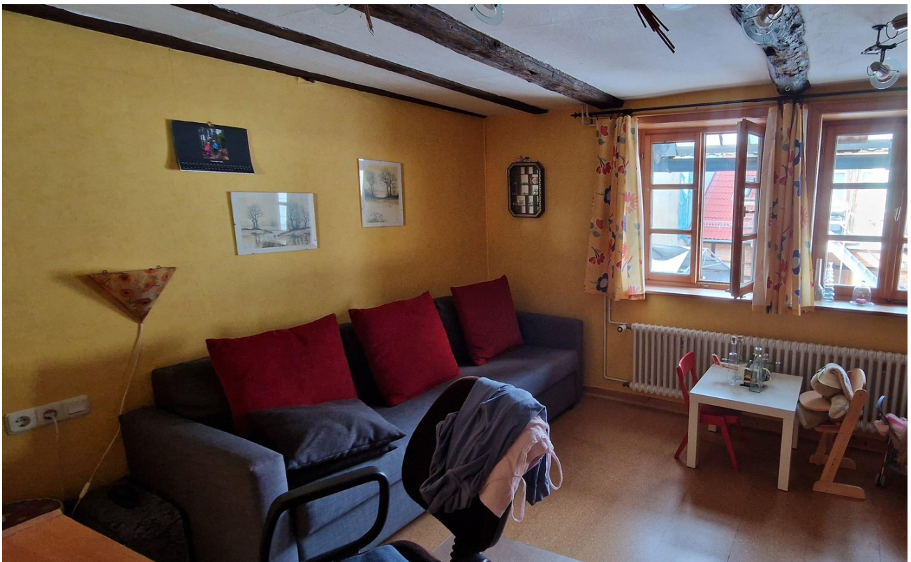
Kinderzimmer 2 OG