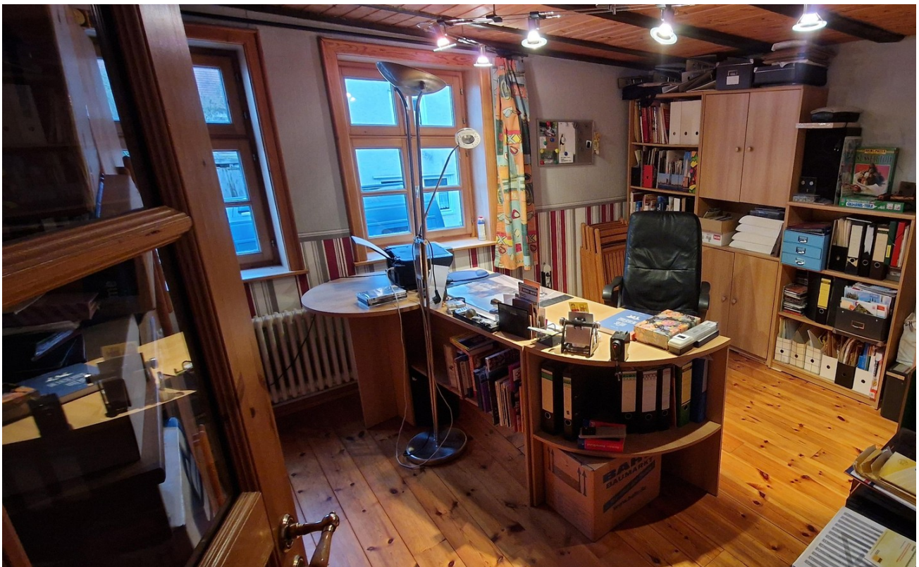
Kinderzimmer (Büro)4 OG