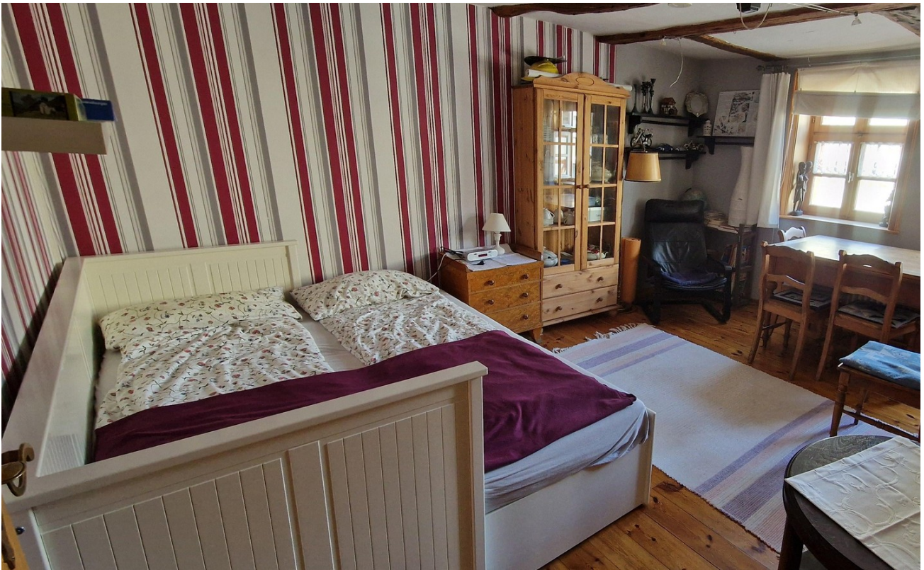
Kinderzimmer 3 OG