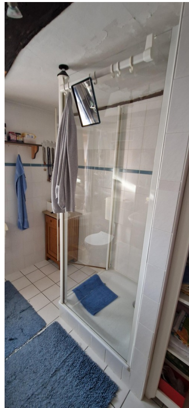
Bad OG, Dusche