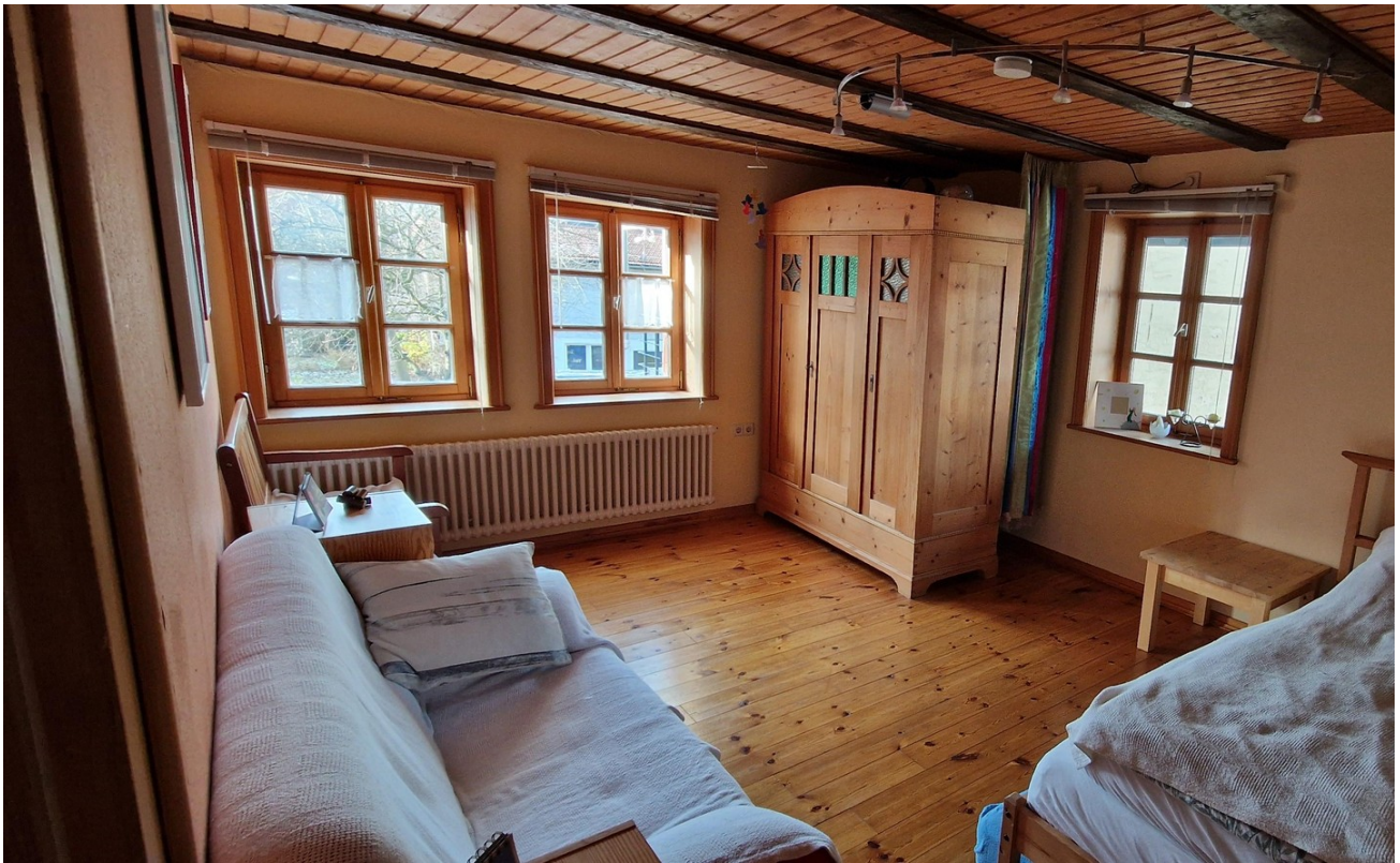
Kinderzimmer 1 OG