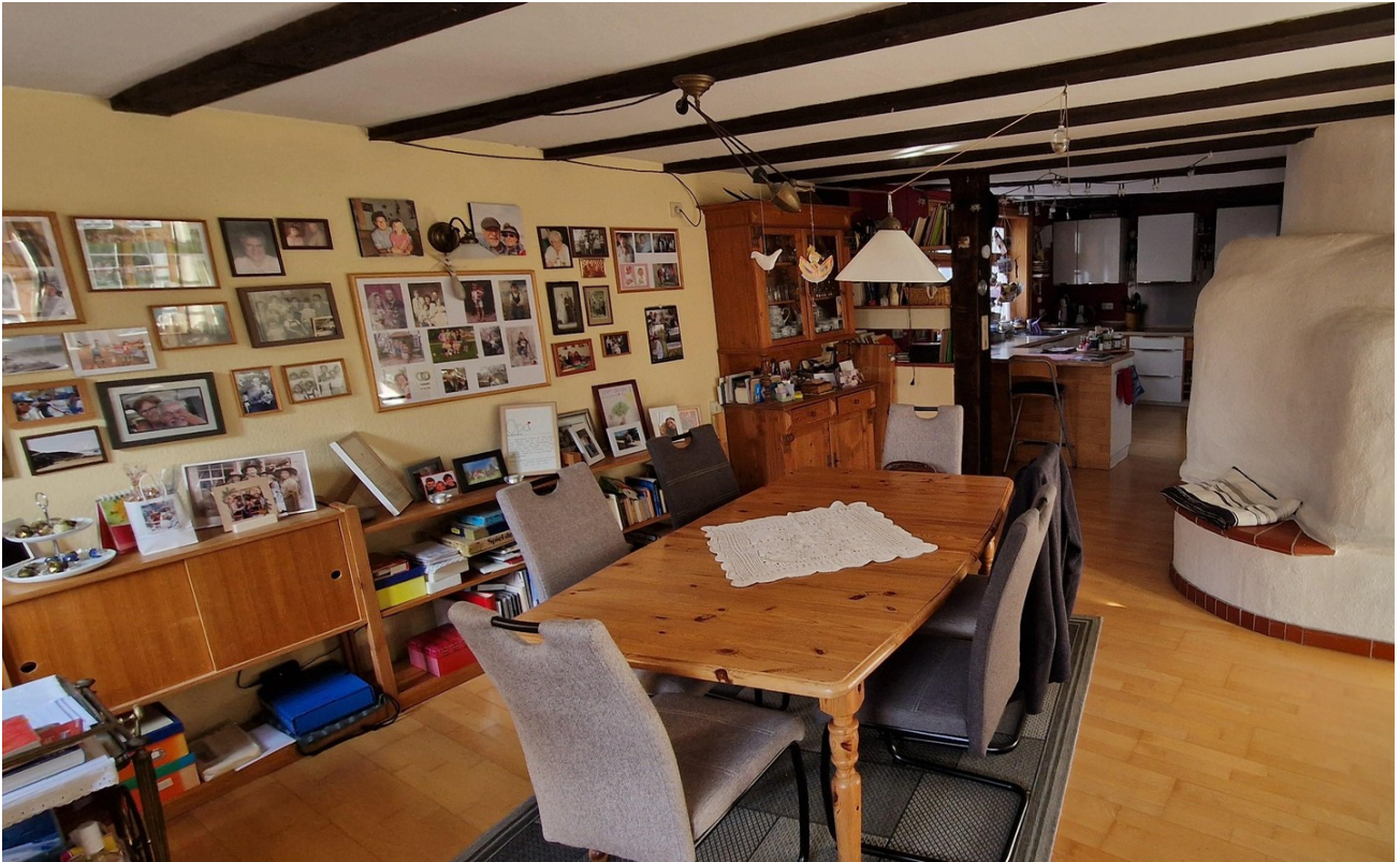
Esszimmer, EG Blick zur Küche