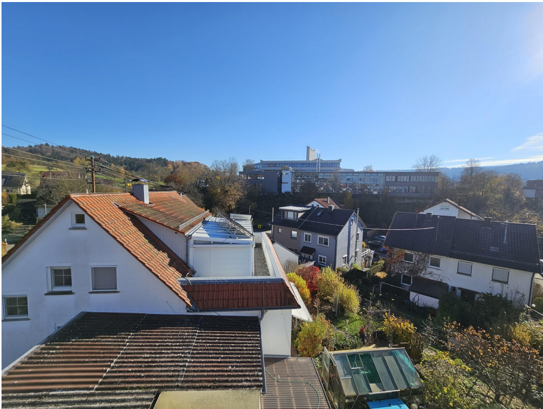
Ausblick Zimmer DG zur Schule