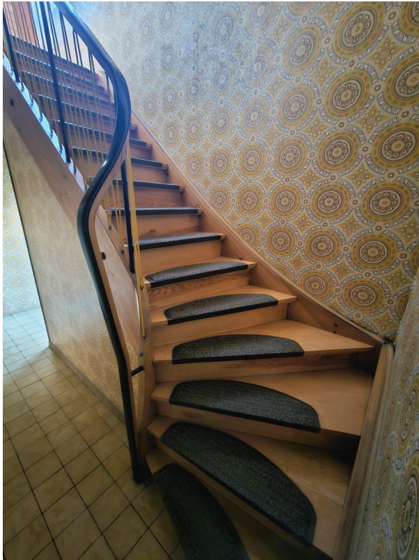
Treppe ins OG