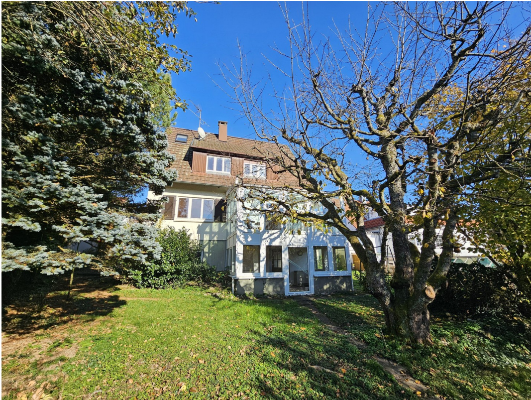
Ansicht aus dem Garten