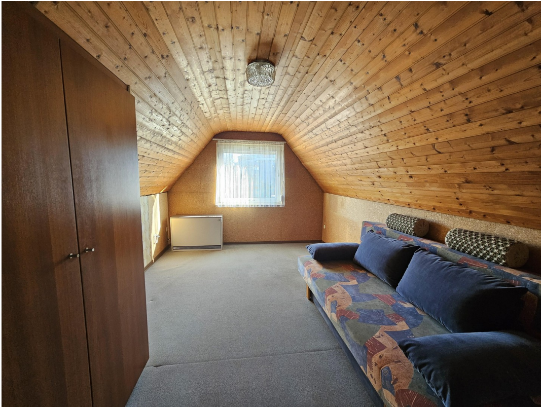
ausgebautes Zimmer DG