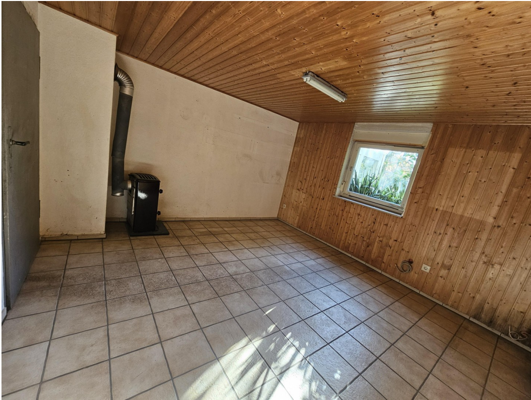
ausgebautes Zimmer UG