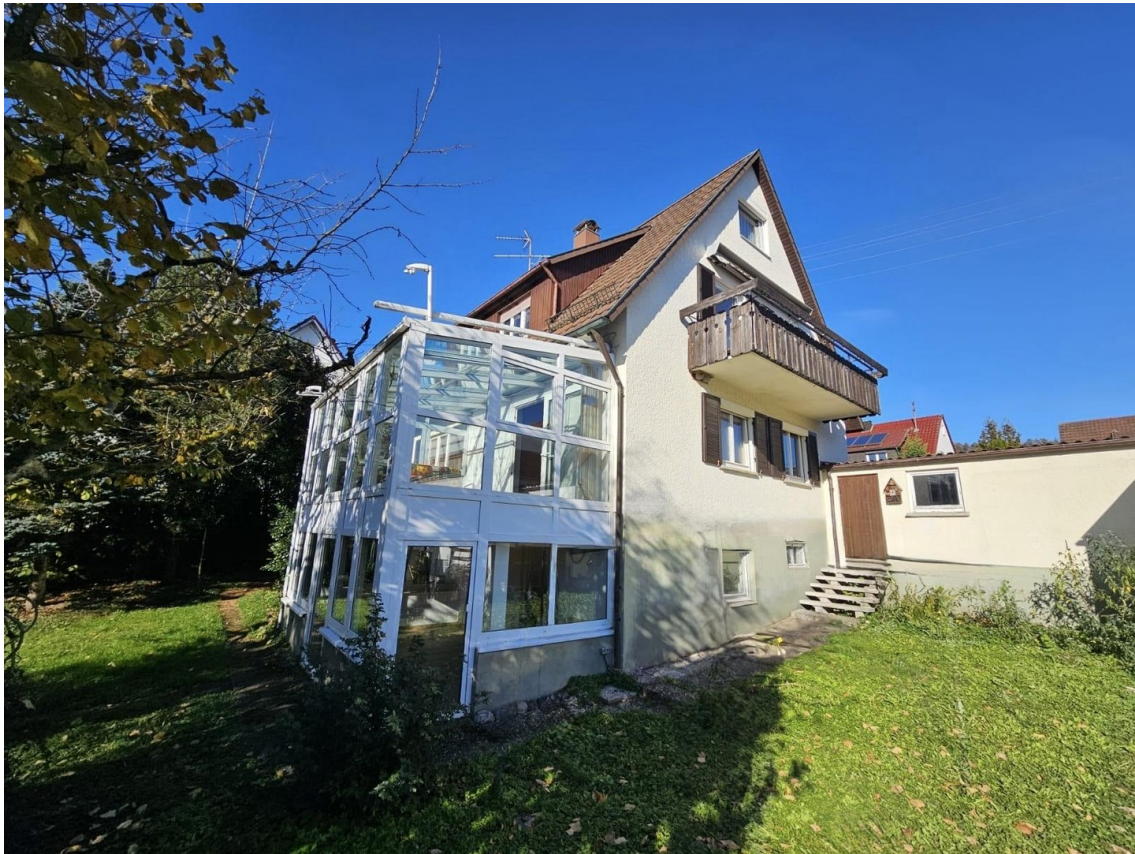
Ansicht ohne Gestelle