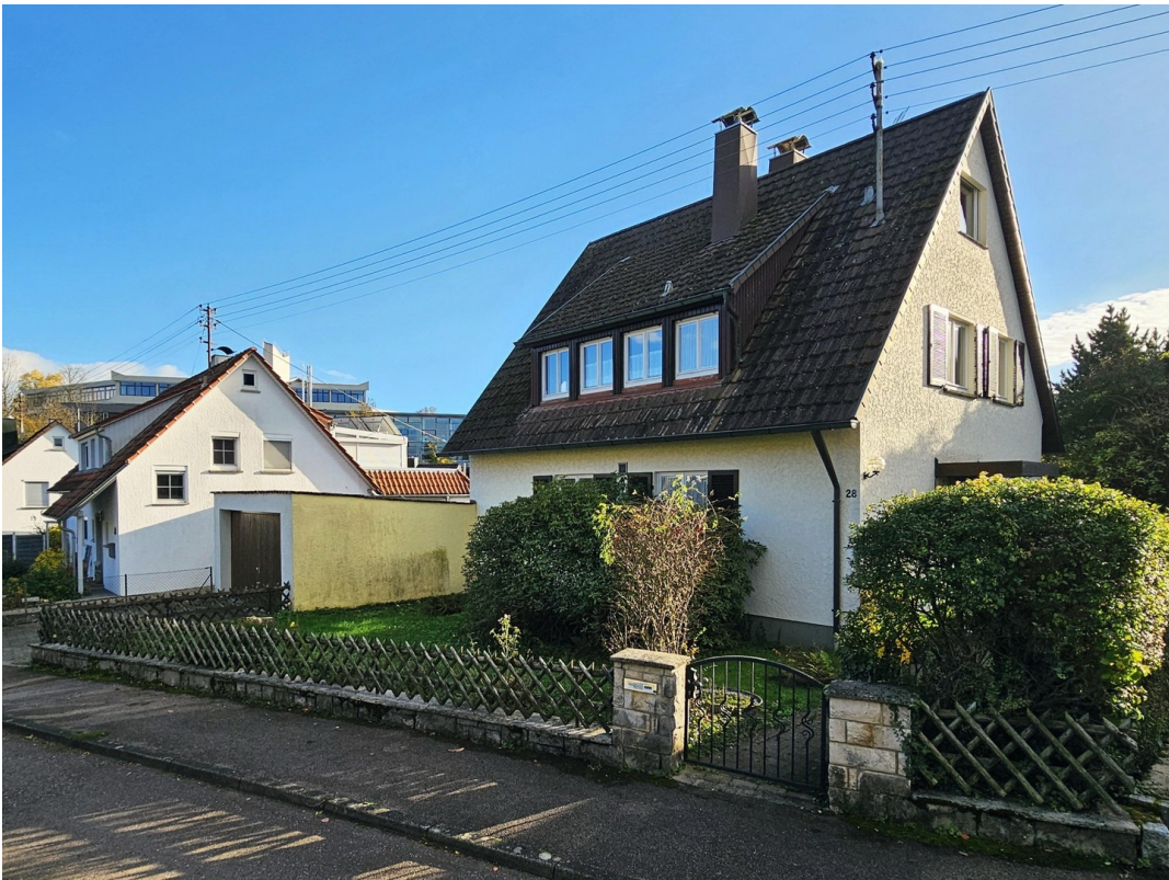
Ansicht mit Vorgarten & Garage