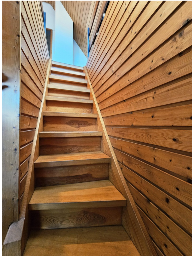
Treppe ins DG