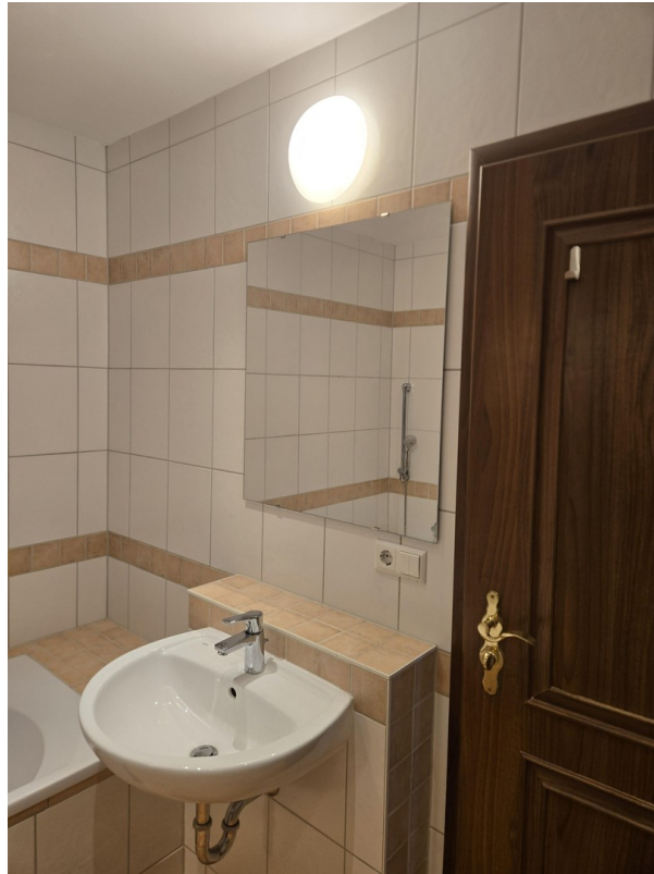
Bad mit Spiegel