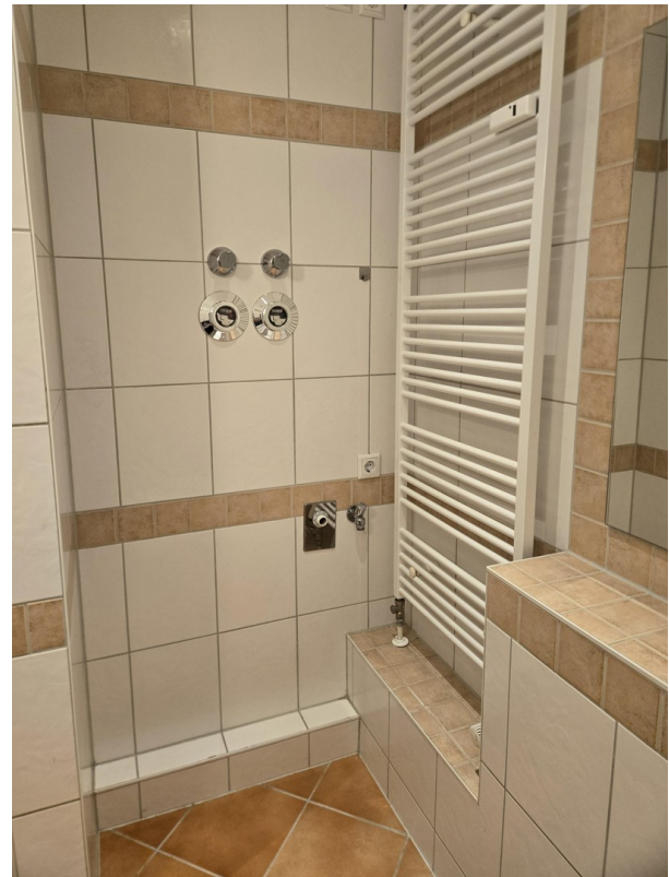
Waschm. Platz m. HHK