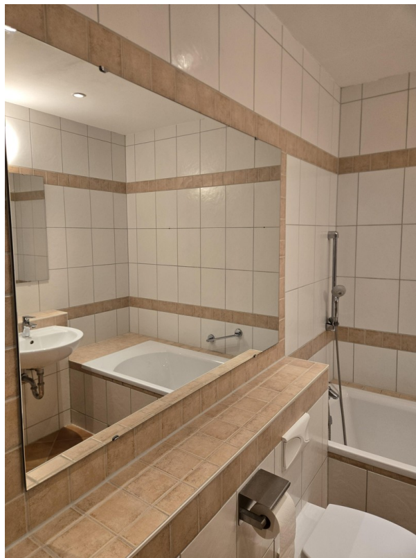
mit großem Spiegel