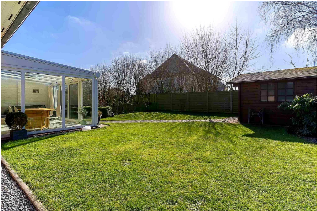
Garten inkl. Gartenhaus