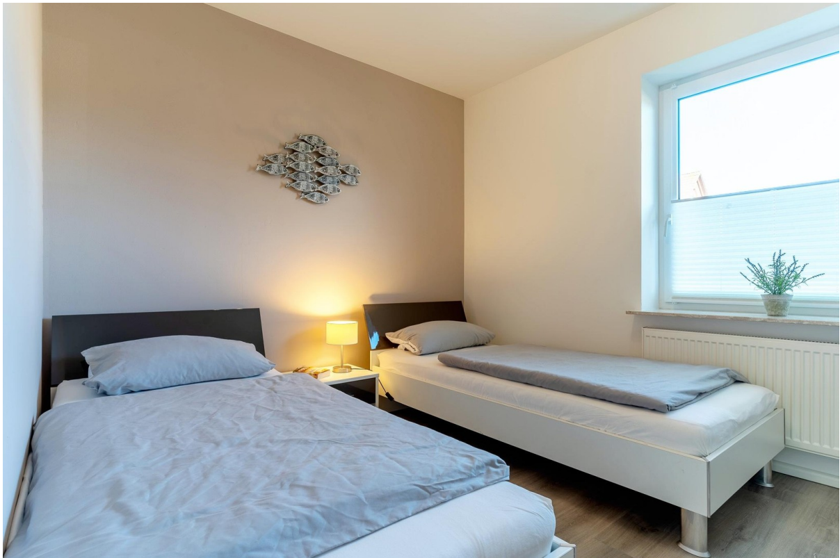
Schlafzimmer № 2 / Büro