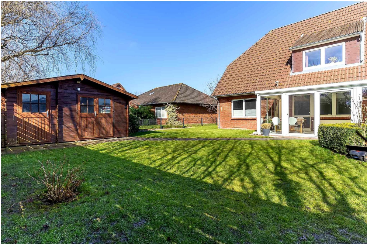
Garten inkl. Gartenhaus