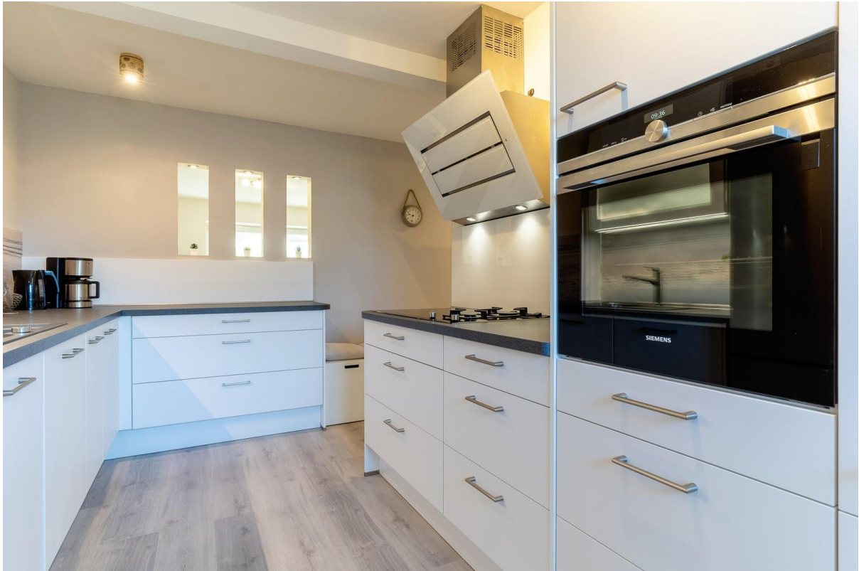
Küche inkl. Gasherd