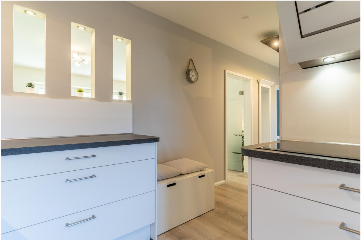
Küche inkl. Gasherd