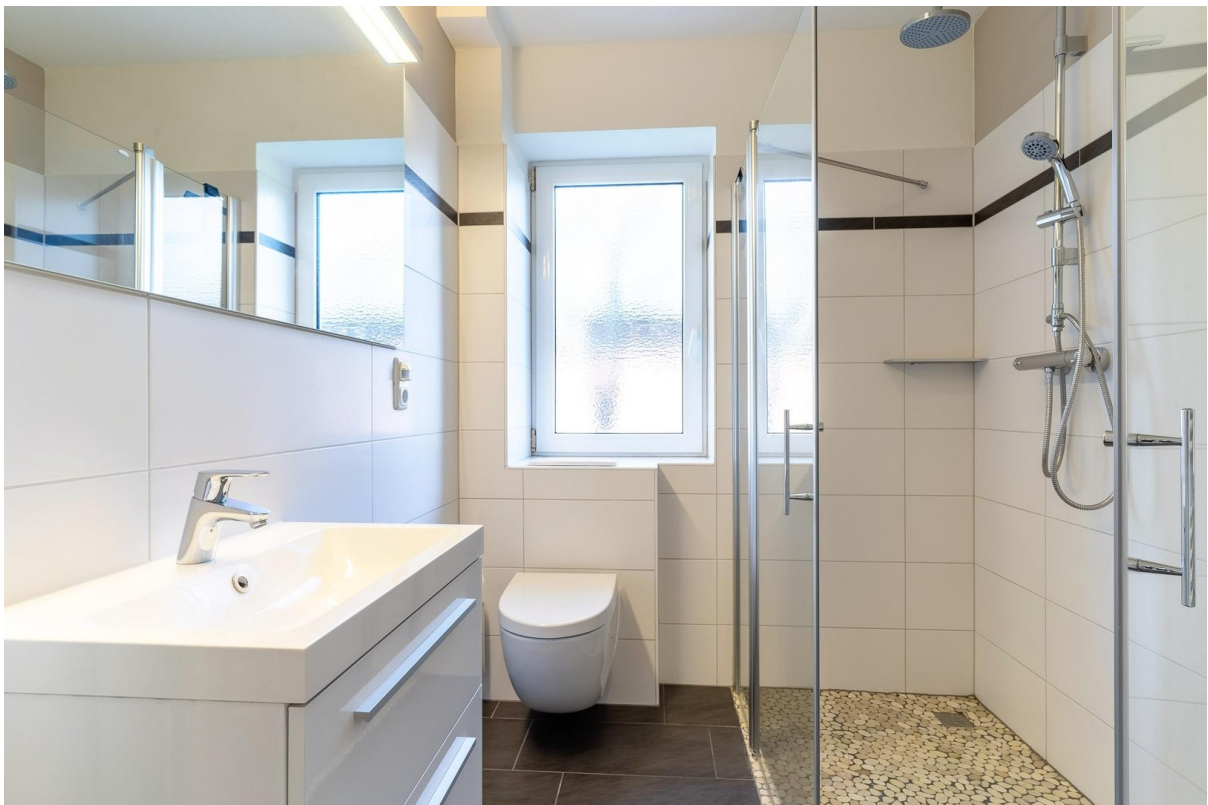
Bad inkl. großer Regendusche