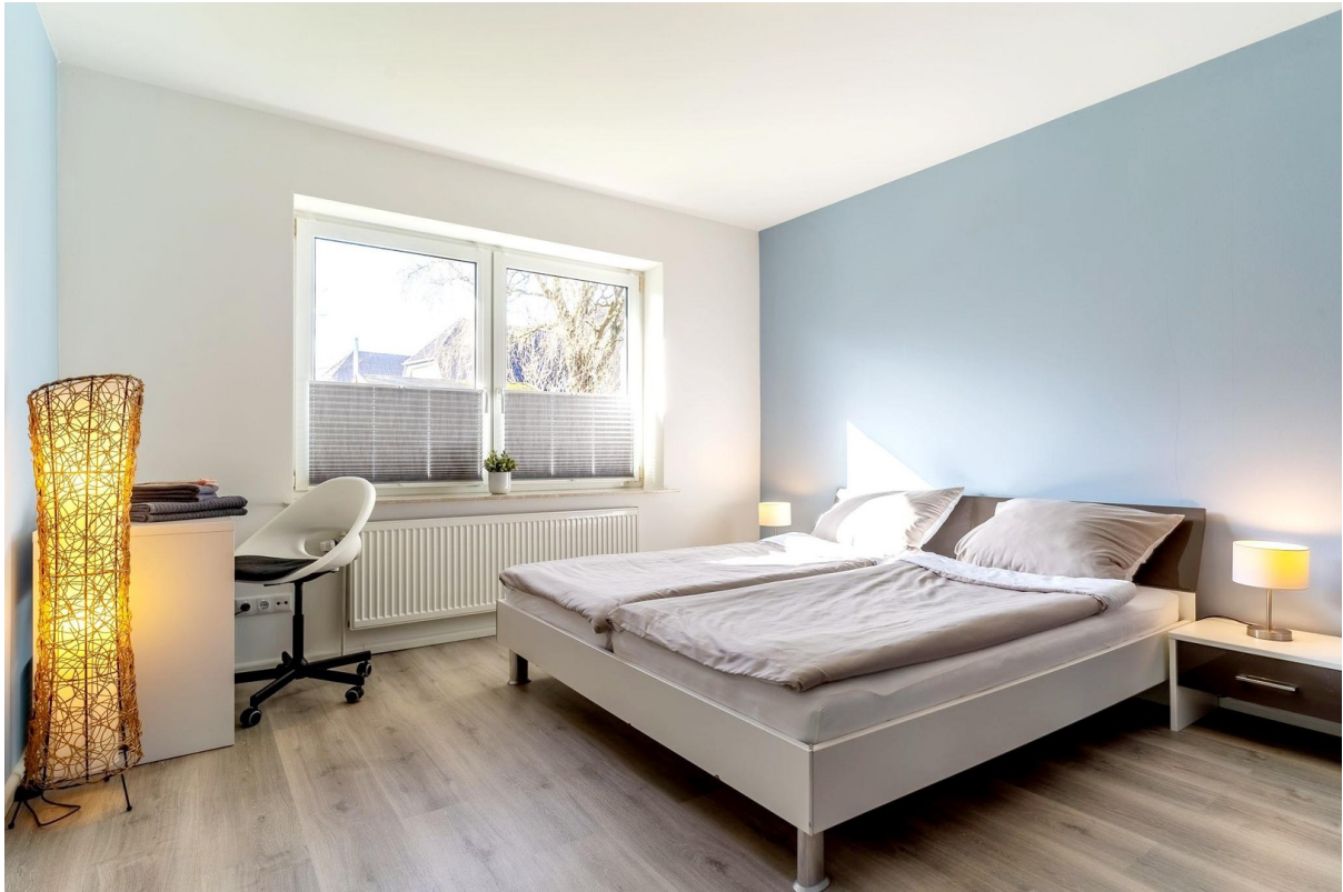
Schlafzimmer № 1