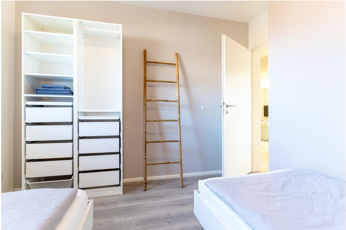
Schlafzimmer № 2 / Büro