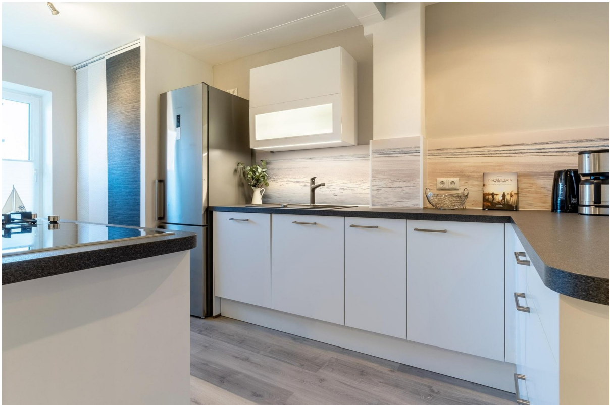
Küche inkl. Gasherd