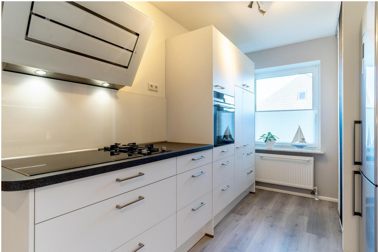
Küche inkl. Gasherd