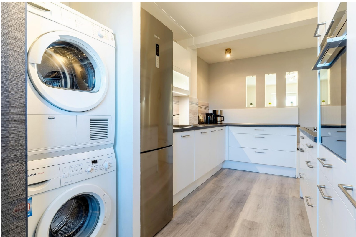
Küche inkl. Gasherd