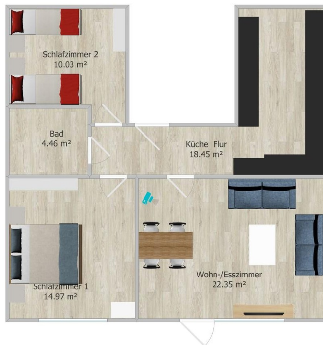
Grundriss (ohne Wintergarten)