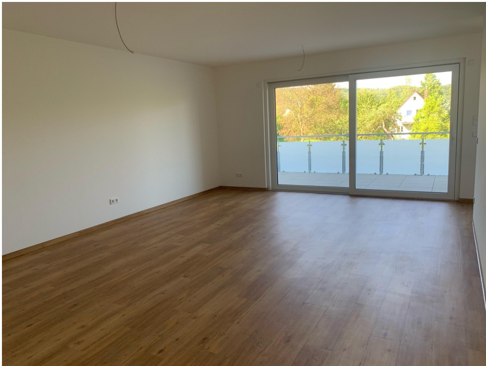
Wohn-Esszimmer mit Balkon