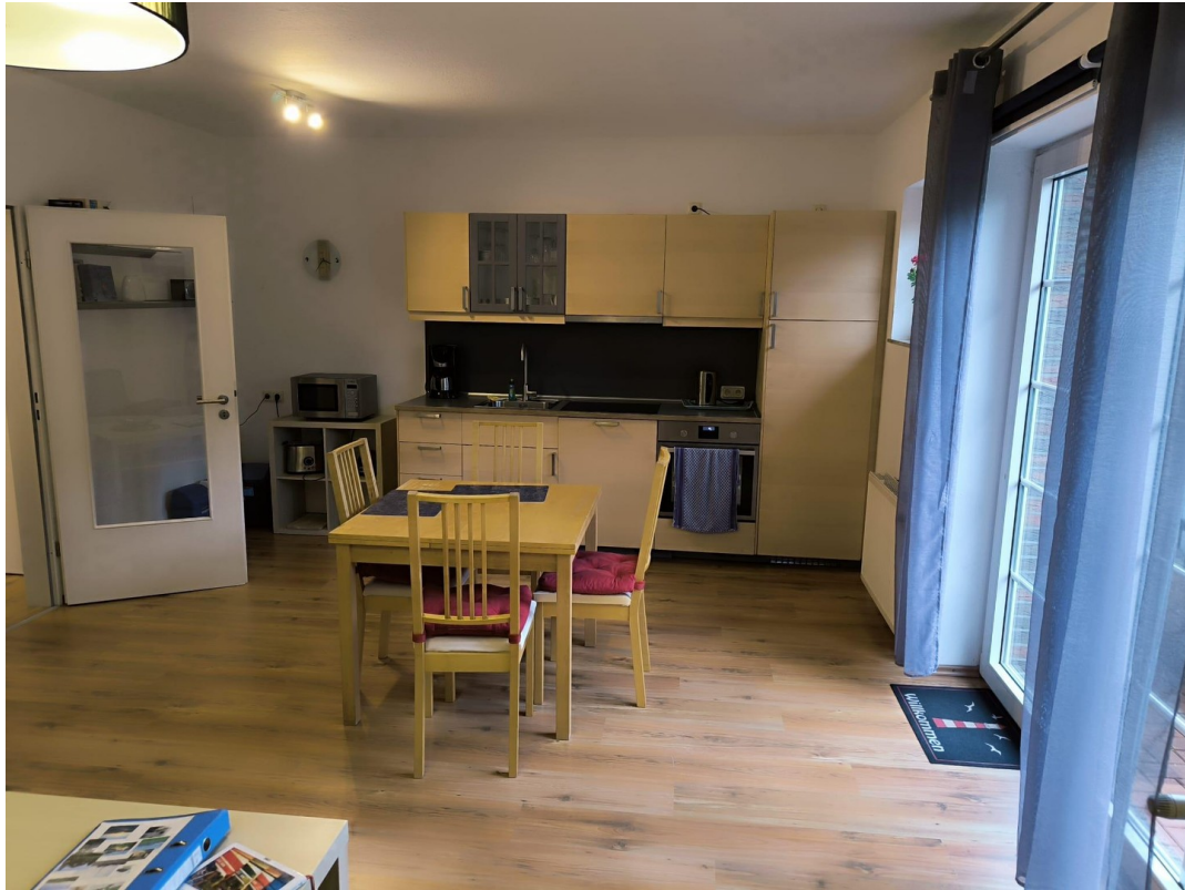
Küche mit Essplatz