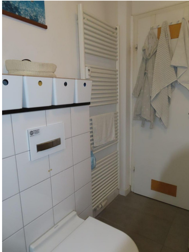
EG Bad 2