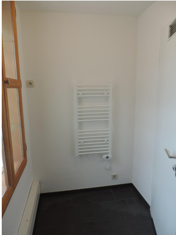
Badezimmer mit Tageslicht