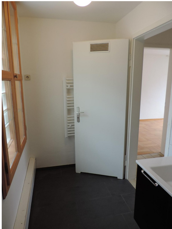
Badezimmer mit Tageslicht