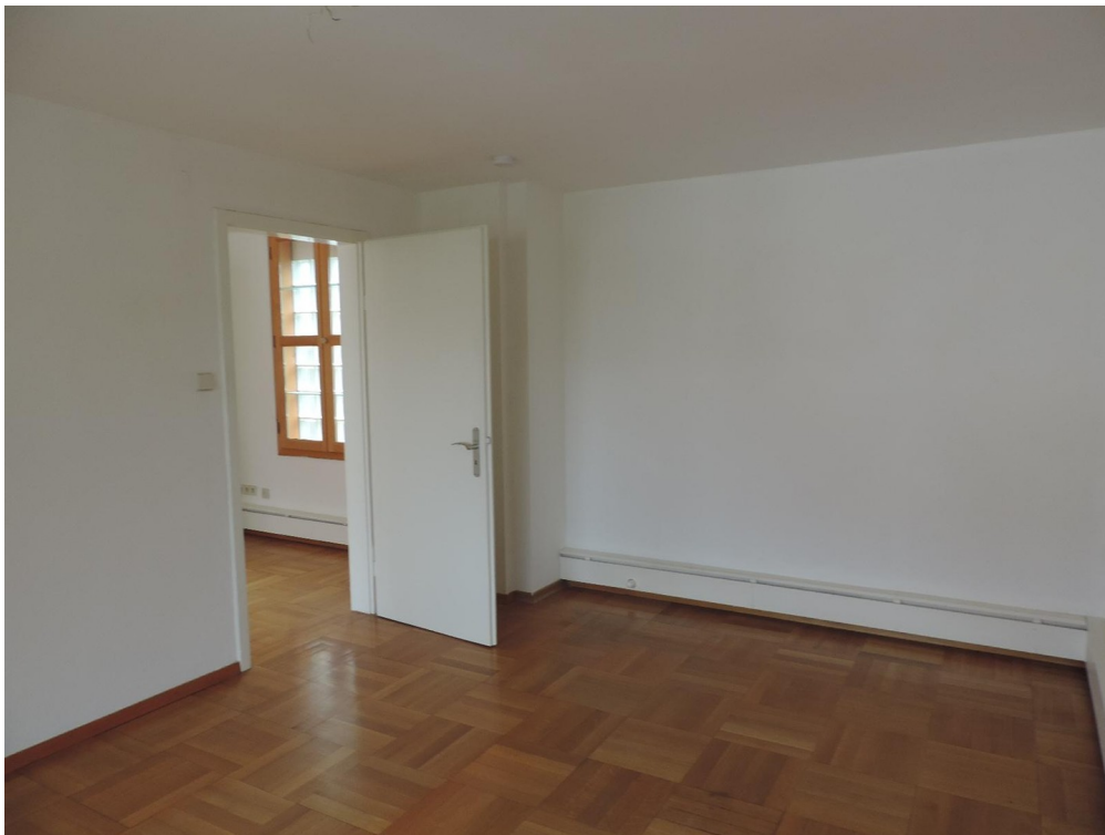
Schlafen / Wohnen