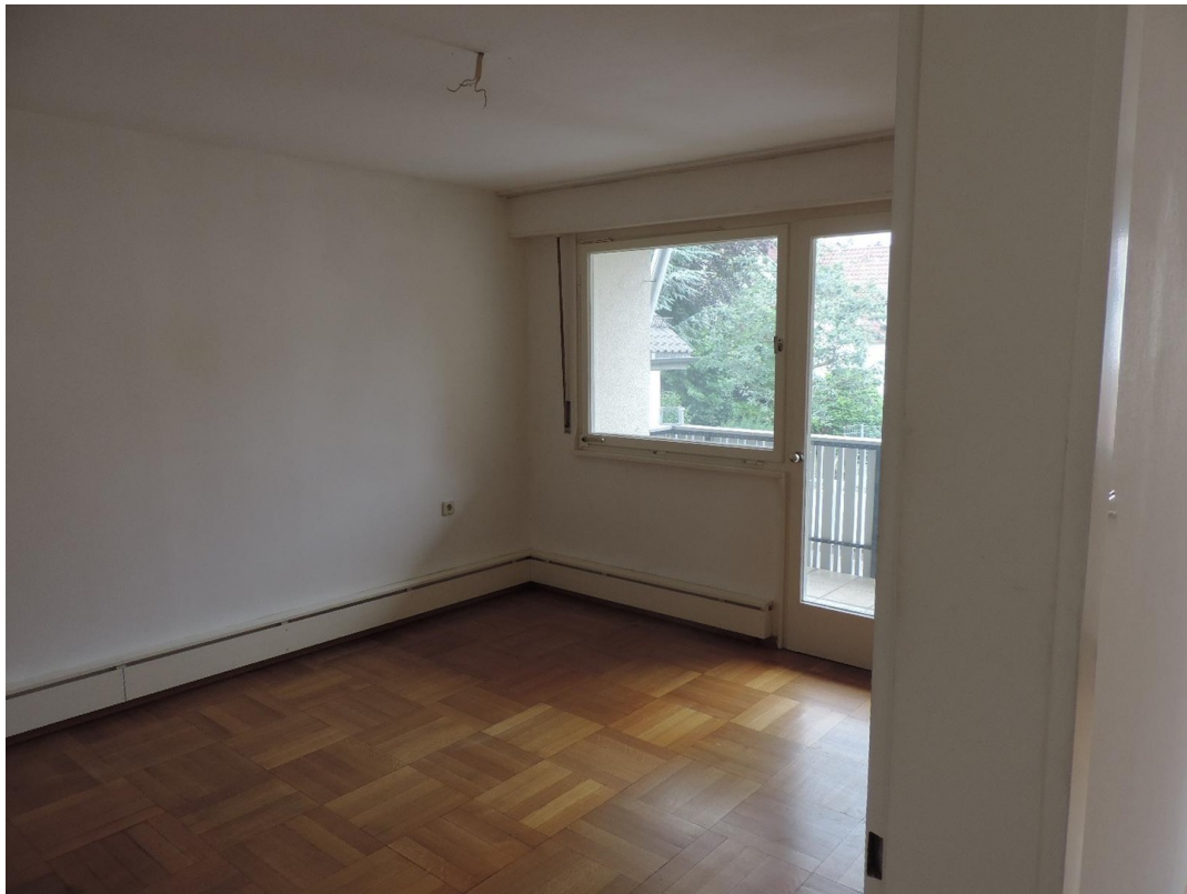
Schlafzimmer mit Balkon