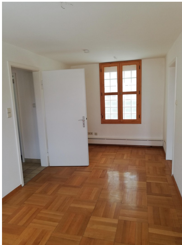
Essen / Wohnen