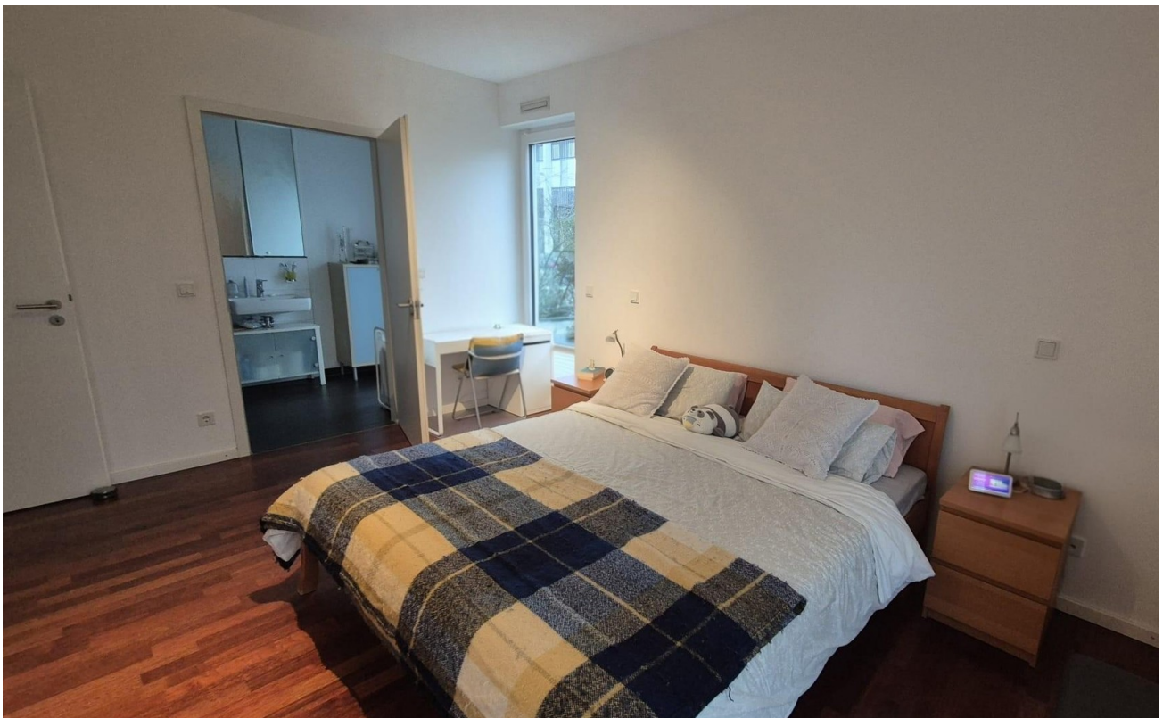
Schlafzimmer Bad en-Suite