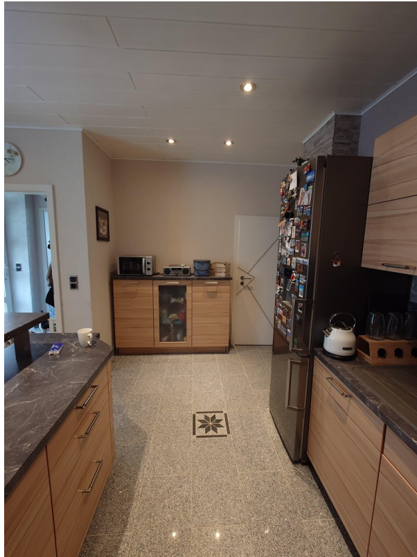
Küche 1. Etage