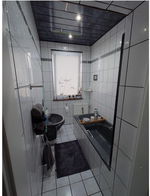
Bad 1. Etage