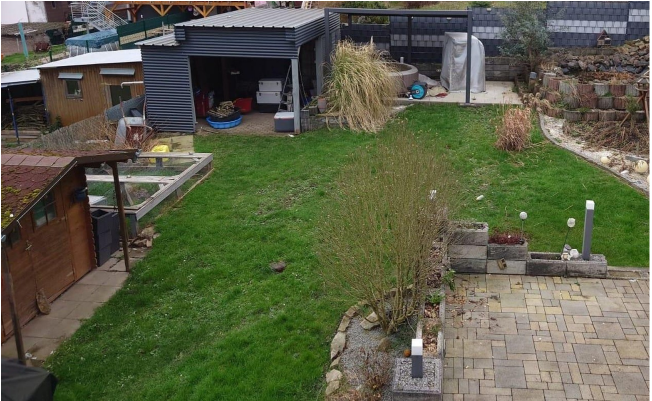
Blick vom Balkon in Garten