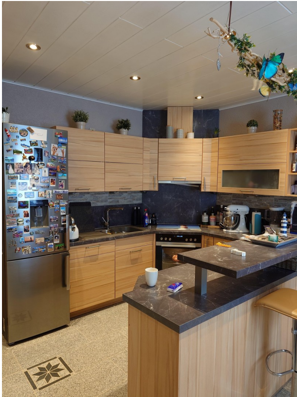
Küche 1. Etage