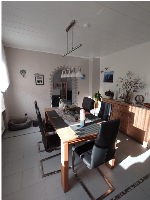
Esszimmer 1. Etage