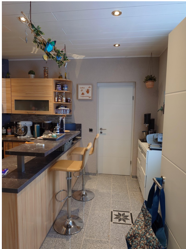
Küche 1. Etage