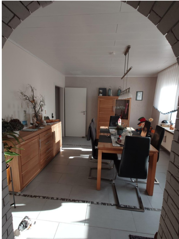
Esszimmer 1. Etage