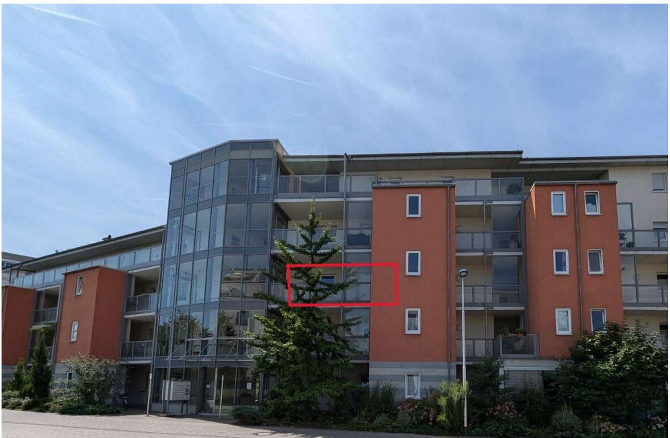
Wohnung von der Straßenseite