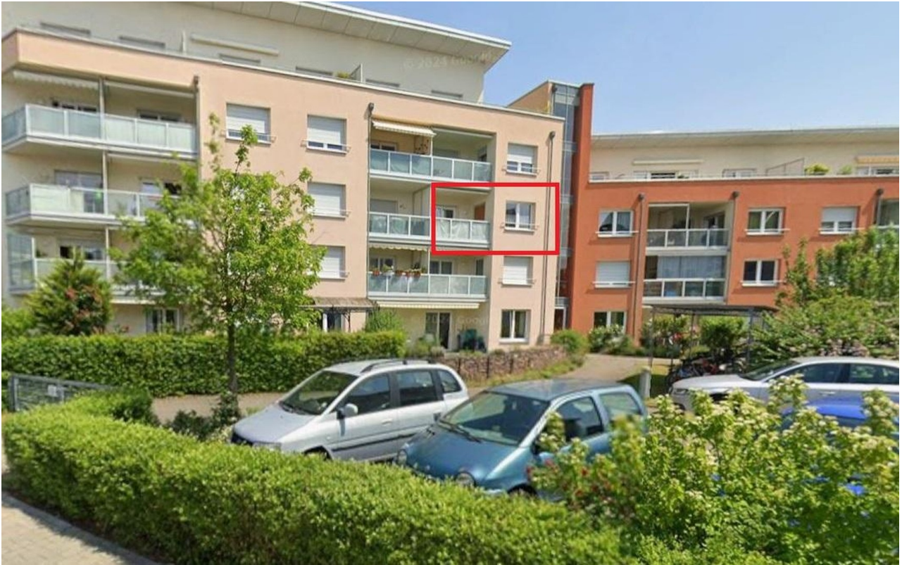
Wohnung von der Gartenseite