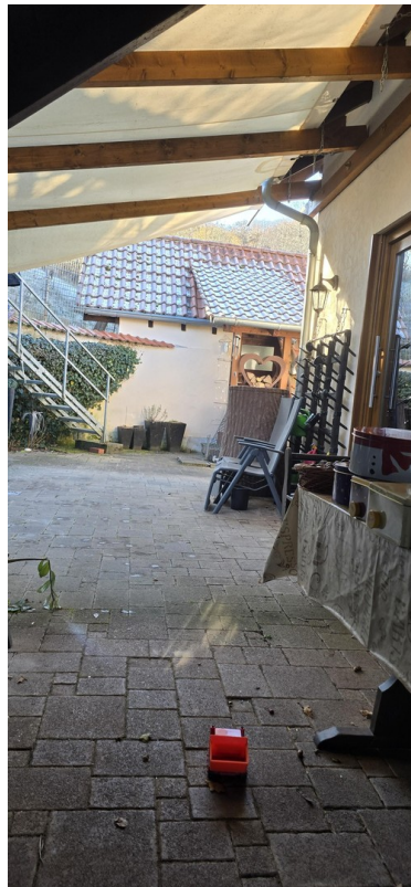
Terrasse hinterm Haus