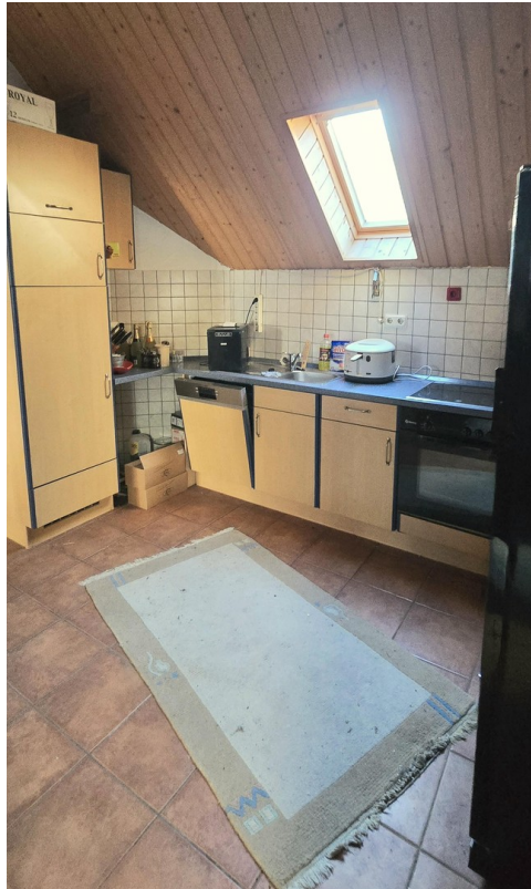
Küche im Partyraum