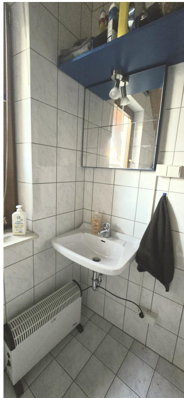
Bad im Partyraum