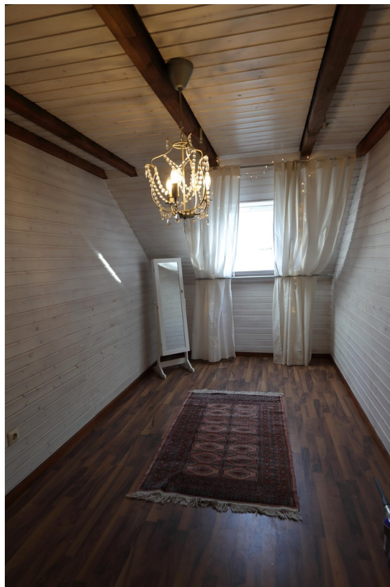
Ankleidezimmer, Gästezimmer DG