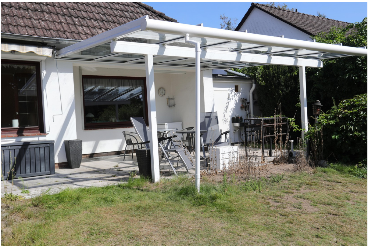
Terasse mit Glasdach