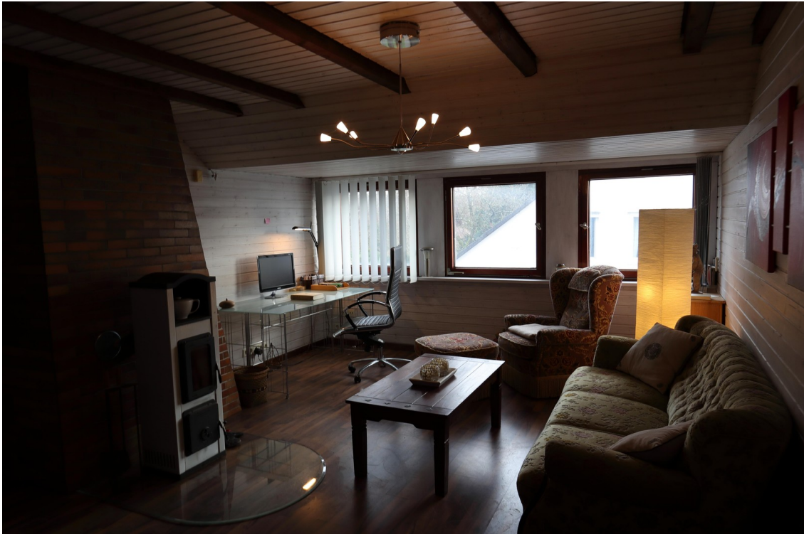
Dachgeschoss Wohnraum Ansicht 2