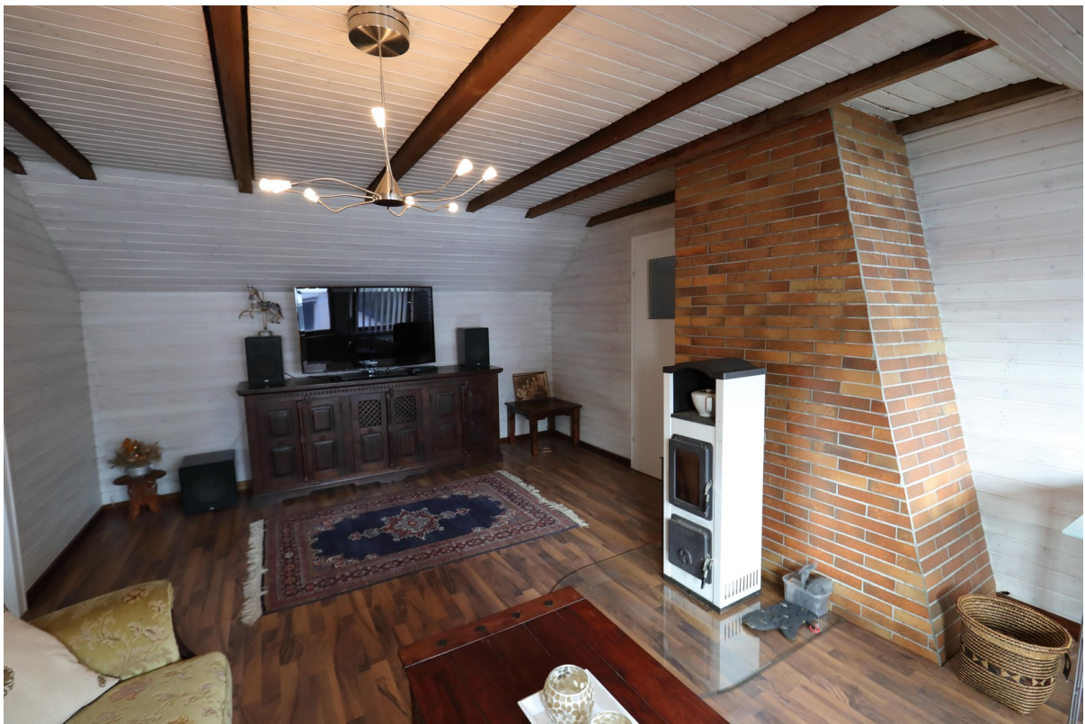
Dachgeschoss Wohnraum Ansicht